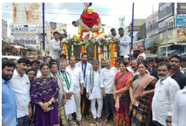
నంద్యాల జిల్లా కేంద్రం శ్రీనివాస సెంటర్ నందు