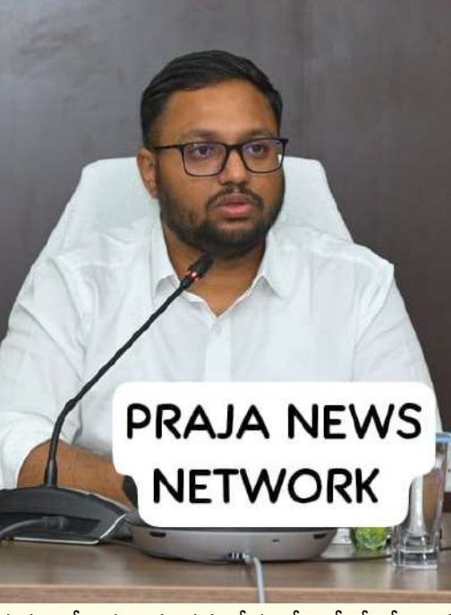
PRAJA NEWS NETWORK

భూ లికార్లుల ప్రక్రియ వేగవంతం చేయాలని అధికారులకు ఆదేశాలు