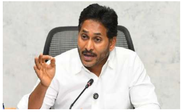
ఆంధ్రప్రదేశ్ లో ముఖ్యమంత్రి చంద్రబాబు నేతృత్వంలోని ప్రభుత్వంలో పోలీసు యంత్రాంగం అత్యంత ప్రమాదకరమైన దిశగా పయనిస్తోందిని వైసీపీ

● చంద్రబాబు హయాంలో పోలీసు వ్యవస్థ ప్రమాదకరంగా మారినది జగన్ విమర్శ ● రాజకీయ ప్రత్యర్థులను అణచివేసేందుకే ఈ ధోరణి అని ఆరోపణ ● నిజమైన నేరాలను వదిలేసి సోషల్ మీడియా యాక్టివిస్టులపై కేసులు పెడుతున్నారని ధ్వజం ● ఇది ప్రజాస్వామ్యంపై దాడి అని, రాజ్యాంగ హక్కులను కాలరాయడమేనని వ్యాఖ్య