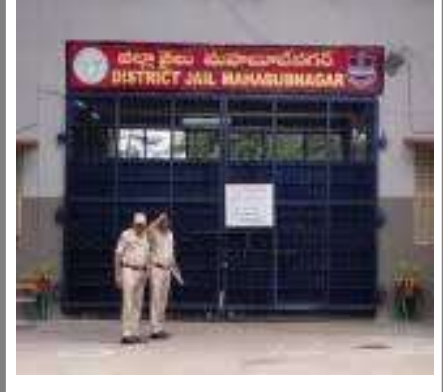
మహబూబ్ నగర్ జిల్లా కేంద్రంలో సంచలన ఘటన చోటుచేసుకుంది. మిగతాది 2లో