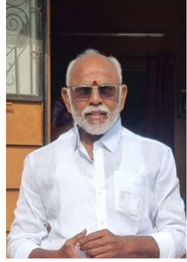
ఆదోని (పల్లె వెలుగు): ఆంధ్రప్రదేశ్ రాష్ట్రములో కొన్ని జిల్లాలలో సీనియర్