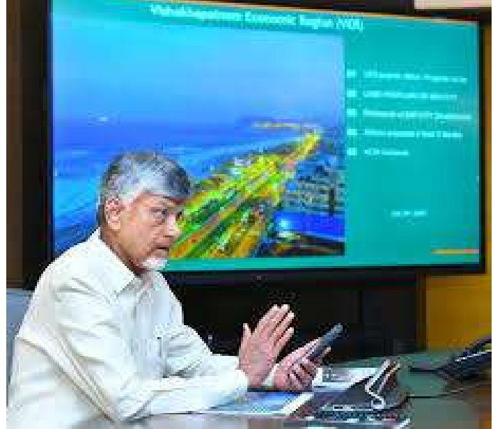
రాష్ట్రంలో అందుబాటులో ఉన్న వనరులను పూర్తిస్థాయిలో సాధ్యమేరకు ఉపయోగించి సమగ్రాభివృద్ధి సాధ్యమవుతుందని ముఖ్యమంత్రి చంద్రబాబు స్పష్టం చేశారు. విశాఖ, అమరావతి, తిరుపతి కేంద్రాలుగా ఏర్పాటు చేసిన మూడు ఎకనామిక్ రీజియన్ల అభివృద్ధిపై సోమవారం సచివాలయంలో అభివృద్ధి చెందిన ప్రాంతాలను తలదన్నేలా, లింగాల మండలంలో ప్రజల తలసరి ఆదాయం రూ. 7.30 లక్షలుగా ఉండటం ఉద్యమ వంటల సత్తాకు నిదర్శనమని సీఎం అన్నారు. తిరుపతి ఎకనామిక్ రీజియన్ (టీఈఆర్) అభివృద్ధికి హార్దికంగా ఒక గ్రోత్ ఇంజనీగా పనిచేస్తుందని, దిశానిర్దేశం చేశారు. పారిశ్రామికంగా ఎంతో

6 నెలల్లో అమరావతి, తిరుపతి రీజియన్ల మాస్టర్ ప్లాన్ రూపకల్పనకు ఆదేశం