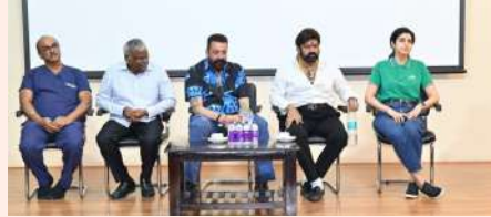
ప్రముఖ బాలీవుడ్ నటుడు సంజయ్ దత్తు సోమవారం హైదరాబాద్‌లోని బసవతారకం ఇండో-అమెరికన్ క్యాన్సర్ మిగతాది 2లో

● బసవతారకం క్యాన్సర్ ఆసుపత్రిని సందర్శించిన సంజయ్ దత్తు ● ఆయనకు స్వాగతం పలికిన బాలకృష్ణ, నారా బ్రహ్మాణి ● ఆసుపత్రి సేవలపై ఆసక్తి చూపారన్న బ్రహ్మాణి ● సంజయ్ దత్తుకు కృతజ్ఞతలు తెలుపుతూ సోషల్ మీడియాలో పోస్ట్