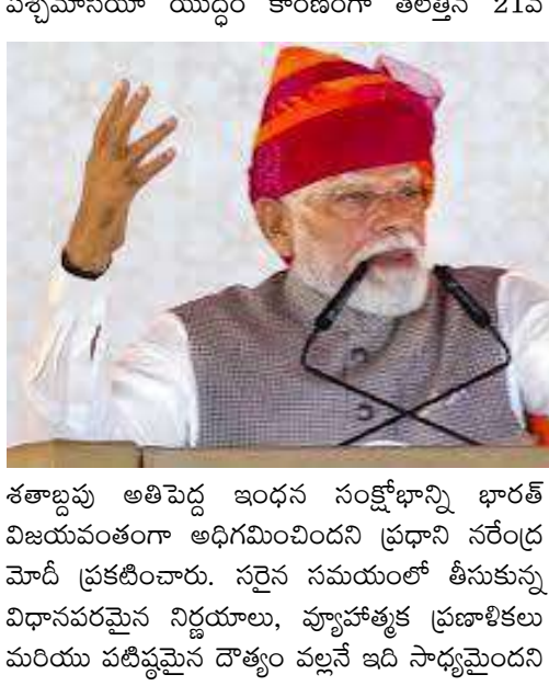
పశ్చిమాసియా యుద్ధం కారణంగా తలెత్తిన 21వ ఆయన స్పష్టం చేశారు. శనివారం రాజస్థాన్ లోని బలోత్తా జిల్లాలో ఒక భారీ ఆయిల్ రిఫైనరీ ప్రాజెక్టును ప్రారంభించిన అనంతరం నిర్వహించిన బహిరంగ సభలో ఆయన ప్రసంగించారు. "నవ భారత సంకల్పం, కృషితో 21వ శతాబ్దపు అతిపెద్ద ఇంధన సంక్షోభాన్ని మనం అధిగమించాం" అని ప్రధాని మోదీ పేర్కొన్నారు. పశ్చిమాసియా యుద్ధం కారణంగా హర్యాణ్ జలసంధి వంటి కీలక సముద్ర మార్గాల్లో ఇంధన సరఫరాకు తీవ్ర విఘాతం ఏర్పడిన విషయాన్ని ఆయన ఈ సందర్భంగా గుర్తుచేశారు. ఇటువంటి క్లిష్ట పరిస్థితుల్లో సంక్షోభాన్ని ముందుగానే అంచనా వేసి, జాతీయ వనరులను సద్వినియోగం

చేసుకోవడంతో పాటు, దౌత్య సంబంధాల ద్వారా వమురు సరఫరాకు అటంకం కలగకుండా చర్యలు తీసుకున్నామని వెల్లడించారు. ఇంధన సంక్షోభం తలెత్తిన సమయంలో వినియోగదారులపై ఆర్థిక భారం పడకుండా ప్రభుత్వ రంగ చమురు సంస్థలు రూ. 75,000 కోట్లకు పైగా నష్టాలను భరించాయని, ప్రభుత్వం వారికి పూర్తి అండగా నిలిచిందని ప్రధాని వివరించారు. దౌత్యపరమైన చొరవతో, మనకు ఇంధనం అందించే దేశాల సంఖ్యను 25 నుంచి 40కి పెంచుకున్నామని, దీనివల్ల దేశంలో ఎక్కడా కొరత ఏర్పడకుండా చూడగలిగామని తెలిపారు. కొందరు ప్రతిపక్ష నేతలు ప్రజల్లో భయాందోళనలను సృష్టించే ప్రయత్నం చేసినప్పటికీ, ప్రభుత్వం తెరవెనుక చేసిన కృషి చరిత్రాత్మకమని వ్యాఖ్యానించారు. ఈ విషయం 'అత్యుద్ధార భారత్' స్ఫూర్తికి నిదర్శనమని ఆయన కొనియాడారు.