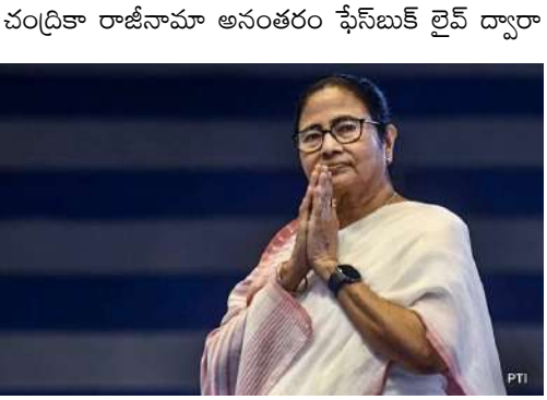
మమతా బెనర్జీ ప్రసంగించారు. కొత్త అధ్యక్షుడిని నియమించడం లేదని, తానే ఆ బాధ్యతలను