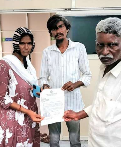
బండి ఆత్మకూరు నంది పత్రిక జూలై 2 : శ్రీశైలం నియోజకవర్గం లోని ఆత్మకూరు మండలం నల్ల