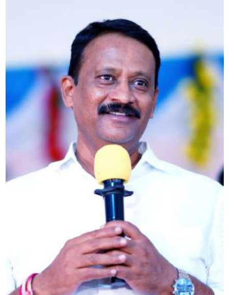
పేర్కొన్నారు. సీఎం రిలీఫ్ ఫండ్ చెక్కుల పంపిణీ.