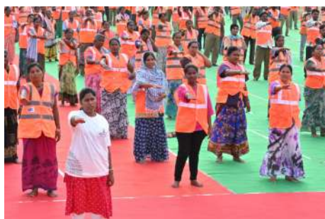
విచ్చేసిన వారందరితో ప్రతిజ్ఞ చేయించారు.