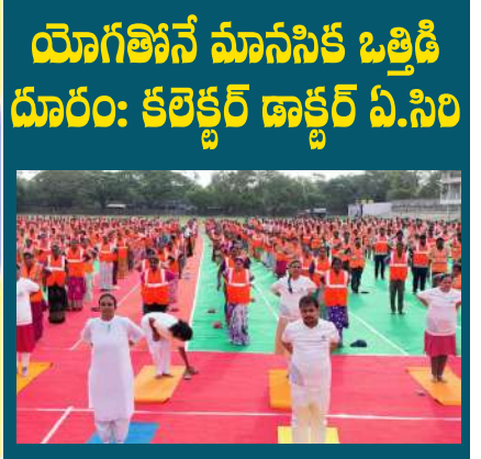
యోగినినే మానసిక ఒత్తిడి దూరం: కలెక్టర్ డాక్టర్ ఏ.సిని

Published From : KURNOOL circulated at Nandyal,Srikakulam,VishakaPatanam,Vijayanagaram,East Godavari ,West Godavari, Krishna, Guntur,Prakasam, Nellore,Chittoor, Kurnool,Kadapa,Anantapuram, Hyderabad ఎడిటర్ : ఎం. మహేష్ యాదవ్ సంపుటి -14 సంచిక - 171 పేజీలు - 08 వెల - 05/- శుక్రవారం 19-06-2026