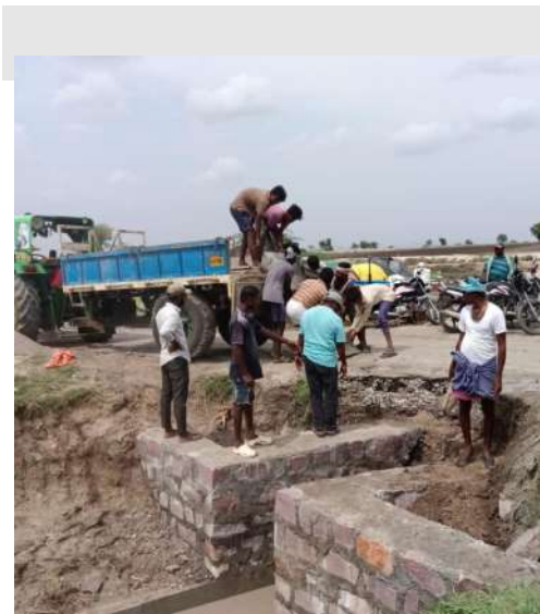
కాంట్రాక్టర్ల నిర్లక్ష్యంతో బస్సు రాక నిలిచింది.. గ్రామస్తుల ఆవేదన