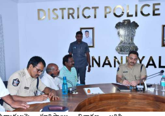
ఫిర్యాదులపై పూర్తిస్థాయి విచారణ జరిపి పరిష్కరించే విధంగా చర్యలు తీసుకుంటామన్నారు.