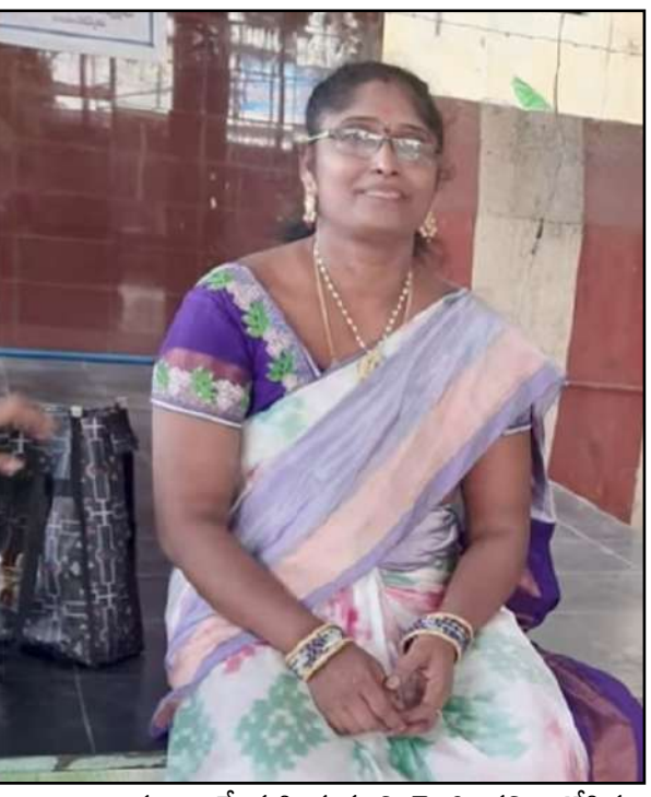
కారణంగానే మహిళ మృతి చెందిందని ఆరోపిస్తూ కేసు నమోదు చేసినట్లు తెలుస్తోంది. పోలీసులు ఘటనపై పూర్తి స్థాయి దర్యాప్తు చేపట్టినట్లు సమాచారం..

ఈ ఘటనపై బాధిత కుటుంబ సభ్యులు నంద్యాల వన్టోన్ పోలీస్ స్టేషన్లో ఫిర్యాదు చేసినట్లు సమాచారం. ఆలయ పాలకవర్గ సభ్యుల నిర్లక్ష్యం