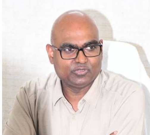
పల్లె వెలుగు కర్నూలు రిపోర్టర్ : కర్నూలు నగరంలో ఆదివారం నిర్వహించనున్న పల్స్

- 5 ఏళ్లలోపు చిన్నారులకు ఆదివారం పోలియో చుక్కలు వేయించుకోవాలి - నగరంలో 82,964 మంది చిన్నారుల కోసం 229 కేంద్రాలు