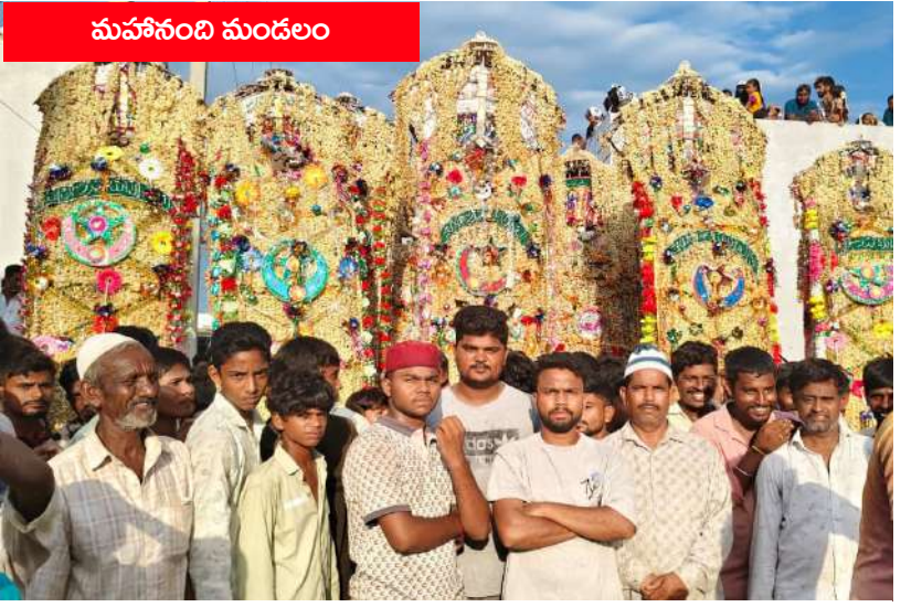
కడపనగరం (వైఎస్సార్ కడప జిల్లా) -- మొహరం సందర్భంగా