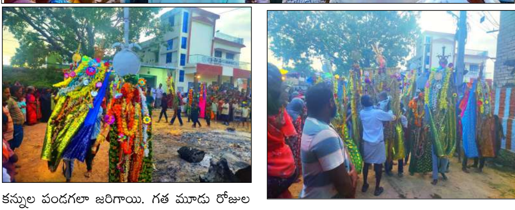
కన్నుల పండగలా జరిగాయి. గత మూడు రోజుల నుండి ఆయా గ్రామాలలో కొలువై ఉన్న పీర్లకు నుండి గ్రామాలలో పీర్లను ఊరేగించారు. మండల