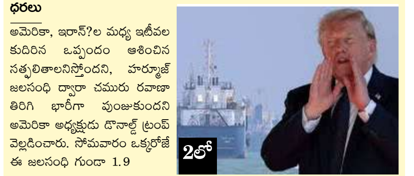
2లో అమెరికా, ఇరాన్ ల మధ్య ఇటీవల కుదిరిన ఒప్పందం ఆశించిన సత్ఫలితాలనిస్తోందని, హార్మోజ్ జలసంధి ద్వారా చమురు రవాణా తిరిగి భారీగా పుంజుకుందని అమెరికా అధ్యక్షుడు డొనాల్డ్ ట్రంప్ వెల్లడించారు. సోమవారం ఒక్కరోజే ఈ జలసంధి గుండా 1.9

హార్మోజ్ జలసంధిలో రికార్డు స్థాయిలో ఆయిల్ రవాణా: ట్రంప్ హార్మోజ్ జలసంధిలో ఒక్కరోజే 19 మిలియన్ బ్యారెళ్ల ఆయిల్ రవాణా ఇరాన్ తో ఒప్పందం వల్లే ఇది సాధ్యమైందని ప్రకటించిన డొనాల్డ్ ట్రంప్ ఈ పరిణామంతో ప్రపంచవ్యాప్తంగా తగ్గుముఖం పడుతున్న చమురు ధరలు