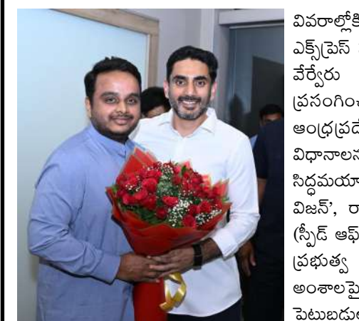
ఆయన ఉపయోగించుకోనున్నారు. ఈ పర్యటన ద్వారా ఏపీ ప్రభుత్వ ప్రాధాన్యతలను జాతీయ స్థాయిలో వివరించనుండటం ప్రాధాన్యత సంతరించుకుంది.