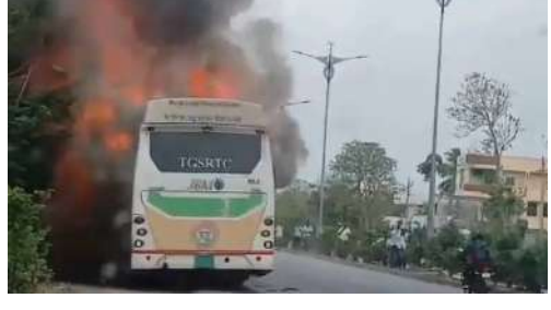
అప్రమత్తత వల్లే పెను ప్రమాదం తప్పిందని ప్రయాణికులు తెలిపారు.

అగ్నిమాపక సిబ్బంది ఘటనా స్థలానికి చేరుకుని మంటలను ఆర్పివేశారు. ఈ ప్రమాదంలో ఎవరికీ ఎలాంటి గాయాలు కాకపోవడంతో ప్రయాణికులతో పాటు అధికారులు ఊపిరి పీల్చుకున్నారు. డ్రైవర్