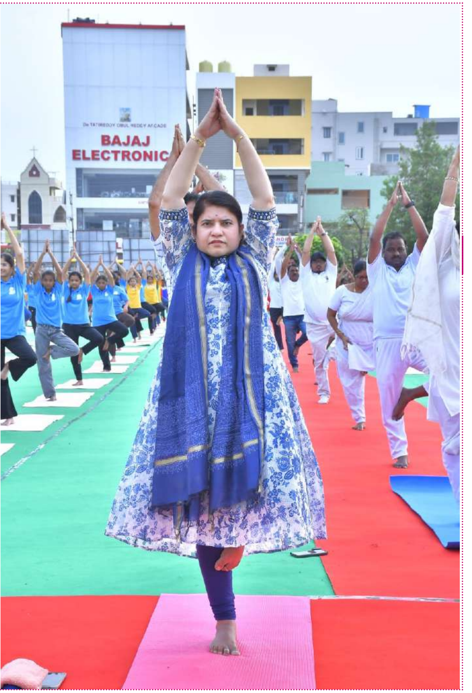
యోగా ద్వారా విద్యార్థులు చెడు వ్యసనాలకు దూరంగా ఉండటంతో పాటు

జిల్లావ్యాప్తంగా 4,700 కేంద్రాల్లో నిర్వహించిన యోగా కార్యక్రమాల్లో సుమారు 4 లక్షల మంది ప్రజలు భాగస్వాములై యోగాపై తమ ఆసక్తిని చాటుకున్నారుని వెల్లడించారు. యోగా భారతదేశం ప్రపంచానికి అందించిన అమూల్యమైన జీవన విధానమని కలెక్టర్ పేర్కొన్నారు. నేడు ప్రపంచవ్యాప్తంగా అనేక దేశాలు యోగాను ఆచరిస్తున్నాయని, ఆరోగ్యవంతమైన సమాజ నిర్మాణంలో యోగా కీలక పాత్ర పోషిస్తోందని చెప్పారు. ఈ ఏడాది అంతర్జాతీయ యోగా