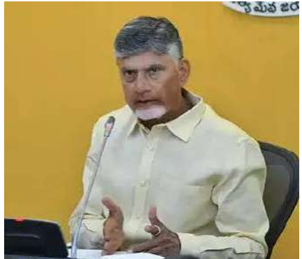
సమగ్రంగా ఇందులో పొందుపరచాలన్నారు. ప్రభుత్వంపై వస్తున్న అసత్య ప్రచారాలను (ఫేక్ న్యూస్) తిప్పికొట్టేందుకు, వాస్తవాలను

రాజధాని, విద్యుత్, శాంతిభద్రతలు, మైనింగ్, ఎక్సైజ్ వంటి అంశాలపై వాస్తవ పరిస్థితులను ఆ శ్వేతపత్రాల ద్వారా ప్రజల ముందు ఉంచారు. ఇప్పుడు ఆ శ్వేతపత్రాలకు కొనసాగింపుగా ఈ 'ప్రోగ్రెస్ రిపోర్ట్' ఉండాలని సీఎం సూచించారు. వివిధ శాఖల్లో వచ్చిన మార్పులు, అమలు చేస్తున్న సంక్షేమ పథకాలు, అభివృద్ధి కార్యక్రమాలు, పాలనా సంస్కరణలను