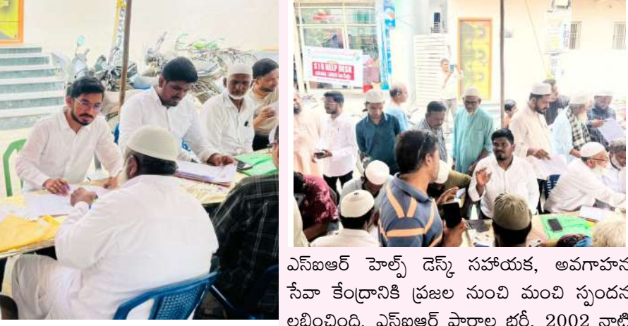
ఎస్ఐఆర్ హెల్త్ డెస్క్ సహాయక, అవగాహన సేవా కేంద్రానికి ప్రజల నుంచి మంచి స్పందన లభించింది. ఎస్ఐఆర్ ఫారాల భర్తీ, 2002 నాటి

ఓటరు వివరాల పరిశీలన, ఫారాల భర్తీకి ప్రజలకు సహాయం.