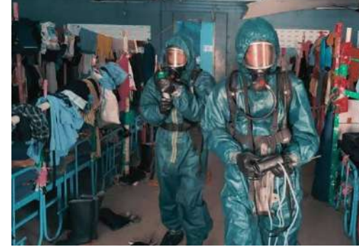
సమీపంలోని కన్సైన్మెంట్ గ్రామంలో ఉన్న రొయ్యల ఆసుపత్రులకు తరలించారు. వీరిలో 9 మంది పశుత్తి

వివరాల్లోకి వెళితే, తిరువళ్ళూరు జిల్లా పెరియపాళయం ప్రాసెసింగ్ కంపెనీలో ఈ ప్రమాదం జరిగింది.