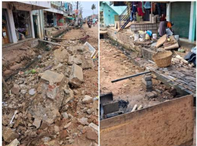
శనివారం జూన్ 06 :- జాతీయ రహదారి (ఓన్ 365దీదీ) విస్తరణ పనులు అత్యంత నత్తనడకన

సాగుతుండటంతో స్థానిక ప్రజలు, వ్యాపారులు తీవ్ర ఇబ్బందులు ఎదుర్కొంటున్నారు. దశాబ్దాలుగా రోడ్డు పక్కన నివసిస్తూ, వ్యాపారాలు చేసుకుంటున్న వారు విస్తరణలో ఇక్కడ దుకాణాలు కోల్పోయి జీవనాధారం లేక అల్లాడుతున్నారు. నమీవంటలోని ఇతర గ్రామాలకు నష్టపరిహారం అందించిన అధికారులు, దొండపూడి వాసుల విషయంలో తీవ్ర వివక్ష చూపుతున్నారని గ్రామస్థులు ఆరోపిస్తున్నారు. గత ఏప్రిల్ నెలలో చేపట్టిన రోడ్డు విస్తరణ పనుల్లో భాగంగా డ్రైనేజీ పూడికతీత పనులు చేపట్టి, వాటిని పూర్తి చేయకుండానే మధ్యలో వదిలేయడం వల్ల భవనాలు, షాపులు దెబ్బతినే ప్రమాదం పొంది ఉంది. తెలిచి ఉన్న డ్రైనేజీ గుంతల కారణంగా వృద్ధులు, చిన్నారులు బయటకు రావాలంటేనే భయపడాల్సిన దుస్థితి నెలకొంది. ఎవరైనా పొరపాటున ఈ గుంతల్లో పడిపోయే ప్రమాదం ఉండటంతో ప్రజలు ఆందోళన చెందుతున్నారు. దీనికి తోడు గ్రామంలోని తాగునీటి ప్రైవైజైస్సు ధ్వంసమవుతుంటే ప్రజలు తీవ్ర నీటి ఎద్దడితో ఇబ్బందులు పడుతున్నారు. ఇబ్బందికైనా సంబంధిత ఉన్నతాధికారులు మరియు నేషనల్ హైవే కాంట్రాక్టర్లు తక్షణమే స్పందించి, ప్రమాదకరంగా మారిన డ్రైనేజీ పనులను పూర్తి చేయాలని, నీటి సమస్యను పరిష్కరించి నిర్మాణానికి తగిన న్యాయం చేయాలని గ్రామస్థులు డిమాండ్ చేస్తున్నారు.