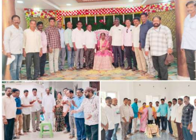
శనివారం జూన్ 06 :- కాకినాడ జిల్లా తాళ్లరేవులోని నామన వెంకాయమ్మ జిల్లా పరిషత్తు ఉన్నత పాఠశాలలో 1989-90 విద్యా