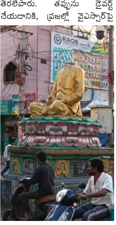
వైయస్ఆర్ విగ్రహం ధ్వంసం చేసిన వ్యక్తి.

నిందితుడు వైసీపీ నాయకులతో ఉన్న పాత ఫోటోలను అంత వేగంగా బయటకు తీసి ప్రచారం చేయడం వెనుక అసలు రహస్యం ఏంటి? ఇది ముమ్మాటికీ ముందస్తు వ్యూహంతో చేసిన రాజకీయ కుట్రే అని వైసీపీ శ్రేణులు మండిపడుతున్నాయి. తప్పు చేసింది ఎవరో తేలకముందే, పోలీసులు పూర్తిస్థాయి విచారణ చేయకముందే.. బురదజల్లే రాజకీయాలకు