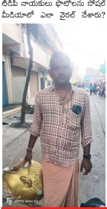
వైయస్ఆర్ విగ్రహం ధ్వంసం చేసిన వ్యక్తి.

పల్లె వెలుగు నంద్యాల జిల్లా బ్యూరో. నంద్యాల శ్రీనివాస నగర్ సెంటర్లో తీవ్ర ఉద్రిక్తత, పెను సంచలనం చోటుచేసుకుంది! కోట్లాది మంది గుండెల్లో నిలిచిన ప్రజానేత, స్వర్గీయ డాక్టర్ వైఎస్ రాజశేఖర్ రెడ్డి విగ్రహాన్ని కొందరు దుండగులు అత్యంత దారుణంగా ధ్వంసం చేశారు. ఈ ఘటన చూసి వైఎస్ఆర్ అభిమానులు, సామాన్య ప్రజలు కన్నీరుమున్నీరవుతున్నారు. అయితే.. ఈ విగ్రహ ధ్వంసం వెనుక ఒక భయంకరమైన రాజకీయ కుట్ర దాగి ఉందనే అనుమానాలు ఇప్పుడు పెను దుమారం రేపుతున్నాయి! నిజంగా ఇది యాదృచ్ఛికంగా జరిగిన ఘటనేనా? లేక కావాలనే పథకం ప్రకారం చేసిన కుట్రనా? విగ్రహాన్ని ధ్వంసం చేసిన కేవలం ఐదు నిమిషాల్లోనే.. నిందితుడు వైసీపీ కార్యకర్త అంటూ కూటమి నేతలు,