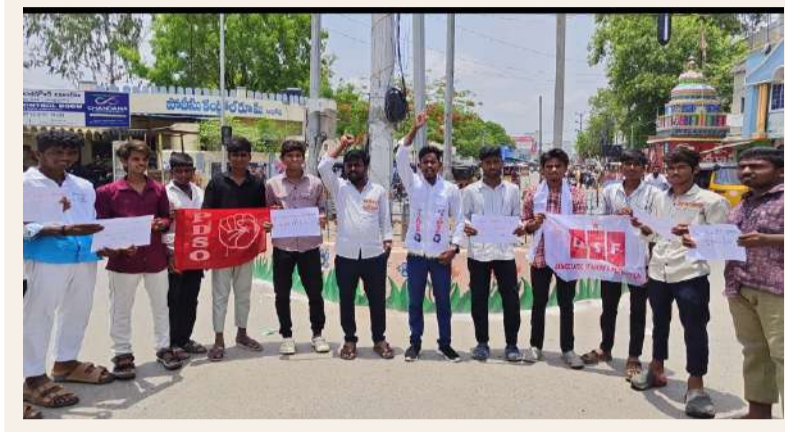
ఆదోని (పల్లె వెలుగు):

విద్య అంటే అంగట్లో దొలకే సరుకు కాదు కార్పొరేట్ నారాయణ పాఠశాల పై చర్యలు తీసుకోవాలి డి ఎన్ ఎఫ్, పిడిఎస్ఓ డిమాండ్.