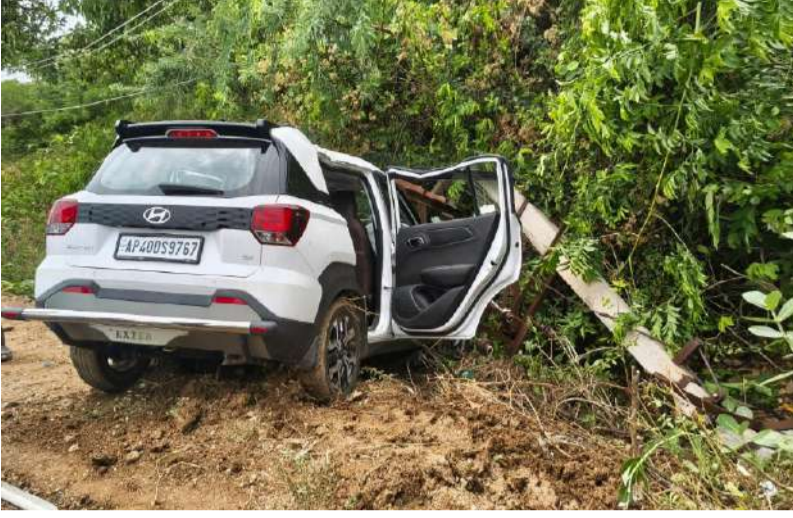
స్తంభాన్ని ఢీకొన్న కారు.. వ్యక్తికి స్వల్ప గాయాలు

త్వటిలో తప్పిన పెను ప్రమాదం. అధికారులు స్పందించండి.