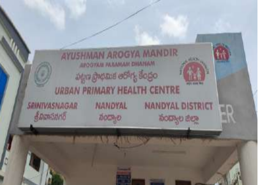
పల్లె వెలుగు నంద్యాల జిల్లా బ్యూరో.

నంద్యాల పట్టణంలోని స్థానిక శ్రీనివాస నగర్ లో ఉన్న పట్టణ ప్రాథమిక ఆరోగ్య కేంద్రంలో డాక్టర్ కొరత రోగులకు వెంటాడుతుంది. పట్టణ ప్రాథమిక ఆరోగ్య కేంద్రంలో స్టాఫ్ సర్వే చక్రవర్తి డాక్టర్ లేని కొరతను తీరుస్తూ రోగులకు వైద్యం అందిస్తున్నారు. పట్టణ ప్రాథమిక ఆరోగ్య కేంద్రంలో డాక్టర్ లేక సుమారు మూడు నెలల నుండి ఐదు నెలల అవుతుందని రోగులు వాపుతున్నారు. నంద్యాల మున్సిపాలిటీ కార్యాలయానికి కూతవేటు దూరంలో శ్రీనివాస్ సెంటర్లో ఉన్న పట్టణ ప్రాథమిక ఆరోగ్య