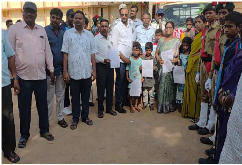
ప్రైవేట్ కార్పొరేట్ పాఠశాలల్లో చదువుతున్న విద్యార్థులు ప్రభుత్వ పాఠశాలల్లో చేరాలి.