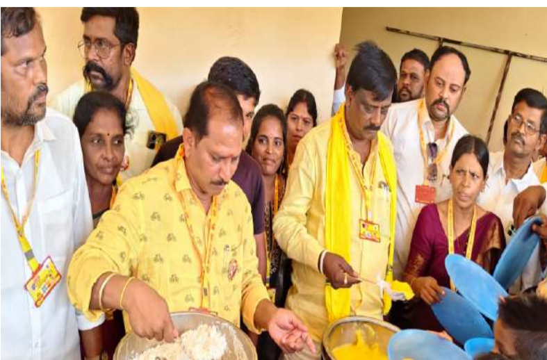
నివాకులపిండిన టిడిపి నాయకులు కార్యకర్తలు.