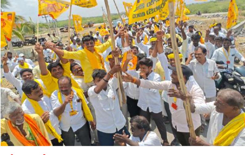
భారీ సంఖ్యలో తరలివచ్చిన పసుపు సైన్యం జోహార్ ఎన్టీఆర్ నివాదాలతో హోరెత్తిన నాగలదిన్నె గ్రామం