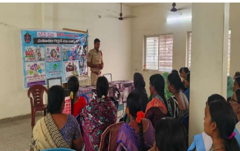
గడివేముల పల్లె వెలుగు దిన పత్రిక