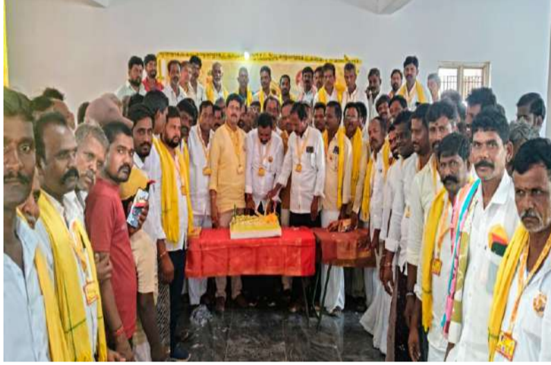
--కేక్ కట్ చేసి శుభాకాంక్షలు తెలిపిన టిడిపి నాయకులు..