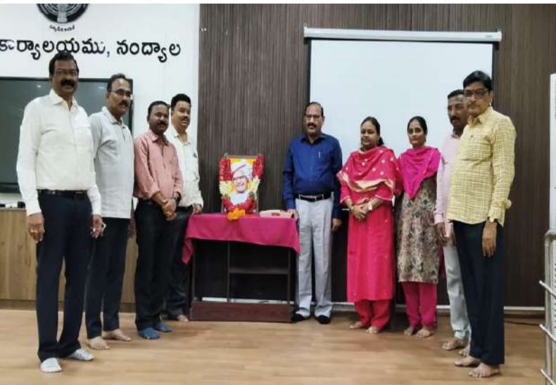
తెలుగు జాతి ఆత్మగౌరవానికి చిరస్మరణీయ ప్రతీక ఎన్టీఆర్ - డిఆర్ఓ రాము నాయక్.