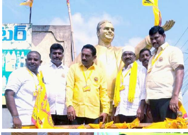
బండి ఆత్మకూరు పల్లె వెలుగు మే 28 :