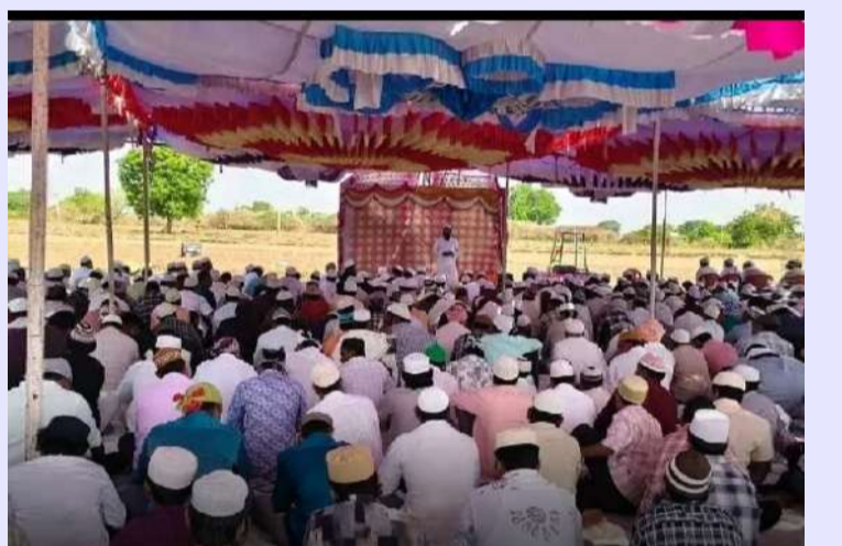
పల్లె వెలుగు దిన పత్రిక

గడివేముల నంద్యాల జిల్లా గడివేముల మండలం పరిధిలో ఉన్న అన్ని గ్రామంలో ముస్లిం ముల ఆధ్వర్యంలో ఆయా గ్రామాలలో ఉన్న ప్రజలు ఘనంగా నిర్వహించారు, బక్రీద్ పండగ మహోన్నతి త్యాగానికి ప్రీతిక పైన బక్రీద్ పండుగను గురువారం మండలంలోని అన్ని గ్రామాలలో ముస్లింలు భక్తేత్ర జరుపుకున్నారు ఆయా గ్రామంలో ఈద్దాల దగ్గరికి వెళ్లి ప్రార్థనలు పాఠించి సామూహిక పద్ధతులొ ముస్లింలు స్థానిక గ్రామాల వద్ద నుంచి అక్కడికి చేరుకున్నారు అక్కడి నుంచి వారు ప్రత్యేక ప్రార్థనలు నిర్వహించి అనంతరం ముస్లింలు ఒకరినొకరు అలింగం చేసుకుని భక్తితో అల్లా ప్రీతికరంతో ప్రార్థన నిర్వహించారు అనంతరం వారు ముస్లిం మత పెద్దల ఆధ్వర్యంలో నిర్వహించిన వాక్య బోధన ద్వారా పద్ధతులను పాఠించి సమాజానికి మంచి చేసే విధంగా చేకూర్చులని ఈ కార్యక్రమంలో తెలిపారు,ఈ కార్యక్రమంలో ముస్లిం పెద్దలు బారి పాల్గొని ఈ పండుగ జరుపుకోవడం జరిగింది.