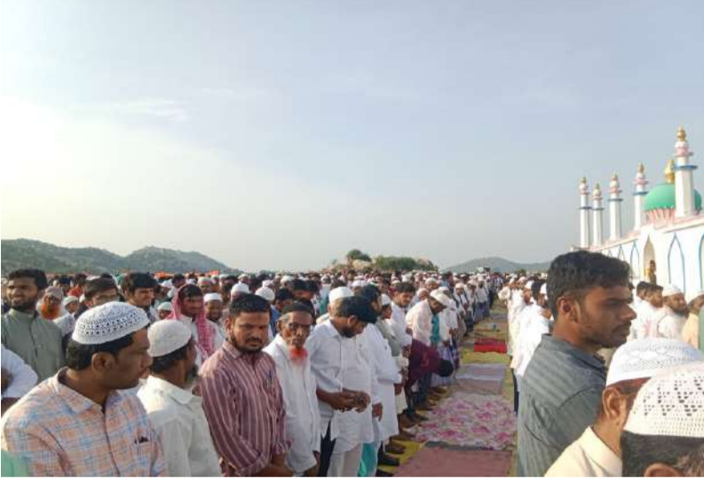
హోళగుండ పల్లె వెలుగు మే 28