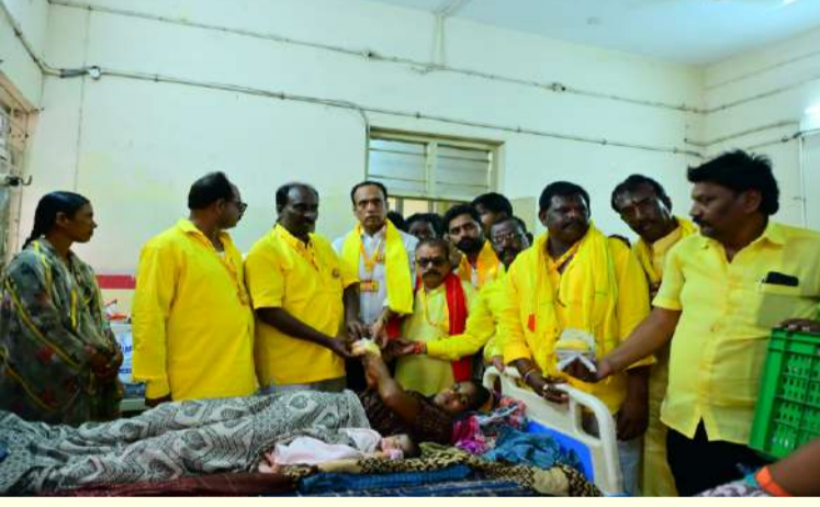
ఆదోని (పల్లె వెలుగు) :