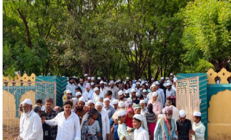
భద్రత ఏర్పాట్లను స్వయంగా పరిశీలించిన జిల్లా ఎస్పీ.