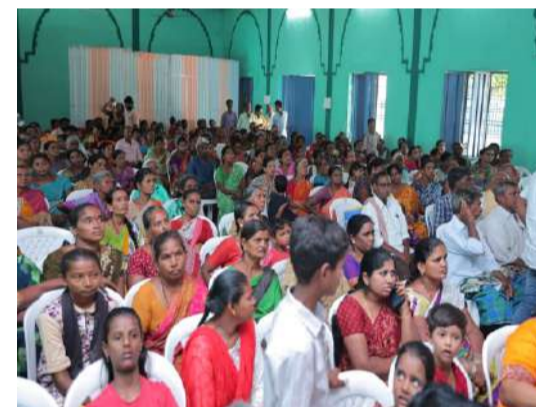
క్లస్టర్ స్థాయిలో హైబ్రిడ్ విధానం