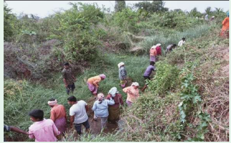
రుద్రవరం. పల్లె వెలుగు :

రుద్రవరం మండలంలో ఉపాధి పనులు ముమ్మరంగా కొనసాగుతున్నాయి. మండలంలోని అలమూరు, మందలూరు కోటకొండ, యల్లాపత్తుల, చిన్నకంబలూరు, పేరూరు, రుద్రవరం గ్రామాలతో పాటు ఆయా గ్రామాల పరిధిలోని ఎంట కాలువలలో ఉపాధి పనులు కూలీలు చేపడుతున్నారు. ప్రస్తుతం ఎండలు అధికంగా ఉండడంతో కూలీలను ఉదయాన్నే వెళ్లి పనులు చేయాలిందిగా ఉపాధి అధికారులు సిబ్బంది కూలీలను హెచ్చరిస్తున్నారు. మండల కేంద్రమైన రుద్రవరంలో సుమారు 1500 మంది కూలీలు ఉపాధి పనుల్లో పాల్గొంటున్నట్లు ఉపాధి సిబ్బంది తెలుపుతున్నారు. పనులు జరిగే ప్రదేశంలో పనులు చేసిన తర్వాత చెట్ల కింద సేద తీరాలని కూలీలకు సూచిస్తున్నట్లు ఉపాధి అధికారులు తెలిపారు.