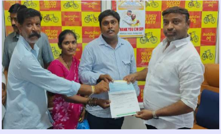
పల్లె వెలుగు సంద్యాల జిల్లా బ్యూరో.