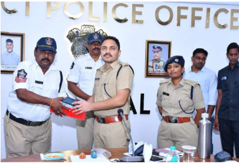
నంద్యాల జిల్లా ఎస్పీ సునీల్ షోరాణ్ ఐపీఎస్.