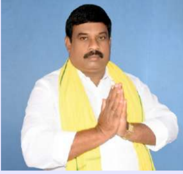
పల్లె వెలుగు సంద్యాల జిల్లా బ్యూరో.