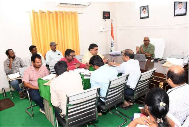
క్షేత్రస్థాయిలో పర్యటిస్తూ పనుల నాణ్యతపై ప్రత్యేక దృష్టి పెట్టాలి ప్రాధాన్యత క్రమంలోనే అంచనాలు రూపొందించాలి