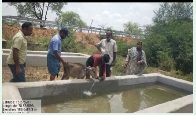
రుద్రవరం. పల్లె వెలుగు :