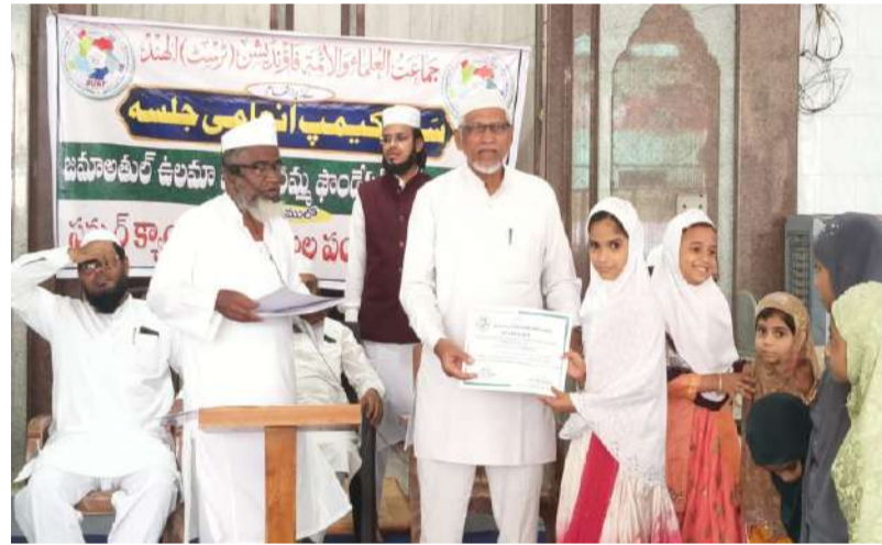
చిన్నారి వ్యాయాలలో ఉత్తమ వ్యక్తిత్వం, నైతిక విలువలు నింపండి - సమద్, అబులైస్.