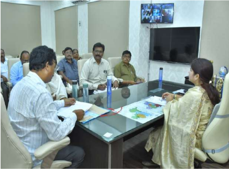
అక్షరాస్యత ఉద్యమంలో రాష్ట్రంలోనే తొలి ఐదు జిల్లాల్లో నంద్యాల స్థానం.

ప్రతి ఒక్కరి భాగస్వామ్యంతో నిరక్షరాస్యత నిర్మూలన సాధ్యం.