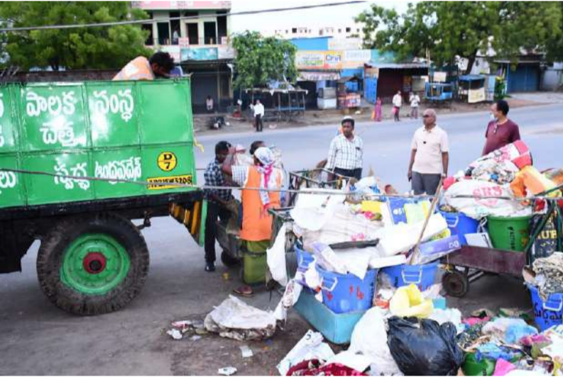
ఉద్యోగ విధుల్లో బాధ్యతారాహిత్యం పనికిరాదు నగరపాలక సంస్థ కమిషనర్ చల్లా ఓబలేసు