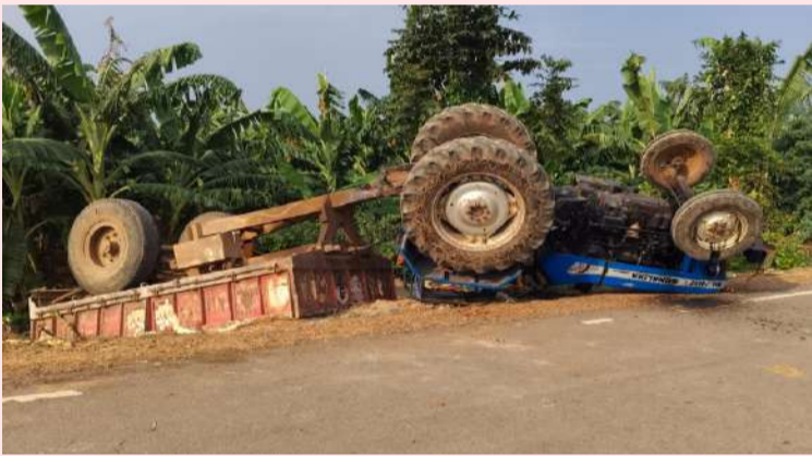
మహానంది, పల్లె వెలుగు

మహానంది మండలం గాజులపల్లె గ్రామంలో ట్రాక్టర్ అదుపు తప్పి బోల్తా పడింది. సోమవారం గాజులపల్లె నుంచి బసాపురానికి నిర్మాణ సామగ్రి తరలిస్తుండగా ప్రమాదవశాత్తు ట్రాక్టరు, ట్రాలీ బోల్తా పడ్డాయని స్థానికులు తెలిపారు. అదృష్టవశాత్తు ఈ ఘటనలో ఎవరికీ గాయాలు కాకపోవడంతో అంతా ఊపిరి పీల్చుకున్నారు. వెంటనే స్థానికులు సహాయక చర్యలు చేపట్టారు.