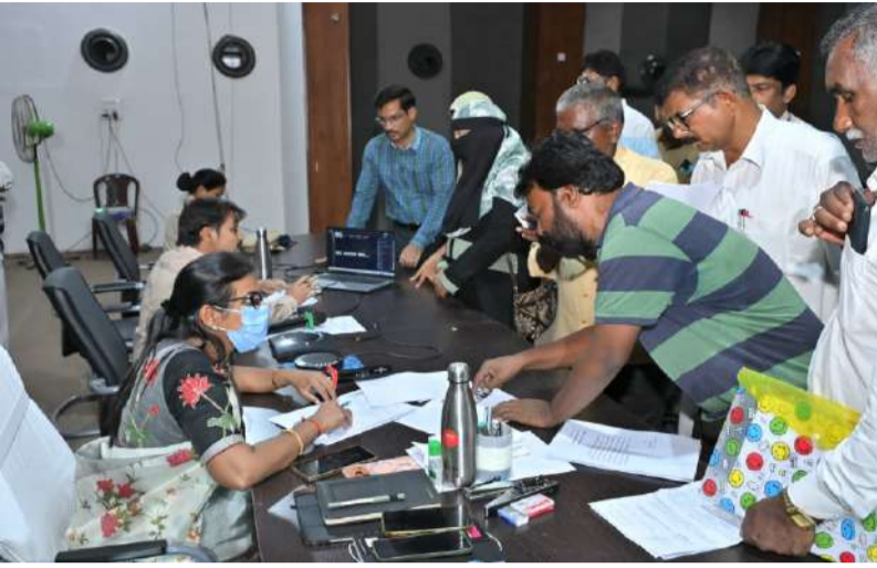
ప్రజా సమస్యల పరిష్కారంలో నిర్లక్ష్యం వహిస్తే చర్యలు తప్పవు 'రి ఓపెన్' కేసుల శాశాన్వి పూర్తిగా తగ్గించాలి: జిల్లా కలెక్టర్ డాక్టర్ ఏ. సిరి