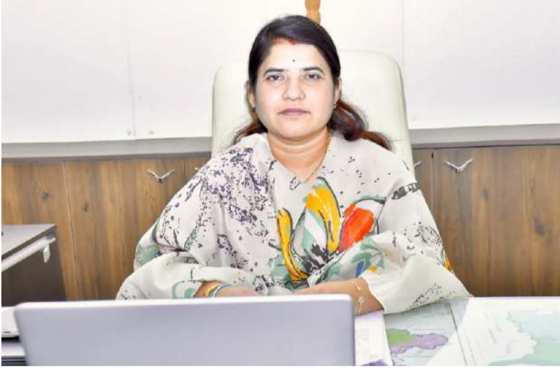
ఆరు మున్సిపాలిటీల్లో పరిశుభ్రత పనులు వేగవంతం చేయాలి.

డ్రైన్లు, గార్డెజ్ పాయింట్లు, పబ్లిక్ టాయిలెట్లపై ప్రత్యేక దృష్టి.