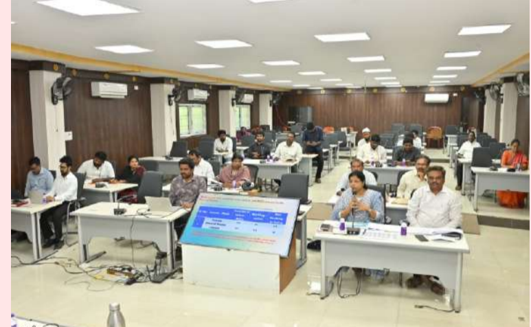
పల్లెవెలుగు కర్నూలు క్రైమ్.