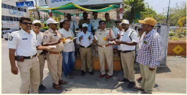
పల్లె వెలుగు కర్నూలు బ్యూరో

ఎస్సీ విక్రాంత్ పాటిల్ ఆదేశాలతో కర్నూలులో నెల రోజులుగా కొనసాగుతున్న సేవలు