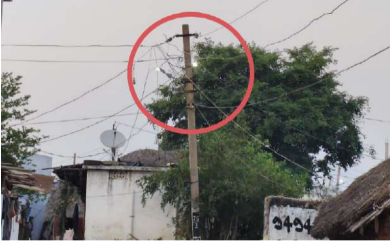
పగలే వెలుగుతున్న దీపాలు.. వందలాది విద్యుత్ యూనిట్ల వృధా.. మురుగుతో నిండిన డ్రైనేజీలు.