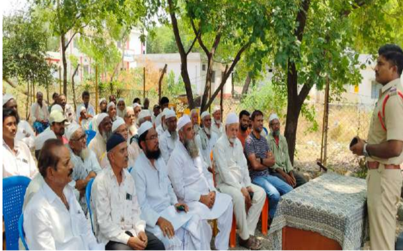
గడివేముల పల్లె వెలుగు దిన పత్రిక