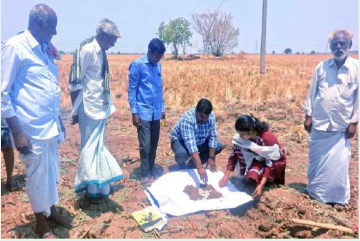
బండి ఆత్మకూరు పల్లె వెలుగు మే 21 :

రాబోవు ఖరీఫ్ సీజన్లో రైతులు భూసార పరీక్షలు చేయించుకుని వాటి ఫలితాల ఆధారంగా ఎరువులు వినియోగించుకోవాలని బండి ఆత్మకూరు మండల వ్యవసాయ అధికారి పవన్ కుమార్ తెలిపారు. బి కోడూరు గ్రామంలో గురువారం రైతు పొలాల్లో మట్టి నమూనాలు సేకరించి భూసార పరీక్షలు యొక్క ఆవశ్యకత గురించి ఏవో రైతులకు అవగాహన కల్పించారు. వేసవికాలంలో ప్రతి రైతు భూసార పరీక్షలు చేయించుకోవడమే కీలకమని, తద్వారా సిఫార్సైన ఎరువులను వాడాలని మట్టి నమూనా సేకరణ ప్రక్రియ గురించి రైతులకు వివరించారు. ప్రతి ఎకరాకు 8 చోట్ల మట్టిని మూణాలను పరి పంటకు 15 సెంటీమీటర్ లోతు వరకు మిరప లాంటి వాణిజ్య పట్టాలకు అయితే 30 సెంటీమీటర్ లోతు వరకు మట్టిని సేకరించాలని అన్నారు. పండ్ల తోటలు వంటి వాణిజ్య రెండు మీటర్ లోతు వరకు మట్టి నమూనా సేకరించి పరీక్షా కేంద్రాలకు పంపాలన్నారు. చౌడు నేలలను గుర్తించడం జిప్సం తో చౌడును తగ్గించే విధానం గురించి తెలిపారు. ఏ కోడూరు రైతు సేవ కేంద్రం నందు రైతులకు 50 శాతం రాయితీతో జీరుగ విత్తనాలను వ్యవసాయ అధికారి పవన్ కుమార్ రైతులకు పంపిణీ చేశారు. పచ్చి రొట్టె ఎరువుల వల్ల భూమికి కలిగే ప్రయోజనాల గురించి వివరించారు. పంటలను సాగు చేసే ముందు జనుము జీలుగా పిండి పెసర సాగు చేసి తిరిగి కన్య దున్నడం వల్ల భూమిలో భూసారం పెరుగుతుందని అన్నారు. రైతులు వ్యవసాయ సిబ్బంది చెప్పే సూచనలను పాటించి సద్వినియోగం చేసుకోవాలని అన్నారు. ఈ కార్యక్రమంలో వ్యవసాయ విస్తరణ సిబ్బంది సుహాసినీ, శ్రీనివాసరెడ్డి గ్రామ రెవెన్యూ అధికారి తిరుపతయ్య రైతులు పాల్గొన్నారు.