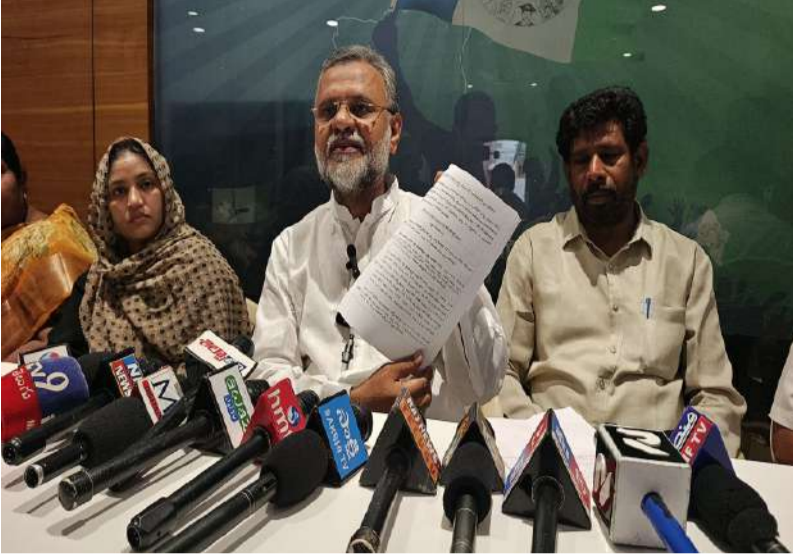
పల్లె వెలుగు నంద్యాల జిల్లా బ్యూరో.