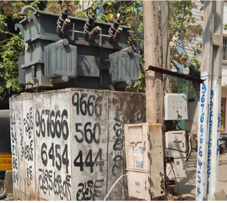
పల్లె వెలుగు నంద్యాల జిల్లా బ్యూరో.

నంద్యాల పట్టణంలోని స్థానిక బడర్ మసీదు ట్రాన్స్మార్లం వద్ద ఉన్న ఎల్ వి మీటర్ బాక్స్ ను విద్యుత్ శాఖ సిబ్బంది పెరికేసి, మట్టిలో పారేసి, వెళ్లిపోయారు. విద్యుత్ శాఖ సిబ్బంది ప్రభుత్వ సొమ్ము మట్టిపాలు చేయడంతో వార్తా ప్రజలు చూసి ముక్కున వేలు వేసుకుంటున్నారు. ట్రాన్స్మార్లం వద్ద ఎల్ వి మీటర్ బాక్సులు విద్యుత్ శాఖ సిబ్బంది కార్యాలయంలో జమ చేయాలి కానీ దీనికి భిన్నముగా విద్యుత్ శాఖ సిబ్బంది తీసిన ఎల్.వి బాక్సులను ట్రాన్స్మార్లం వద్దనే పడేసి పోతున్నారని ప్రజలు వాపోతున్నారు. విద్యుత్ శాఖ సిబ్బంది పట్టణంలో ఎక్కడ చూసినా ఇదే నిర్లక్ష్యంతో వ్యవహరిస్తున్నారని పలువురు వాపోతున్నారు. పర్యవేక్షించవలసిన అధికారులు పర్యవేక్షణ లోపంతోనే విద్యుత్ శాఖ సిబ్బంది ఇష్టానుసారముగా వ్యవహరిస్తున్నారని పలువురు విమర్శించుకుంటున్నారు.