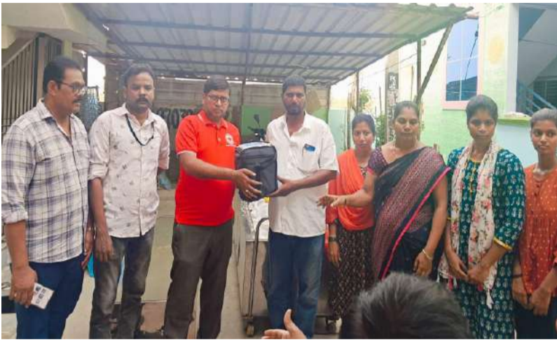
రెడ్ క్రాస్ అధ్యక్షులలో 25వ నేత్ర దాన సేకరణ.