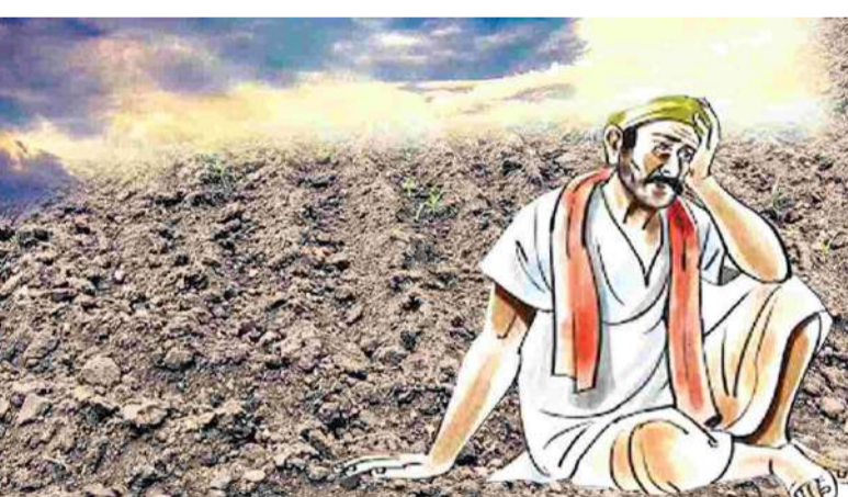
హోళగుండ్ పల్లె వెలుగు మే 21

మండల వ్యాప్తంగా వర్షాలు కురవకపోవడంతో రైతులు తీవ్ర ఆందోళనకు గురవుతున్నారు. ఇప్పటికే దుక్కలు దున్ని, విత్తనాలు సిద్ధం చేసుకున్న రైతులు వాన కోసం ఎదురుచూస్తున్నారు. అయితే ఎండలు అధికంగా ఉండటంతో పొలాల్లో తేమ పూర్తిగా తగ్గిపోయింది. వర్షాభావ పరిస్థితుల కారణంగా సాగు పనులు ముందుకు సాగడం లేదు. కొన్ని ప్రాంతాల్లో వేసిన విత్తనాలు మొలకెత్తకపోవడంతో రైతులు నష్టపోతున్నారు. బోర్లలో నీటి మట్టం పడిపోవడంతో పంటలకు నీరు అందించడం కూడా కష్టంగా మారింది. పత్తి తదితర పంటల