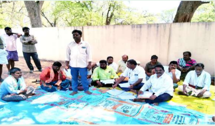
బండి ఆత్మకూరు పల్లె వెలుగు మే 21 :