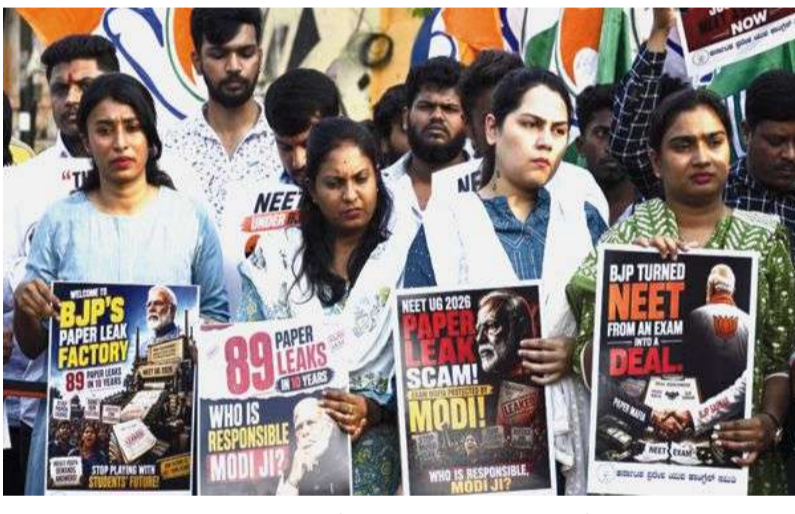
మధ్యతరగతి కుటుంబాలు అప్పుల్లో కారుకుపోతున్నాయి. పేద విద్యార్థులు మొదటినుంచే పోటీ నుంచి బయటపడుతున్నారు. ఇదే విద్యలో కార్పొరేటీకరణ అనలు రూపం. ప్రభుత్వ విద్యను బలహీన పరచి, ప్రయోజనం కోచింగ్ సంస్థలు, కార్పొరేట్ కాలేజీలకు లాభాలు చేకూర్చే విధంగా మొత్తం వ్యవస్థ పనిచేస్తోంది. నీట్ వ్యవస్థ వల్ల విద్యార్థుల మానసిక ఆరోగ్యం తీవ్రంగా దెబ్బతింటోంది. ప్రతి సంవత్సరం కోచింగ్ ఒత్తిడి, పరీక్ష భయం, కుటుంబాల అంచనాలు తట్టుకోలేక విద్యార్థులు ఆత్మహత్యలకు పాల్పడుతున్నారు. కోటా వంటి నగరాల్లో వరుస ఆత్మహత్యలు దేశాన్ని కుదిపేశాయి. అయినా ప్రభుత్వం సమస్య మూలాలను అర్థం చేసుకోవడం లేదు. విద్యార్థులపై మరింత పోటీ, మరింత ఒత్తిడి మోపుతోంది. వైద్య విద్యను సేవగా కాకుండా కేవలం మార్కెట్ పోటీగా మార్చింది. ఇది మానవీయత కోల్పోయిన విద్యా విధానం. నేషనల్ టెస్టింగ్ ఏజెన్సీ పనితీరు కూడా పూర్తిగా ప్రశ్నార్థకమైంది. వరుసగా పేపర్ లీకులు, ఫలితాల్లో అవకతవకలు, గ్రేస్ మార్కుల వివాదాలు, సాంకేతిక తప్పిదాలు ఇవన్నీ సంస్థ సామర్థ్యంపై తీవ్రమైన అనుమానాలు కలిగిస్తున్నాయి. లక్షల మంది విద్యార్థుల భవిష్యత్తు ఆధారపడే పరీక్షను నిర్వహించే సంస్థ కనీసం పారదర్శకతను కూడా పాటించలేకపోతోంది. పేపర్ లీక్ల వెనుక పెద్ద మాఫియాలు, రాజకీయ-కార్పొరేట్ సంబంధాలు ఉన్నాయనే ఆరోపణలు వస్తున్నాయి. పరీక్ష కేంద్రాల నుంచి కోచింగ్ సంస్థల వరకు విస్తరించిన అవినీతి గొలుసు విద్యా వ్యవస్థను పూర్తిగా కలుషితం చేస్తోంది.ఇది కేవలం పరిపాలనా వైఫల్యం కాదు. ఇది కేంద్ర ప్రభుత్వం అనుసరిస్తున్న నూతన విద్యా విధానాల సహజ ఫలితం. జాతీయ విద్యా విధానం2020 కూడా విద్యలో కేంద్రీకరణను, ప్రైవేటీకరణను మరింత వేగవంతం చేస్తోంది. రాష్ట్రాల హక్కులను క్రమంగా హరించి, మొత్తం విద్యా వ్యవస్థను కేంద్ర నియంత్రణలోకి తీసుకురావాలని ప్రయత్నిస్తోంది. "జాతీయ ప్రమాణాలు" అనే పేరుతో స్థానిక అవసరాలు, భాషలు, సామాజిక న్యాయం అన్నీ పక్కనపడు తున్నాయి. విద్యను ప్రజల హక్కుగా కాకుండా మార్కెట్ అవసరాలకు అనుగుణంగా మార్చే ప్రయత్నం జరుగుతోంది.