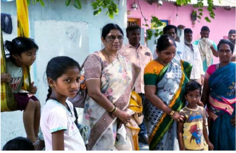
బండి ఆళ్లకూరు పల్లె వెలుగు మే 20 :

మీ పిల్లలు ప్రభుత్వ పాఠశాలల్లో చేరేందుకు ఎలాంటి అడ్మిషన్ ఫీజులు ఉండవు. పిల్లలను ఉచితంగానే చేర్చుకుంటాం. యూనిఫామ్ కు ప్రైవేట్ పాఠశాలల మాదిరిగా ఎలాంటి డబ్బు చెల్లించాల్సిన అవసరం లేదు. యూనిఫాం కూడా ఉచితంగానే ఇస్తాం! పుస్తకాలకు ఎలాంటి నగదు చెల్లించాల్సిన అవసరం లేదు. పుస్తకాలు కూడా ఉచితంగానే ఇస్తాం! పాఠశాలల్లో పిల్లలకు మధ్యాహ్న భోజనం పథకం కింద రుచికరమైన పోషకాలతో కూడిన భోజనాన్ని అందిస్తాం. ఇందుకు కూడా ఎలాంటి డబ్బు మాకు చెల్లించాల్సిన అవసరం లేదు. దయచేసి మీ పిల్లలను ప్రభుత్వ పాఠశాలల్లోనే చేర్పించండి! అంటూ అధికారులు గ్రామాలలో పర్యటించి పిల్లల తల్లిదండ్రులకు అవగాహన కల్పించే కార్యక్రమాన్ని చేపడుతూ ఉన్నారు. బడి పిలుస్తాంది కార్యక్రమంలో భాగంగా బుధవారం