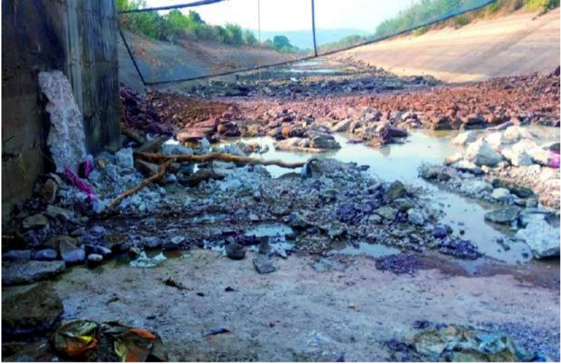
బండి ఆళ్లకూరు పల్లె వెలుగు మే 20 :