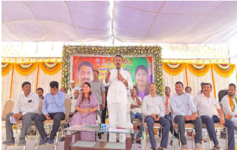
రూ.10 కోట్లతో సున్నిపెంటలో రోడ్లు, తాగునీటి అభివృద్ధి పనులు వేగవంతం.