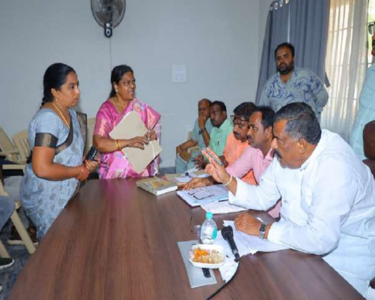
అధికారులతో నిర్వహించిన సుదీర్ఘ సమీక్షలో కీలక ఆదేశాలు పనుల్లో నిర్లక్ష్యం వహిస్తే కఠిన చర్యలు సమన్వయంతో ప్రజా సమస్యలను పరిష్కరించాలి