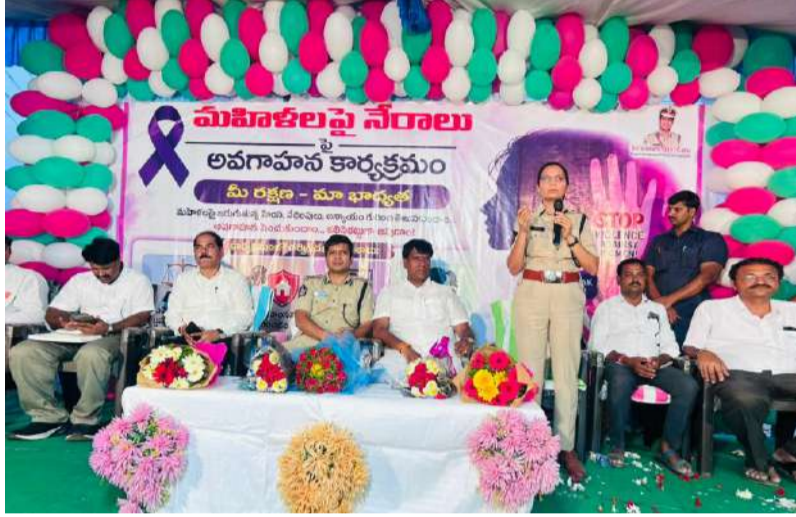
మీ రక్షణ - మా బాధ్యత