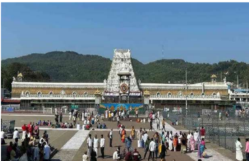
కోటాను, మధ్యాహ్నం 3 గంటలకు వయోవృద్ధులు, దివ్యాంగులు, దీర్ఘకాలిక వ్యాధులున్నవారు తిరుమల శ్రీవారిని దర్శించుకునేందుకు వీలుగా ఉచిత ప్రత్యేక దర్శనం టోకెన్ కోటాను విడుదల చేస్తామని వెల్లడించారు. 25న ఉదయం 10 గంటలకు ప్రత్యేక ప్రవేశ దర్శన టికెట్ల కోటాను, మధ్యాహ్నం 3 గంటలకు తిరుమల, తిరుపతిలో గదుల కోటాను విడుదల చేస్తామని వివరించారు. భక్తులు వెబ్సైట్ ద్వారా శ్రీవారి ఆర్థికసేవలు, దర్శన టికెట్లు బుక్ చేసుకోవాలని అధికారులు కోరారు.

తిరుమల వేంకటేశ్వర స్వామి వివిధ దర్శనాలు, గదులు ఆగస్టు నెలకు సంబంధించి కోటా వివరాలను టీటీడీ వెల్లడించింది. తిరుమల శ్రీవారి ఆర్థిక సేవా టికెట్లు ( సుప్రభాతం, తోమాల, అర్చన, అష్టదశ పాదపద్మారాధన సేవ) కు సంబంధించిన కోటాను మే 18న ఉదయం 10 గంటలకు ఆన్లైన్లో విడుదల చేయనున్నామని వివరించింది. ఈ సేవా టికెట్లు ఎలక్ట్రానిక్ డివ్ కోసం 20వ తేదీ ఉదయం 10 గంటల వరకు ఆన్లైన్లో నమోదు చేసుకోవచ్చని సంబంధిత అధికారులు తెలిపారు. ఈ టికెట్లు పొందిన వారు 20 నుంచి 22వ తేదీ మధ్యాహ్నం 12 గంటల లోపు సామ్మె చెల్లించిన వారికి టికెట్లు మంజూరవుతాయని వివరించారు. 21న కల్యాణోత్సవం, ఊంజల్ సేవ, ఆర్థిక బ్రహ్మోత్సవం, సహస్రదీపాలంకార సేవ, సాలకట్ల పవిత్రోత్సవాల టికెట్లను ఉదయం 10 గంటలకు ఆన్ లైన్ లో విడుదల చేయనున్నట్లు ప్రకటించారు. అదే విధంగా వార్షిక పవిత్రోత్సవాల 23 నుంచి 25వ తేదీ వరకు టికెట్లను విడుదల చేసామన్నారు. వర్షువల్ సేవలు, వాటి దర్శన స్లాట్లకు సంబంధించిన కోటాను 21న మధ్యాహ్నం 3 గంటలకు , 23న ఉదయం 10 గంటలకు అంగ ప్రదక్షిణ టోకెన్లు , ఉదయం 11 గంటలకు శ్రీవాణి ట్రస్టు దర్శన టికెట్లు