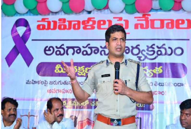
ఎమ్మిగనూరు వెంకటాపురం కాలనీలో "మీ రక్షణ - మా బాధ్యత" అవగాహన కార్యక్రమం. -మహిళల రక్షణ కోసం "శక్తి యావ్" వినియోగించుకోవాలి. చట్టాలపై అవగాహన పెరిగితేనే నేరాలు తగ్గుతాయి.