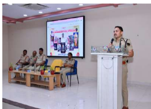
పాణ్యం మే 20 పల్లె వెలుగు :