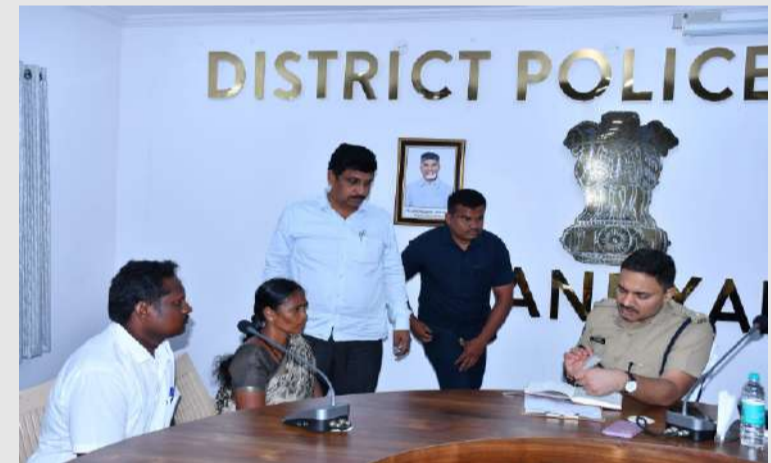
పల్లె వెలుగు నంద్యాల క్రైమ్.