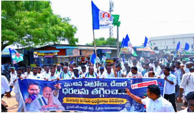
మాజీ ఎమ్మెల్యే చక్రపాణి రెడ్డి