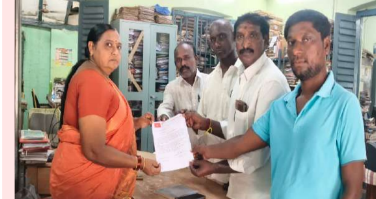
పల్లె వెలుగు నంద్యాల రూరల్.