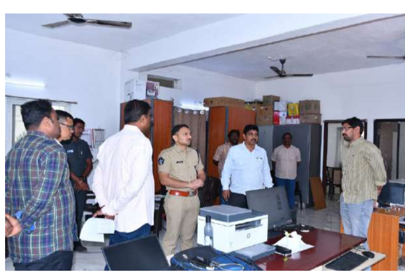
వివిధ విభాగాల పనితీరు, లెక్కలను క్షుణ్ణంగా పరిశీలన.