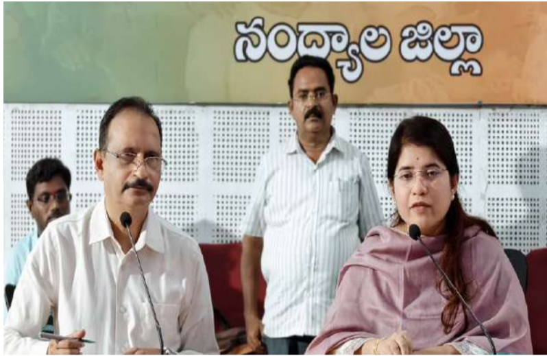
ప్రజా సమస్యల పరిష్కారానికి "జన సునవాయి" కార్యక్రమాలు. గ్రామాల అభివృద్ధిలో ప్రజల భాగస్వామ్యం తప్పనిసరి : కలెక్టర్ రాజకుమారి.