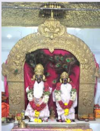
ఆదోని. మే 18 (పల్లె వెలుగు) :