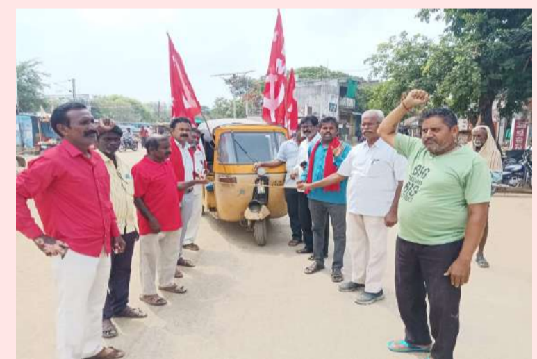
ఆటోకు తాళ్లు కట్టి లాగుతూ నిరసన వ్యక్తం చేసిన సిపిఎం నాయకులు