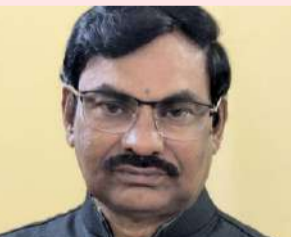
పల్లె వెలుగు :

మనిషి మనసులో చలన పుట్ట ఒక ఆలోచన తర్వాత మరొక ఆలోచన పుట్టుకొస్తుంది. ఆలోచనలు పరస్పరం పోటీ పడుతాయి. ఆలోచనలు ప్రత్యామ్నాయాలు మనన ప్రపంచం ఒక అంతు చిక్కని అద్భుతం క్షణాల్లో ఆకాశ మంత ఎత్తుకు ఎగురుతుంది అగాధమంత లోతుకు జారిపోతుంది కంటికి కనిపించదు ఆలోచనల అలలతో నిరంతరం సాగే యుద్ధం రేకులు లేకపోయిన విశ్వమంతా ఎగురుతుంది. సంకెళ్లు వేసిన ఊహలలోకంలో విహరిస్తోంది. ఒక్కో సారి ప్రకాశమైన సరోవరం మరోసారి ఉప్పెన లాగ విరుచుకు పడుతుంది నిజాలను దాచి అబద్ధాల ముసుగు వేస్తుంది. మనిషిలో కోపాన్ని పెంచేది మననే మనిషిలో ప్రేమను పగను ప్రతీకారాన్ని కక్ష కారితో కలహల కల్లోలాలను సృష్టించేది మననే మమకారపు అంధాలను పెన వేసేది మననే అంధాలను అనుబంధాలను తెంపేది మననే యుద్ధాలను సృష్టించేది. యుద్ధాలను ఆపే తంత్రం మననే విద్యుంసాన్ని సృష్టించేది అభివృద్ధికి దిక్పావి మననే. అహంకారపు గోడలు నిర్మించేది మననే కుల మతాల మధ్య సమరసతకు వారధి మననే మనసును గెలిస్తే కాస్తే గెలుస్తాం. మనోనిగ్రహం మానవ మనుగడకు గొప్ప ఆయుధం నిర్మలమైన మనసునీతి నిజాయితీలకు నెలవు ప్రశాంతమైన మనసు మానవాభివృద్ధికి మదుపు మనోల్లాసం మానవ తేజస్సుకు మణిహారం మనసున్న మనసులుగా ఎదుగుదాం. మానవతా పరిమళాలను లోకమంతా చాటుదాం. నేడు సూరి కనకయ్య అధ్యక్షులు తెలంగాణ ఎకనామిక్ ఫోరం.