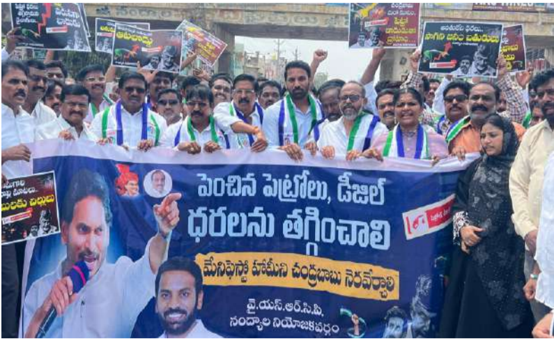
పల్లె వెలుగు నంద్యాల జిల్లా బ్యూరో.