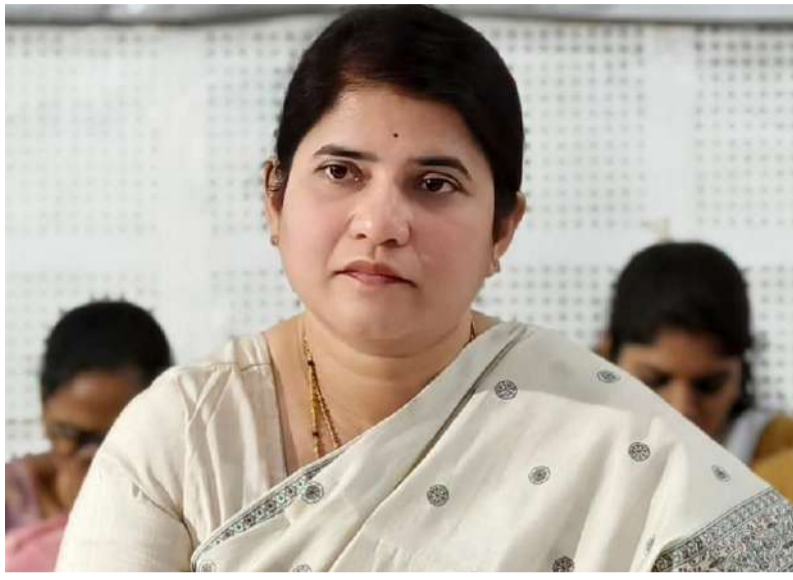
కేంద్రంలో ఉదయం 9:30 గంటలకు ప్రారంభమయ్యే ఈ కార్యక్రమానికి సంబంధిత శాఖల అధికారులందరూ తప్పనిసరిగా హాజరుకావాలని కలెక్టర్ ఆ ప్రకటనలో పేర్కొన్నారు.

జిల్లా వ్యాప్తంగా ప్రజల సమస్యలను వేగవంతంగా పరిష్కరించేందుకు ఈ నెల 18వ తేదీ (సోమవారం)న ప్రజా సమస్యల పరిష్కార వేదిక నిర్వహించనున్నట్లు జిల్లా కలెక్టర్ జి. రాజకుమారి ఆదివారం ఒక ప్రకటనలో తెలిపారు. ఈ కార్యక్రమం నంద్యాల జిల్లా కలెక్టరేట్‌లో పాటు అన్ని డివిజన్, మండల కేంద్రాలు మరియు మున్సిపల్ కార్యాలయాల్లో ఒకేసారి నిర్వహించబడుతుందన్నారు. వేసవి ఉష్ణోగ్రతలను దృష్టిలో ఉంచుకుని కార్యక్రమాన్ని ఉదయం 9:30 గంటల నుంచి మధ్యాహ్నం 1:00 గంటల వరకు నిర్వహిస్తున్నట్లు కలెక్టర్ తెలిపారు. ప్రజలు తమ అర్జీలను ప్రత్యక్షంగా సమర్పించడమే కాకుండా, వెబ్‌సైట్ ద్వారా ఆన్‌లైన్‌లో కూడా సమాధులు చేసుకునే సౌకర్యం కల్పించబడిందన్నారు. అర్జీల పరిష్కార స్థితిని అదే వెబ్‌సైట్‌లో లేదా టోల్ ఫ్రీ నెంబర్ 1100 ద్వారా తెలుసుకోవచ్చని కలెక్టర్ తెలిపారు. అర్జీదారులు ముందుగా తమకు సంబంధించిన మండల, డివిజన్ లేదా మున్సిపల్ కార్యాలయాల్లో అధికారులకు వివరాలను సమర్పించాలని, అక్కడ పరిష్కారం కాని సమస్యలనే జిల్లా స్థాయి వేదికకు తీసుకురావాలని సూచించారు. జిల్లా