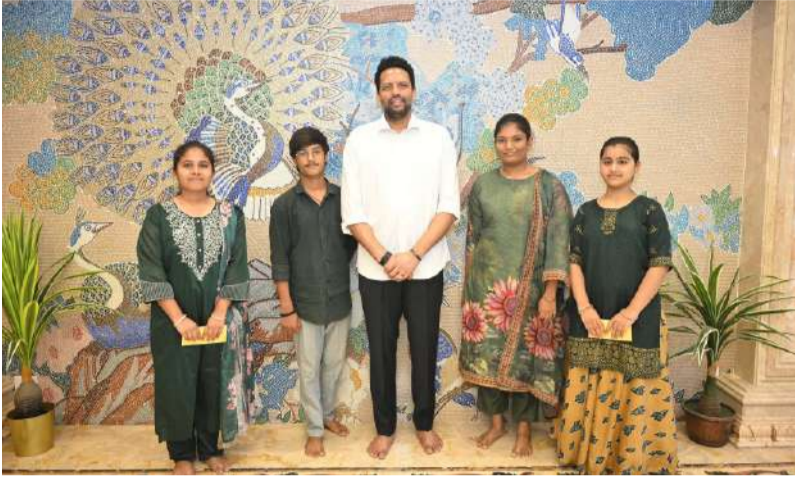
టెన్ టాపర్లకు ఇంట్లో విందు ఇచ్చిన మంత్రి

ప్రతిభావంతులకు నగదు ప్రోత్సాహకాలు అందజేత