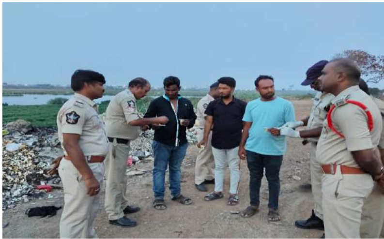
అనుమానిత యువకులపై గంజాయి సేవించిన వారిని గుర్తించేందుకు

ప్రత్యేక డ్రగ్ పరీక్షల నిర్వహించిన కర్నూలు టూ టౌన్ పోలీసులు.