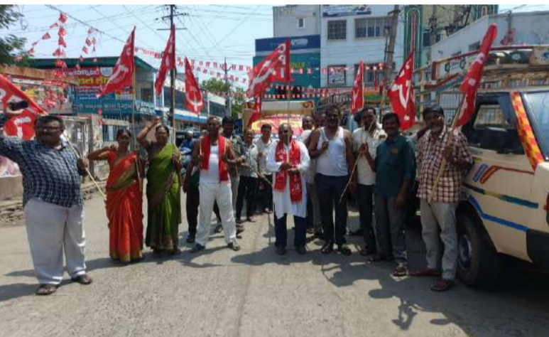
-ట్రాలీ ఆటోను తాడుతో కట్టి లద్ద నగ్నంగా లాగి నిరసన