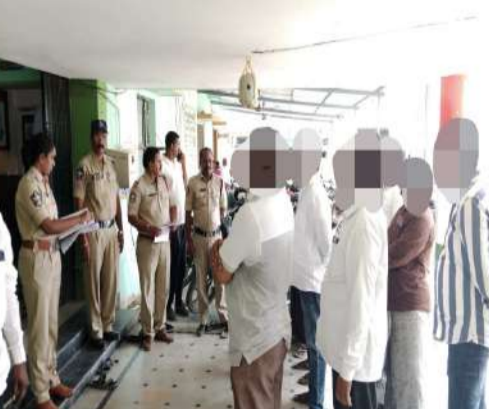
నేర ప్రవృత్తికి స్వస్తి పలికి సమాజంలో మంచి పారులుగా మెలగాలి.

-చట్ట వ్యతిరేక కార్యకలాపాలలో పాల్గొంటే కలిసే చర్యలు తప్పవు.