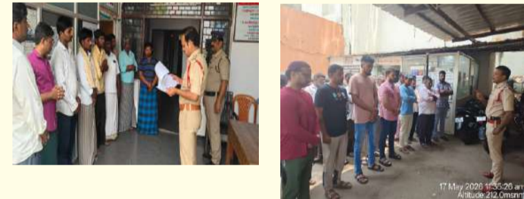
పల్లె వెలుగు కర్నూలు క్రైమ్.

కర్నూలు ఎస్పీ విక్రాంత్ పాటిల్ ఆదేశాల మేరకు జిల్లాలో నేరని యంత్రణ శాంతిభద్రతల పరిరక్షణలో భాగంగా పోలీసు అధికారులు అన్ని పోలీసు స్టేషన్ల పరిధిలో రాడీ షీటర్లకు నేర చరిత్ర గలవారికి చెదనడత కలిగిన వ్యక్తులకు కాన్సిలింగ్ నిర్వహించారు. సత్ర ప్రవృత్తి జీవించాలని నేరప్రవృత్తికి స్వస్తి పలకాలని, చట్టవ్యతిరేక కార్యకలాపాలకు దూరంగా ఉండాలని నూచించారు. చట్టవ్యతిరేక కార్యకలాపాలలో పాల్గొంటే తప్పనిసరిగా చట్ట ప్రకారం కఠిన చర్యలు తీసుకోవడం జరుగుతుందని పోలీసు అధికారులు హెచ్చరించారు.