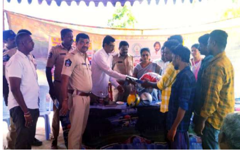
బండి ఆత్మకూరు పల్లె వెలుగు -మే 15 :