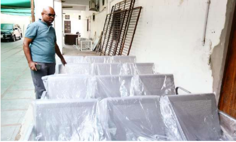
మున్సిపల్ సిబ్బందికి కమిషనర్ చల్లా ఓబులేసు హెచ్చరిక