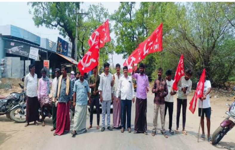
సిపిఎంఆధ్వర్యంలో పాండవగల్లులో నిరసన కార్యక్రమం.