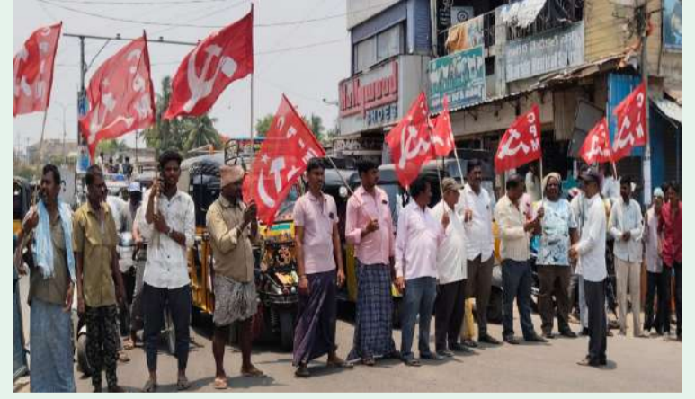
ఆదోని ( పల్లె వెలుగు ) :