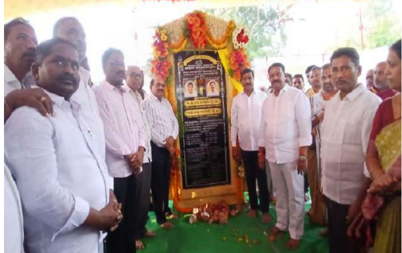
రూ.7.90 కోట్లతో నిర్మించిన బీబీ రోడ్డును ప్రారంభించిన మంత్రి, ఎమ్మెల్యే.