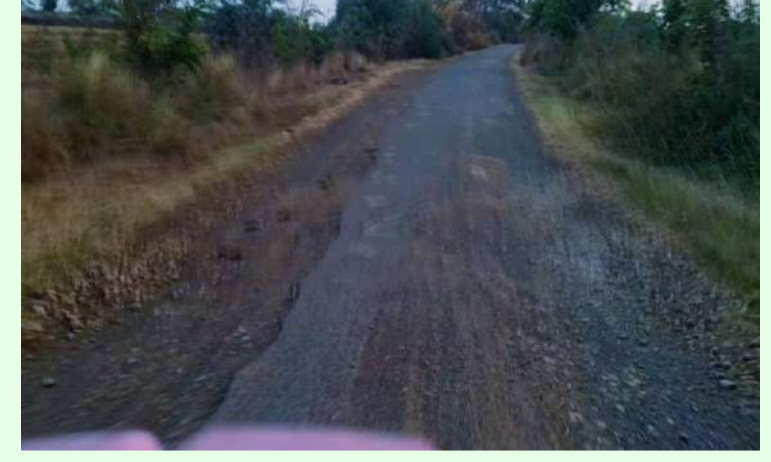
బండి ఆత్మకూరు పల్లె వెలుగు మే 15 :