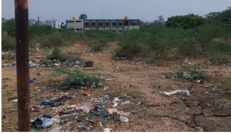
బండిఆత్మకూరు పల్లె వెలుగు మే 14: