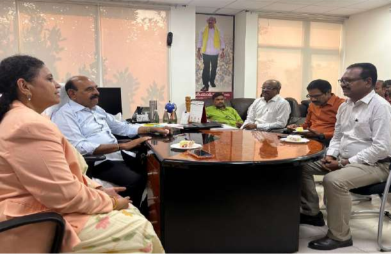
ప్రజల చెంతకు న్యాయ సేవలు

జీపీ, ఏజీపీ ల ఖాళీల భర్తీ న్యాయ శాఖ సమీక్షలో మంత్రి ఎన్ఎండి ఫరూక్ న్యాయ శాఖ అధికారులకు మంత్రి ఆదేశం