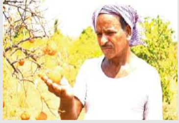
మే 14. పల్లె వెలుగు :

రాష్ట్ర ముఖ్యమంత్రి చంద్రబాబు గారు రాయలసీమను ప్రూట్ బాస్కెట్ గా అభివృద్ధి చేస్తానన్నారు. అనంతపురం జిల్లాలో ఉద్యాన పంటల రైతులను ఆదుకునేందుకు ఉద్యాన పంటల ఉత్పత్తులు కొనుగోలు చేసేందుకు కార్పొరేట్ కంపెనీలతో ప్రభుత్వం తరపున 2025లో అనంతపురంలో కాన్క్లెవ్ నిర్వహించారు. ఉద్యాన పంటలను అభివృద్ధి చేయండి, మిమ్ములను మేము ఆదుకుంటామని ముఖ్యమంత్రి రాయలసీమ రైతులకు హామీ ఇచ్చారు. కానీ నేడు అనంతపురం జిల్లాలో ఉష్ణోగ్రతలు 42 డిగ్రీల నుండి 44 డిగ్రీలకు పెరిగాయి. భూగర్భ జలాలు అడుగంటాయి. హంద్రీనీవా ద్వారా అనంతపురం జిల్లా చెరువులకు 74 టిఎంసీల నీటిని తరలించామని ఇరిగేషన్ అధికారులు ఘనంగా ప్రకటించారు. మరి ఎందుకని చెరువులు ఎండిపోతున్నాయి. అధికారులు చెప్పే మాటలకు, వాస్తవ పరిస్థితులకు ఎక్కడా పొంతన కుదరటం లేదు. భూగర్భ జలాలు ఎందుకని అడుగంటుతున్నాయో సమాధానం చెప్పే పరిస్థితిలో ప్రభుత్వ అధికారులు లేరు. ప్రూట్ బాస్కెట్ గా అభివృద్ధి చేస్తానన్న ముఖ్యమంత్రి మాటలు ఎండమావిని తలపిస్తున్నాయి. గత ప్రభుత్వ కాలంలో 2018-19 సంవత్సరాలలో ఇలాంటి పరిస్థితి ఏర్పడినప్పుడు ప్రభుత్వం స్పందించి ట్యాంకర్ల ద్వారా నీళ్లను తోలేందుకు ఖర్చును భరించి రైతులకు అండగా నిలబడింది. గత ప్రభుత్వం లాగా నీళ్ల ట్యాంకర్లకు ఖర్చును ఈ ప్రభుత్వం ఎందుకు భరించదని రైతులు ప్రశ్నిస్తున్నారు.