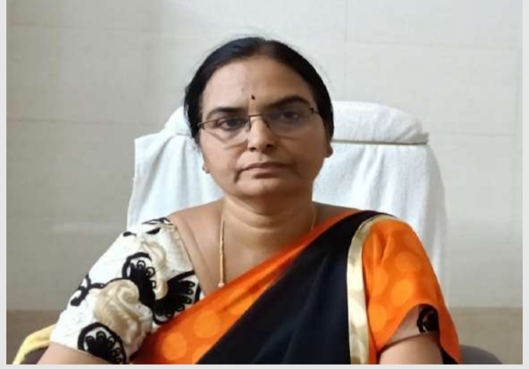
రుద్రవరం. పల్లె వెలుగు :

రాష్ట్ర ముఖ్యమంత్రి ఆదేశాల మేరకు సంద్యాల జిల్లా కలెక్టర్ ఉత్తర్వుల ప్రకారం ఆళ్లగడ్డ నియోజకవర్గ స్థాయిలో 'ప్రజా సమస్యల పరిష్కార వేదిక' కార్యక్రమాన్ని నిర్వహిస్తున్నట్లు రుద్రవరం ఎంపీడివో భాగ్యలక్ష్మి తెలిపారు. ఈ కార్యక్రమం ఆళ్లగడ్డ పట్టణంలోని కడప రోడ్డులో ఉన్న మహాలక్ష్మి ఫంక్షన్ హాల్లో మే నెల 15, 22, 30 తేదీలతో పాటు జూన్ 5వ తేదీన ఉదయం 9:00 గంటల నుండి మధ్యాహ్నం 1:00 గంట వరకు జరుగుతుందని తెలిపారు. ఆళ్లగడ్డ శాసనసభ్యురాలు భూమా అఖిలప్రియ మరియు జిల్లా కలెక్టర్ అధ్యక్షతలో నిర్వహించే ఈ వేదిక ద్వారా ప్రజల సమస్యలను నేరుగా స్వీకరించి పరిష్కరించడం జరుగుతుందని పేర్కొన్నారు. కావున, మండలంలోని ప్రజలు తమ వ్యక్తిగత లేదా సామాజిక సమస్యలపై అర్జీలు మరియు సంబంధిత పత్రాలతో హాజరై ఈ అరుదైన అవకాశాన్ని సద్వినియోగం చేసుకోవాలని ఆమె కోరారు.