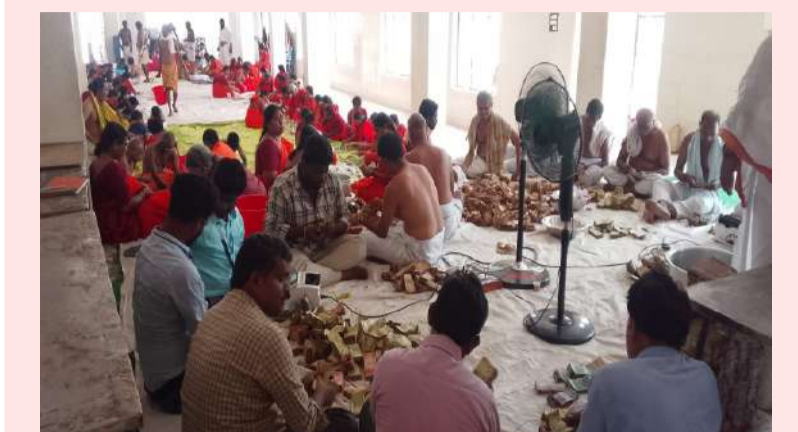
బేతంచెర్ల పల్లె వెలుగు ప్రతినిధి (మే 14):-