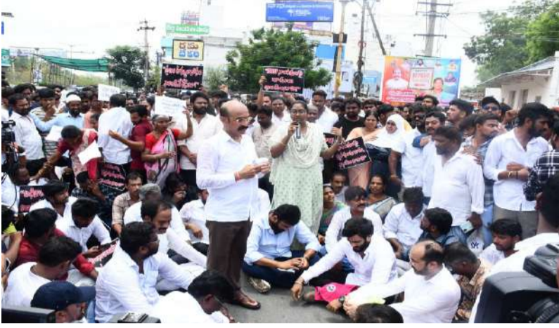
కర్నూలులో వైఎస్సార్ సీపీ భారీ ధర్నా: అక్రమ అరెస్టులపై గర్జించిన నేతలు