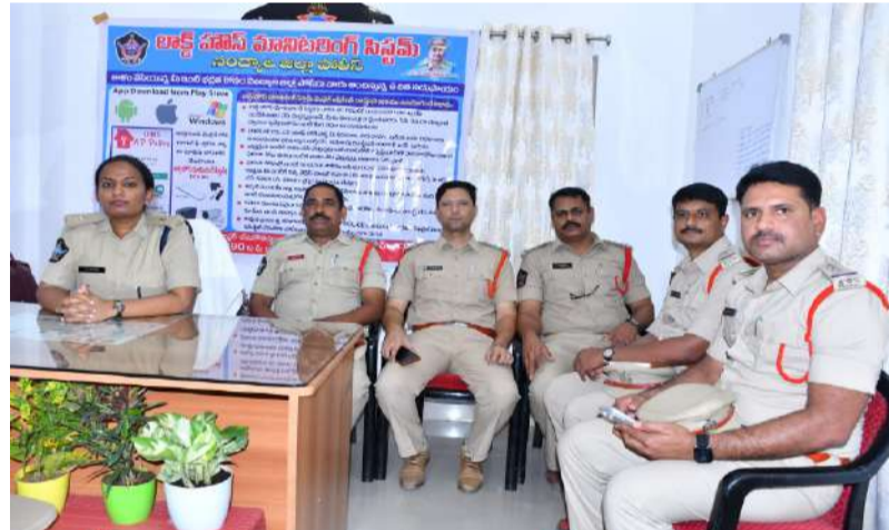
ఎల్ హెచ్ ఎం ఎస్ యావ్ తో మీ ఇంటికి రక్షణ.