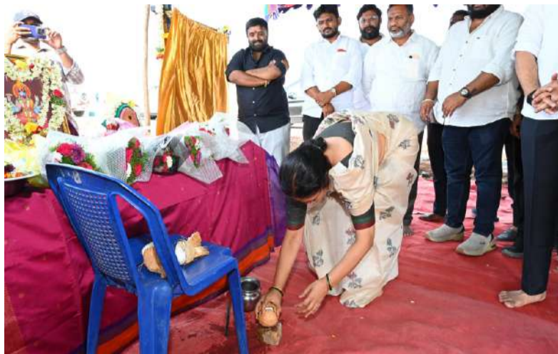
రూ. 10 కోట్లతో శ్రీ మాతే ఫుడ్స్ గ్రీన్ ఫుడ్ ప్రాసెసింగ్ యూనిట్ శంకుస్థాపన స్థానిక యువతకు ఉపాధి, రైతులకు మేలు చేకూర్చేలా పరిశ్రమల ఏర్పాటు రాష్ట్రానికి రూ. 23 లక్షల కోట్ల పెట్టుబడులు: ఎమ్మెల్యే గౌరు చరితారెడ్డి