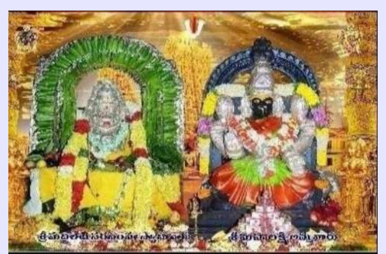
పల్లెవెలుగు బేతంచెర్ల (మే 13) :-