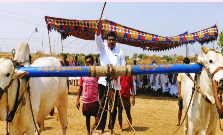
పల్లె వెలుగు బండి ఆత్మకూర్.

వెంగళరెడ్డి పేట గ్రామంలో సందడిగా ఎద్దుల పోటీలో.