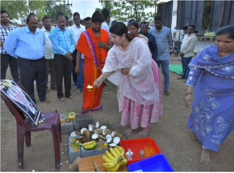
పల్లె వెలుగు నంద్యాల జిల్లా బ్యారో.