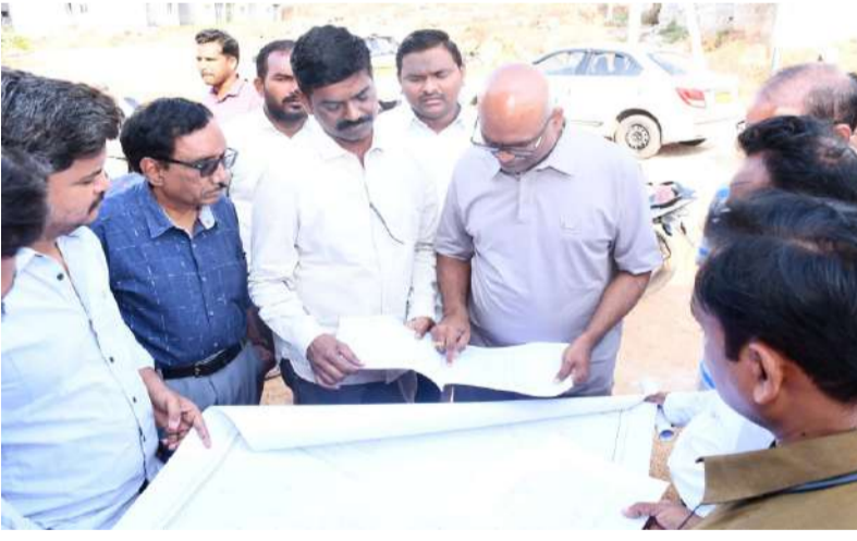
నెలాఖరుకు 500 గృహాల కేటాయింపు రెండు నెలల్లో ఇంటింటికి నీటి సరఫరా కర్నూలు నగరపాలక సంస్థ కమిషనర్ చల్లా ఓబలేసు

పల్లె వెలుగు కర్నూలు రిపోర్టర్ : కర్నూలు నగర శివార్లలో టీడో గృహాల్లో అన్ని వసతుల కల్పనకు చర్యలు తీసుకుంటున్నట్లు నగరపాలక సంస్థ కమిషనర్ చల్లా ఓబలేసు పేర్కొన్నారు. బుధవారం ఆయన టీడో, మున్సిపల్ అధికారులతో కలిసి టీడో గృహాలను పరిశీలించారు. అక్కడి వసతులు, సమస్యలను ప్రజలను అడిగి తెలుసుకుని, వాటి పరిష్కారానికి ఆదేశాలు జారీ చేశారు. టీడో గృహాల నిర్మాణ స్థితిగతులు, తాగునీటి సరఫరా పనులపై సంబంధిత అధికారులను అడిగి తెలుసుకున్నారు. ఈ సందర్భంగా కమిషనర్ మాట్లాడుతూ.. టీడో గృహాల్లో వారంలో 2 సార్లు నీటి సరఫరా చేయడం జరుగుతుందని, విద్యుత్ డీపాలకు మరమ్మత్తులు చేయిస్తామన్నారు. రేషన్ బియ్యం సరఫరా, సచివాలయం, బస్ సౌకర్యం, ప్రాథమిక పాఠశాల వంటి ఏర్పాటుకు చర్యలు తీసుకుంటామని పేర్కొన్నారు. ఈ నెలాఖరుకు 500 గృహాలు అందుబాటులోకి వస్తాయని, రెండు నెలల్లో