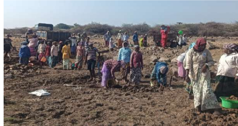
విజయగాధ - నంద్యాల జిల్లా. పూడికతీత పునర్వత్త పొందిన నొస్సం పెద్ద చెరువు. 500 ఎకరాల నుంచి 600 ఎకరాల సాగుకు నీటి భరోసా. చెరువు మట్టితో సారవంతమవుతున్న రైతు పొలాలు. “జలదార - జలహారతి”తో నొస్సం పెద్ద చెరువు రైతు భవిష్యత్తుకు కొత్త వెలుగు.