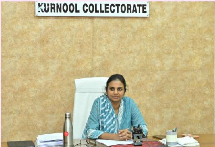
పల్లె వెలుగు కర్నూలు బ్యూరో