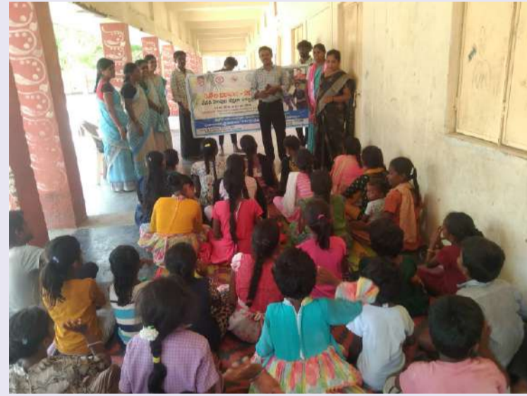
నందవరం పల్లె వెలుగు మే 12