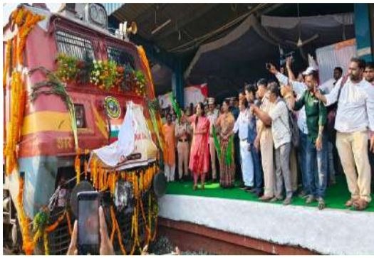
రైలు ప్రయాణికులకు ఆధునిక వసతి, తక్కువ చార్జీ, సురక్షిత ప్రయాణం లక్ష్యం. అట్టహాసంగా గుంతకల్లు - మార్కాపురం పగటిపూట ఫ్యాసింజర్ రైలును ప్రారంభించిన నంద్యాల ఎంపీ డాక్టర్ బైరెడ్డి శబరి.