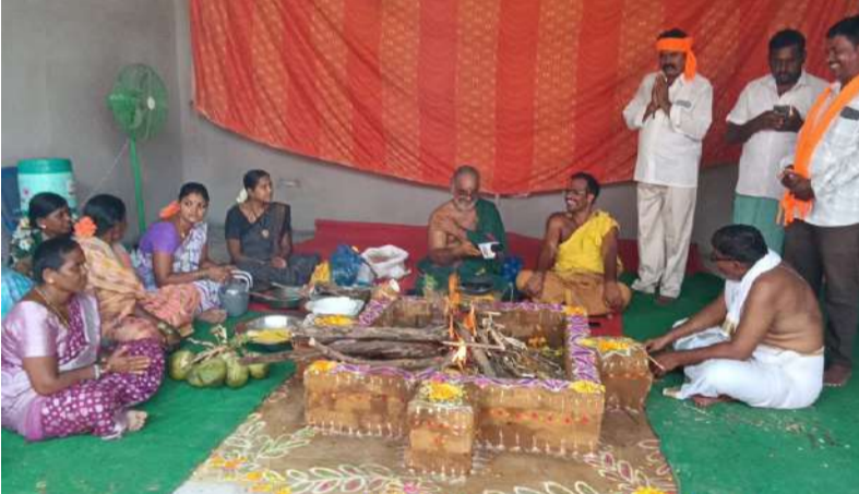
రుద్రవరం, పల్లె వెలుగు :

మండల కేంద్రం రుద్రవరం తో పాటు పలు గ్రామాలలో హనుమాన్ జయంతి సందర్భంగా పలు ఆలయాలలో ఘనంగా హనుమాన్ జయంతి వేడుకలు నిర్వహించారు. మండల కేంద్రంలోని అమ్మవారి శాల సమీపంలో గల శ్రీ కాశీ విశ్వేశ్వర ఆంజనేయ స్వామి దేవస్థానం పడమటి వీధిలో గల శ్రీ ప్రతాపరుద్ర ఆంజనేయ స్వామి దేవస్థానం, శ్రీ వాసాపురం వెంకటేశ్వర స్వామి దేవస్థానం , భూమా నాగిరెడ్డి పల్లెలోని అభయాంజనేయ స్వామి దేవాలయాలలో ఆంజనేయ స్వామి కి పంచామృతాలతో అభిషేకం నిర్వహించి, ఆకు పూజ నిర్వహించారు. ఈ సందర్భంగా అన్ని ఆలయాలు భక్తులతో కిటకిటలాడాయి. ఆలయాల కమిటీ వారు క్యూ లైన్ లో ఏర్పాటు చేసి భక్తులకు అన్నదాన కార్యక్రమాలు నిర్వహించారు. ప్రతాప రుద్ర ఆంజనేయ స్వామి వారి దేవస్థానం నుండి గ్రామంలో గల ప్రధాన రహదారుల గుండా కోలాటం సదుడు భక్తి శ్రద్ధలతో హనుమాన్ శోభాయాత్ర ఘనంగా నిర్వహించారు..