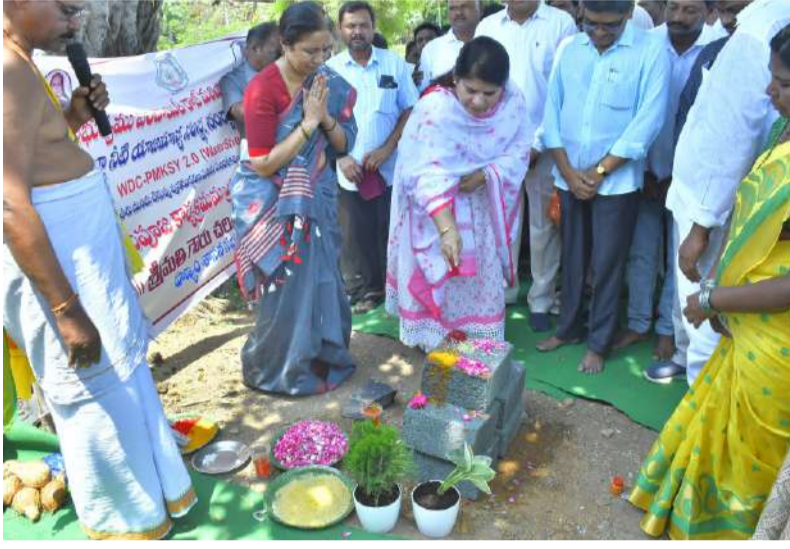
చెరువు కట్ట వద్ద వాకింగ్ ట్రాక్, పార్కు, ఓపెన్ జిమ్ పనులకు భూమిపూజ. జిల్లా కలెక్టర్ రాజకుమారి గణియా..