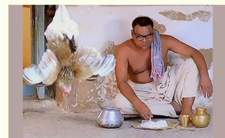
అమరావతి : మే 12 పల్లె వెలుగు