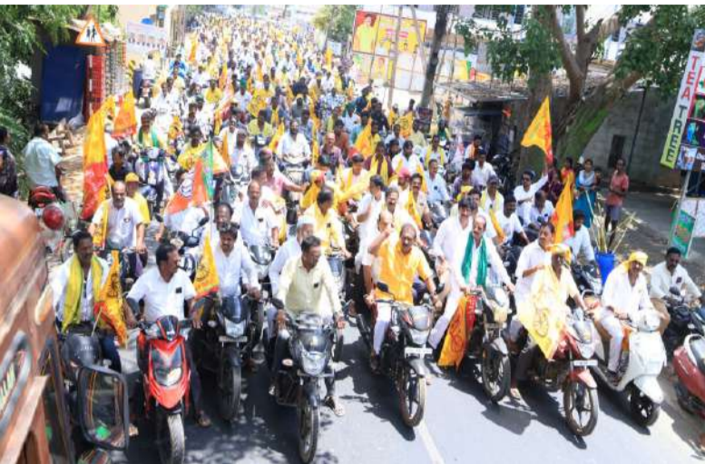
మంత్రి నిమ్మలకు ఫరూక్, షరీఫ్ ల ప్రశంసల జల్లులి రూ 4.52 కోట్లతో అభివృద్ధి పనులకు శంకుస్థాపనలు కూటమి శ్రేణుల భారీ మోటార్ సైకిల్ల ర్యాలీ