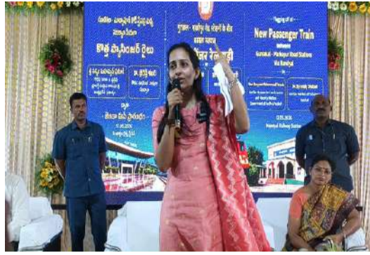
పగటిపూట ఒక్క రైలు లేదు, అన్ని రైళ్లు ఆర్థరాత్రి ఉన్నాయి ఎలాగైనా పగటి పూట ఫ్యాసింజర్ రైలు నడిచేలా చూడాలని వినతి పత్రాలు ఇచ్చారు, ప్రజల వినతిని తాను పార్లమెంట్ లో కేంద్ర రైల్వే శాఖ మంత్రి అశ్వనీచైప్లవ్ దృష్టికి తీసుకెళ్లగా ఒక్క క్షణం ఆలోచించ కూడా మీ విన్నపంను త్వరలో కార్యరూపం ధాలుస్తానని, వెంటనే రైల్వే అధికారులకు ఆదేశాలు ఇవ్వడం, దక్షిణ మధ్య రైల్వే శాఖ ఉన్నతాధికారులు కూడా వెంటనే స్పందించి నేడు నూతన రైలును ప్రారంభించుకుంటున్నామని, నంద్యాల జిల్లా ప్రజల తరువున కేంద్ర రైల్వే శాఖ మంత్రి అశ్వనీచైప్లవ్ కు, దక్షిణ మధ్య రైల్వే శాఖ ఉన్నతాధికారులకు ప్రత్యేకంగా ధన్యవాదములు తెలుపుతున్నామని ఎంపీ డాక్టర్ బైరెడ్డి శబరి అన్నారు. నంద్యాల మీదుగా అజ్మీర్, శబరి మల, కడప ఇన్ఫ్రాసౌకర్య ప్రత్యేక రైళ్లు వేయించామని, రైలు ప్రయాణికుల కోరిక మేరకు నంద్యాల మీదుగా మరి కొన్ని రెగ్యులర్ రైళ్లు నడిపేలా చూస్తామని, నంద్యాల, బనగానపల్లె, కోవెలకుంట్ల, బేతంచెర్ల, డోన్ రైల్వే స్టేషన్లలో ఇంకా అనేక సమస్యలు ఉన్నాయని వాటి పరిష్కారం కోసం కృషి చేస్తానన్నారు. ముఖ్యమంత్రి నారా చంద్రబాబు నాయుడు దృష్టికి నూనెపల్లి రోడ్డు అందర్ ట్రిడ్డి నిర్మాణం భూసేకరణ సమస్య వివరించగా తప్పకుండా చేద్దాం అన్నారుని ఎంపీ డాక్టర్ బైరెడ్డి శబరి తెలిపారు. కేంద్ర ప్రభుత్వం ద్వారా ఇప్పటికే రూ. 24 కోట్లతో నంద్యాల రైల్వే స్టేషన్ ఆధునికీకరణ పనులు జరుగుతున్నాయని, నంద్యాలకు రైల్వే గూడ్స్ స్టేషన్ కొత్తగా మంచారు అయిందని ఎంపీ డాక్టర్ బైరెడ్డి శబరి ప్రకటించారు. నంద్యాలకు ఫిట్ లైన్