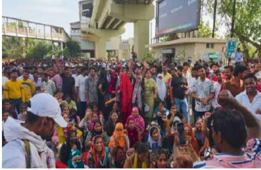
రాజకీయ పార్టీ అధికారంలో ఉండటం వల్ల నిర్ణయాలు వేగంగా తీసుకోగలమనే వాదన ఉంది. కానీ అదే పరిస్థితి కార్మికుల సమస్యల పరిష్కారంలో ఎందుకు కనిపించడంలేదు? ఇదే ప్రస్తుతం ప్రధాన ప్రశ్న. చర్చ. వాస్తవానికి “డబుల్ ఇంజన్” అనేది అభివృద్ధిని వేగవంతం చేసే యంత్రంగా కాకుండా, కార్పొరేట్ ప్రయోజనాలను వేగంగా అమలు చేసే విధానంగా మారిందనే విమర్శలు బలపడుతున్నాయి. మొదటిగా, కార్మికులకు వేతనాలు చెల్లించే విషయంలో ఈ డబుల్ ఇంజన్ సర్కార్లు పూర్తిగా విఫలమయ్యాయి. ద్రవ్యోల్బణం నిరంతరం పెరుగుతుండగా, కనీస వేతనాలను తగిన విధంగా సవరించటం లేదు. ఫలితంగా, నిజ వేతనాలు క్షీణిస్తున్నాయి. ఒకవైపు కంపెనీల లాభాలు

దేశంలో కార్మిక వర్గం నేడు ఎదుర్కొంటున్న సంక్షోభం సాధారణ ఆర్థిక సమస్య కాదు; అది పాలక వర్గాల విధానాల వైఫల్యాన్ని బహిష్కరణ చేస్తున్న సామాజిక-ఆర్థిక సంక్షోభం. వేతన స్తంభన, పని గంటల పెంపు, పెరుగుతున్న ద్రవ్యోల్బణం, ఒప్పంద కార్మిక వ్యవస్థ విస్తరణ, ఉద్యోగ భద్రత లేకపోవడంవంటి నాలుగు అంశాలు కలిసి కార్మికుల జీవితాలను అస్థిరత్వం లోకి నెట్టేసాయి. ఉత్తరప్రదేశ్ లోని నోయిడాలో ఇటీవల జరిగిన కార్మిక నిరసనలు వారి సమస్యలను వెలుగులోకి తెచ్చాయి. నోయిడా, ఫరీదాబాద్ వంటి పారిశ్రామిక కేంద్రాలు దేశ అభివృద్ధికి ప్రతీకలుగా చూపబడుతున్నాయి. “డబుల్ ఇంజన్ అభివృద్ధి” అనే రాజకీయ నినాదాన్ని ఈ ప్రాంతాల వేగవంతమైన పరిశ్రామీకీకరణను ఆధారంగా చేసుకుని ప్రచారం చేసుకుంటున్నారు. కానీ ఈ అభివృద్ధి సమూహా లోపలికి చూసినట్లయితే అది కార్మికులపై అసమానతల నిర్మాణం అని స్పష్టమవుతోంది. సంపద సృష్టి పెరుగుతున్నా. ఆ సంపదలో కార్మికుల వాటా (వారి కుటుంబాల జీవనానికి సరిపడా వేతనం) తగ్గిపోతోంది. కేంద్రంలో, రాష్ట్రంలో ఒకే