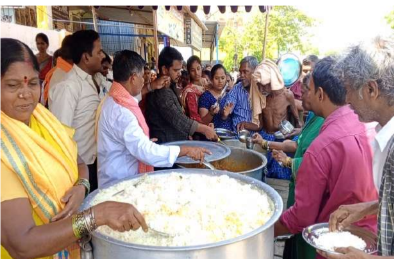
-అభయాంజనేయ స్వామి ఆలయంలో ఘనంగా అన్నదానం, ప్రత్యేక పూజలు -భక్తిశ్రద్ధలతో పాల్గొన్న భక్తులు.. దాతల సత్కారం