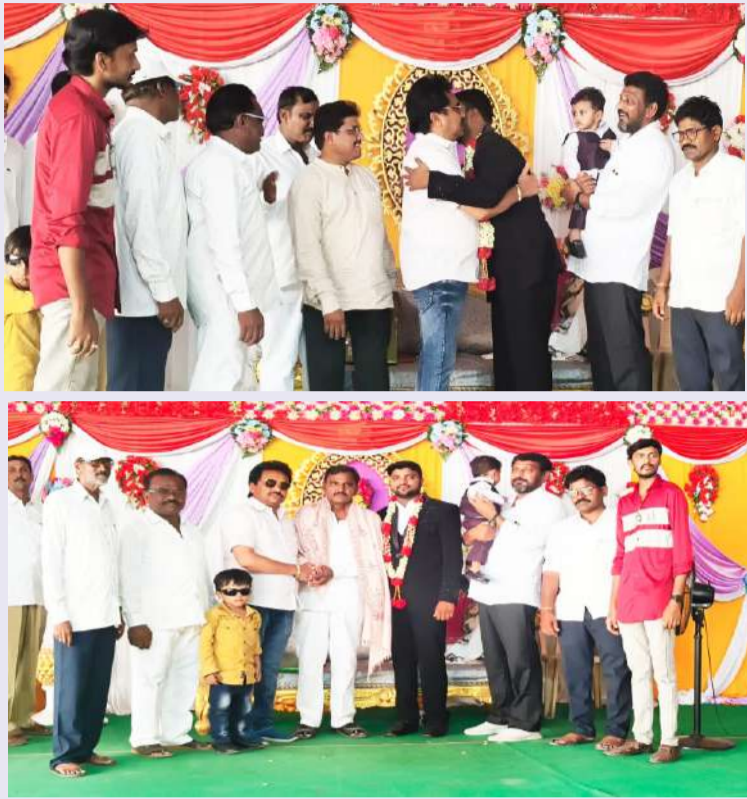
ఎమ్మిగనూరు పల్లె వెలుగు మే 13