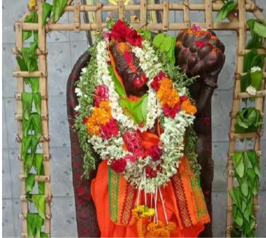
రోజు ఇంటింటికి కాసాయి జెండాలుఇస్తున్నామని తెలిపారు హిందువుని గర్వించు-హిందువుగా జీవించు.