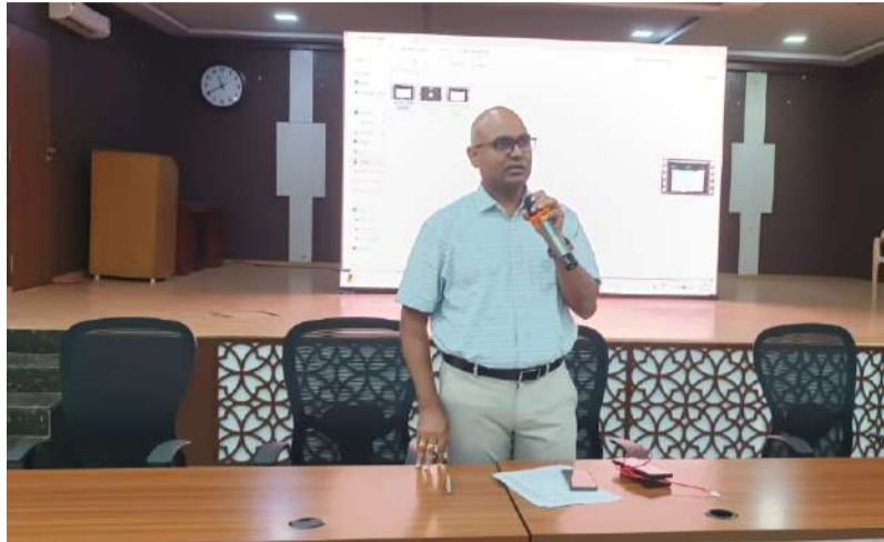
కర్నూలు నగరపాలక సంస్థ కమిషనర్ చల్లా ఓబులేసు