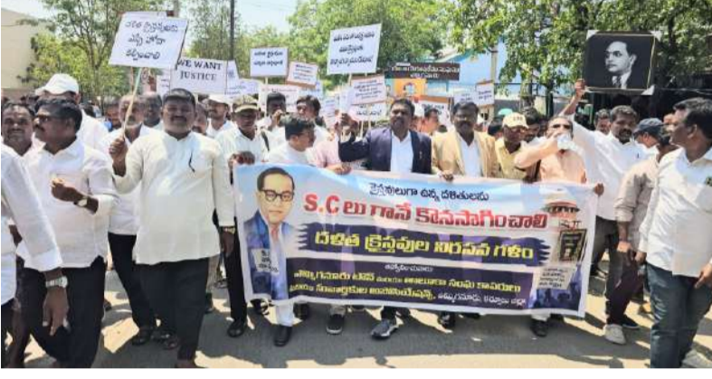
వేలాది మందితో భారీ ర్యాలీ నిర్వహించిన దళిత క్రైస్తవులు తహశీల్దార్ కు వినతి పత్రం అందజేసిన దళిత క్రైస్తవులు సహనం కోల్పోతే ఇక సమరమే దళిత ప్రజాసంఘాలు