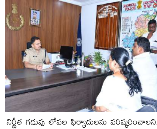
నిర్ణీత గడువు లోపల ఫిర్యాదులను పరిష్కరించాలని, ఫిర్యాదులు పునరావృతం కాకుండా చూడాలని,ఫిర్యాదుల పట్ల నిర్లక్ష్యంగా వ్యవహరించరాదని సంబంధిత అధికారులను ఆదేశించారు.