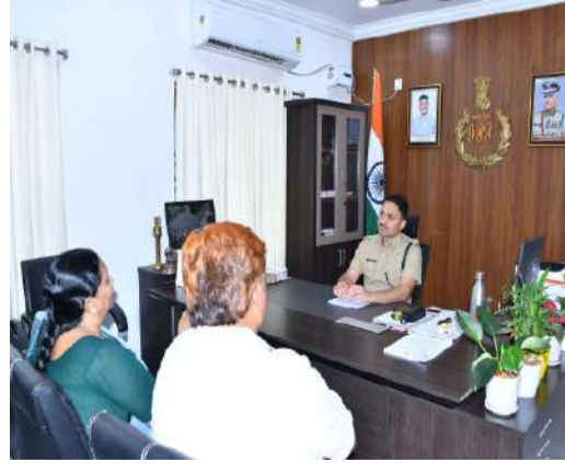
స్వయంగా మాట్లాడి ఫిర్యాదులపై పూర్తిస్థాయి విచారణ జరిపి పరిష్కరించే విధంగా చర్యలు తీసుకుంటామన్నారు. చట్ట పరిధిలో చట్టపరంగా ఉన్న సమస్యలకు తక్షణమే పరిష్కారం చూపాలని,