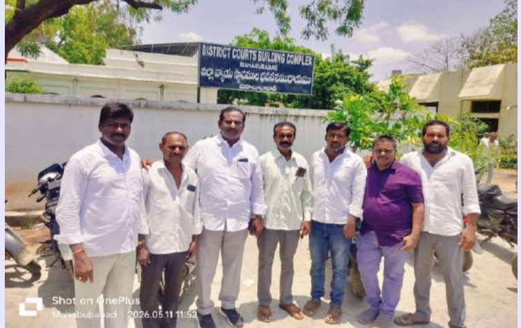
తాళ్లపూసపల్లి గ్రామ పెద్దల డిమాండ్.