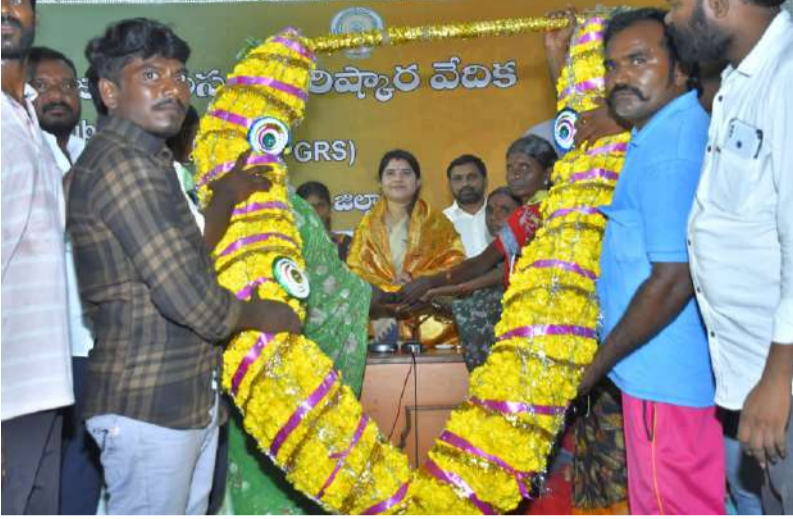
30 ఏళ్ల సమస్యలకు ఆరు నెలల్లో శాశ్వత పరిష్కారం. "భూపనపాడు ఆడపడుచు"గా కలెక్టర్ రాజకుమారికి గ్రామస్థుల ఘన సన్మానం.