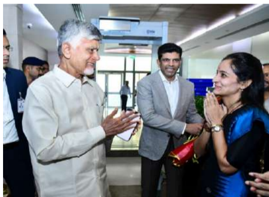
ప్రయోజనాలే లక్ష్యంగా కేంద్ర ప్రభుత్వంతో సమన్వయం చేసుకుంటూ ముందుకు సాగాలని సీఎం చంద్రబాబు నాయుడు సూచించారన్నారు.