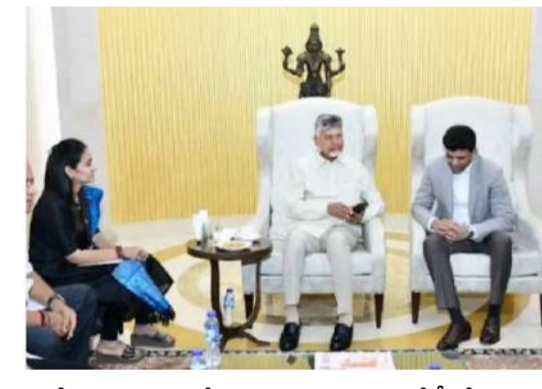
ప్రత్యేకంగా సమావేశమయ్యారని, ఈ భేటీలో రాష్ట్రానికి సంబంధించిన పెండింగ్ ప్రాజెక్టులు, కేంద్రం నుండి రావాల్సిన నిధులు విషయంలో ఎంపీలకు దిశానిర్దేశం చేశారన్నారు. రాష్ట్ర

రాష్ట్ర ముఖ్యమంత్రి నారా చంద్రబాబు నాయుడు ఢిల్లీ పర్యటన సందర్భంగా సోమవారం తెలుగుదేశం పార్టీ ఎంపీలు ఘన స్వాగతం పలికినట్లు నంద్యాల పార్లమెంట్ సభ్యురాలు, లోక్ సభ డి.పి. డి.పూజీ షోర్ లీడర్, తెలుగుదేశం పార్టీ జాతీయ ప్రధాన కార్యదర్శి డాక్టర్ బైరెడ్డి శబరి తెలిపారు. ముఖ్యమంత్రి నారా చంద్రబాబు నాయుడు ఢిల్లీ విమానాశ్రయానికి చేరుకోగానే పుష్పగుచ్ఛాలు అందించి సాదరంగా ఆహ్వానించామన్నారు. అనంతరం, ముఖ్యమంత్రి తన ఢిల్లీ పర్యటనలో భాగంగా రాష్ట్ర ఎంపీలతో