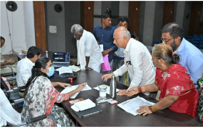
ఠి-ఓపెన్ అర్బిలై ప్రత్యేక దృష్టి సారించి వాటిని పరిష్కరించే విధంగా చర్యలు చేపట్టండి జిల్లా కలెక్టర్ డా.ఎ.సిరి