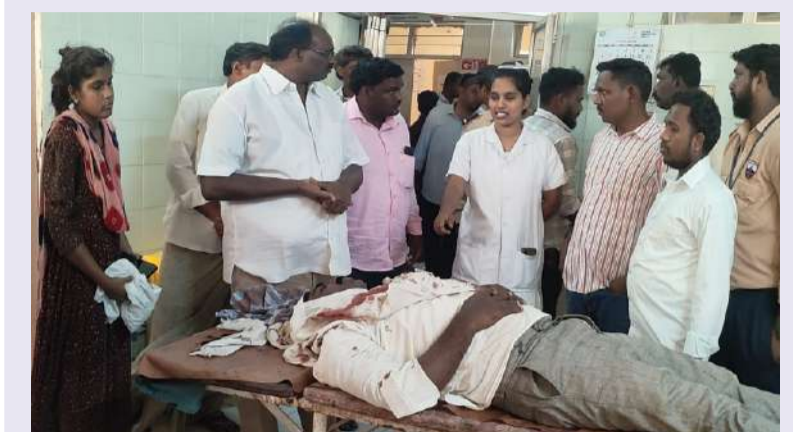
ఘర్షణలో గాయపడిన వారిని పరామర్శించినపతి నాయుడు. దాడికి పాల్పడిన వారిపై చర్యలు తీసుకోవాలి.