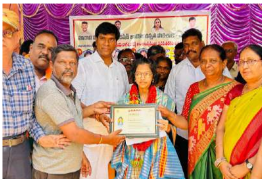
ఎమ్మిగనూరు పల్లె వెలుగు మే 11