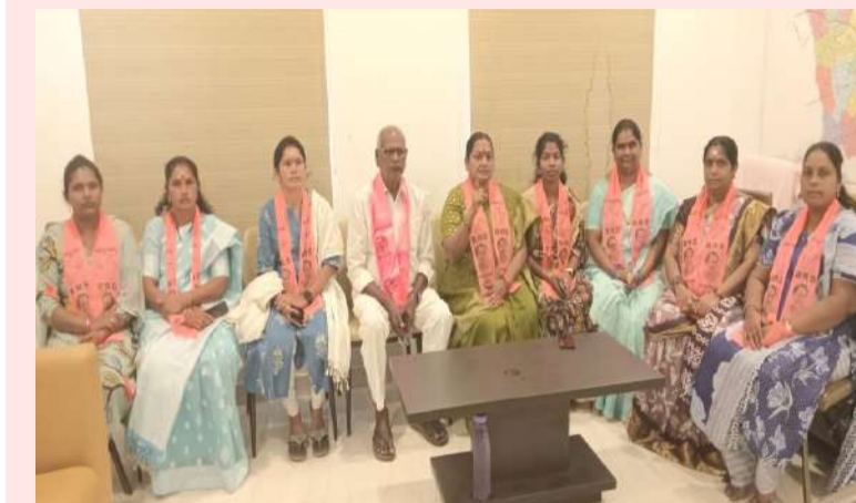
సూర్యాపేట మే 11 పల్లె వెలుగు:

బాధిత కుటుంబం పై దౌర్జన్యం చేస్తే సహించేది లేదు.. ఫోక్స్ కేసులో నిర్లక్ష్యంగా వ్యవహరిస్తున్న పోలీసులను సస్పెండ్ చేయాలి.