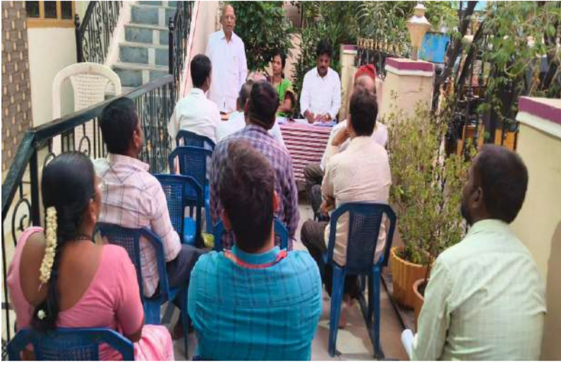
అవినీతిపరుల ఆట కట్టిస్తూ, నేషనల్ యాంటీ కరప్షన్ ప్రెసిడెంట్ బడేసా నాయుడు.