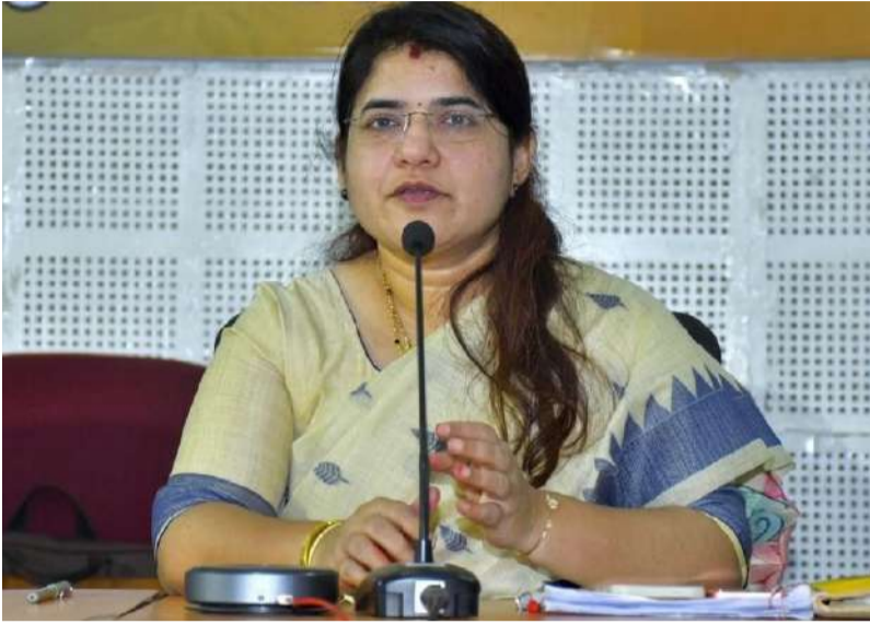
ప్రతి శుక్రవారం నియోజకవర్గ స్థాయిలో ప్రజా ప్రతినిధులతో కలిసి పీజీఆర్ఎస్ కార్యక్రమాలు.