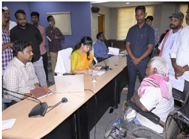
జిల్లా కలెక్టర్ స్నేహ శబరీష్