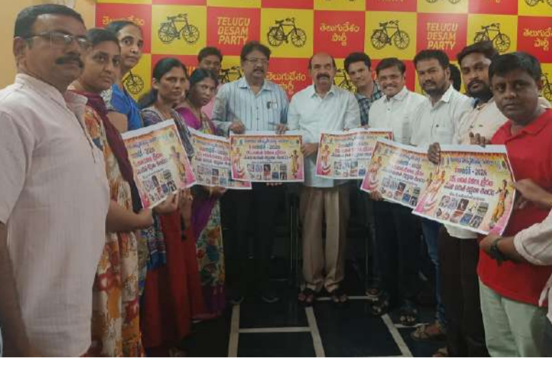
“కళా సాధన” లలిత కళల వేసవి శిక్షణ శిబిరం కరపత్రాలు అవిష్కరించిన మంత్రి ఫరూక్.