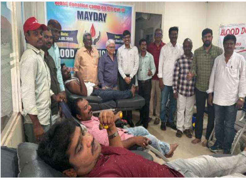
రక్తదానంతో ప్రాణ దాతలు కండి