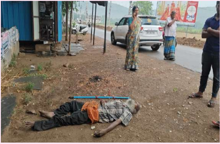
మహానంది, పల్లె వెలుగు

మహానందిలోని తెలుగు గంగ కాలనీ వద్ద గుర్తు తెలియని వృద్ధుడు మృతి చెందినట్లు ఏఎస్ఐ మౌలాలి బుధవారం తెలిపారు. ఇతను మహానందిలో కొద్దిరోజులూ బిక్షాటన చేస్తూ జీవనం సాగిస్తున్నారు. మృతిచెందిన వృద్ధుడికి సుమారు 70 సంవత్సరాలు ఉండవచ్చు అన్నారు. మృతుడి పూర్తి వివరాలు తెలియకపోవడంతో అనాధ శవంగా గుర్తించి అంత్యక్రియలు నిర్వహించామన్నారు. మృతదేహాన్ని మహానంది తహసీల్దార్ రమాదేవి పరిశీలించారు. పంచనామా నిర్వహించారు. మృతుడి ఆహూతి ఎవరికైనా తెలిస్తే మహానంది పోలీస్ స్టేషన్ కు సంప్రదించాలన్నారు.