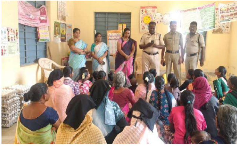
శక్తి యాప్ నీ చెంత ఉంటే... మీరు పోలీసుల రక్షణలో ఉన్నట్టే.