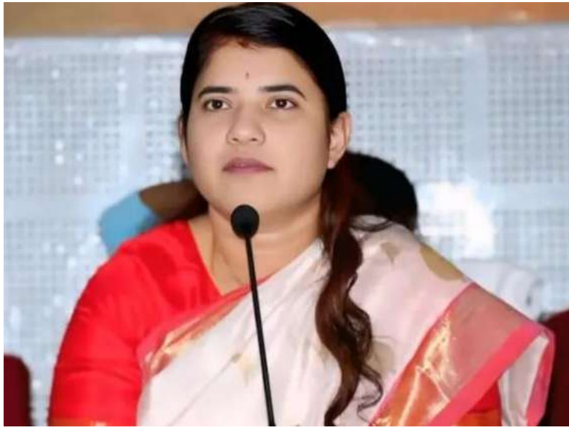
వేదికకు తీసుకురావాలని సూచించారు. జిల్లా కేంద్రంలో ఉదయం 9:30 గంటలకు ప్రారంభమయ్యే ఈ కార్యక్రమానికి సంబంధిత శాఖల అధికారులందరూ తప్పనిసరిగా హాజరుకావాలని కలెక్టర్ ఆ ప్రకటనలో పేర్కొన్నారు.

జిల్లా వ్యాప్తంగా ప్రజల సమస్యలను వేగవంతంగా పరిష్కరించేందుకు ఈ నెల 04వ తేదీ (సోమవారం)న ప్రజా సమస్యల పరిష్కార వేదిక నిర్వహించనున్నట్లు జిల్లా కలెక్టర్ జి. రాజకుమారి ఆదివారం ఒక ప్రకటనలో తెలిపారు. ఈ కార్యక్రమం నంద్యాల జిల్లా కలెక్టరేట్ పాటు అన్ని డివిజన్, మండల కేంద్రాలు మరియు మున్సిపల్ కార్యాలయాల్లో ఒకేసారి నిర్వహించబడుతుందన్నారు. వేసవి ఉష్ణోగ్రతలను దృష్టిలో ఉంచుకుని కార్యక్రమాన్ని ఉదయం 9:30 గంటల నుంచి మధ్యాహ్నం 1:00 గంటల వరకు నిర్వహిస్తున్నట్లు కలెక్టర్ తెలిపారు. ప్రజలు తమ అడ్డంకులను ప్రత్యక్షంగా సమర్పించడమే కాకుండా, ఎవవనికీయిఎ.ఘజూ.ప్రశీజి.అఱ వెబ్ సైట్ ద్వారా అవైస్ లో కూడా సమాచారం చేసుకునే సౌకర్యం కల్పించబడిందన్నారు. అడ్డంకుల పరిష్కార స్థితిని అదే వెబ్ సైట్ లో లేదా టోల్ ఫ్రీ నెంబర్ 1100 ద్వారా తెలుసుకోవచ్చని కలెక్టర్ తెలిపారు. అడ్డంకులు ముందుగా తమకు సంబంధించిన మండల, డివిజన్ లేదా మున్సిపల్ కార్యాలయాల్లో అధికారులకు వివరించాలి. అక్కడ పరిష్కారం కాని సమస్యలనే జిల్లా స్థాయి