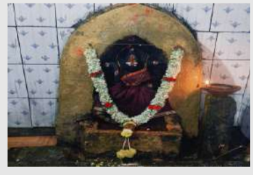
హోళగుండ పల్లె వెలుగు మే 03