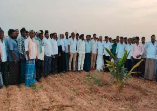
ఆధారాలతో సహా నిలబీసిన కల్లూరు మండల టీడీపి నాయకులు -బస్తిపాడు గ్రామకంఠం భూమిలో వాస్తవాలను వెల్లడించిన గ్రామ పెద్దలు