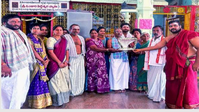
బండి ఆత్మకూరు పల్లె వెలుగు మే 3 :