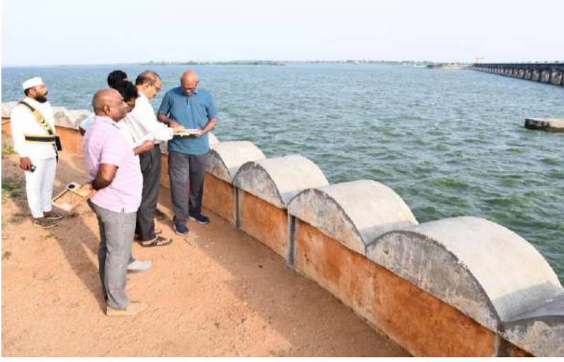
జూలై వరకు సరిపడేంత 3.64 టీఎంసీల నీటి నిల్వ