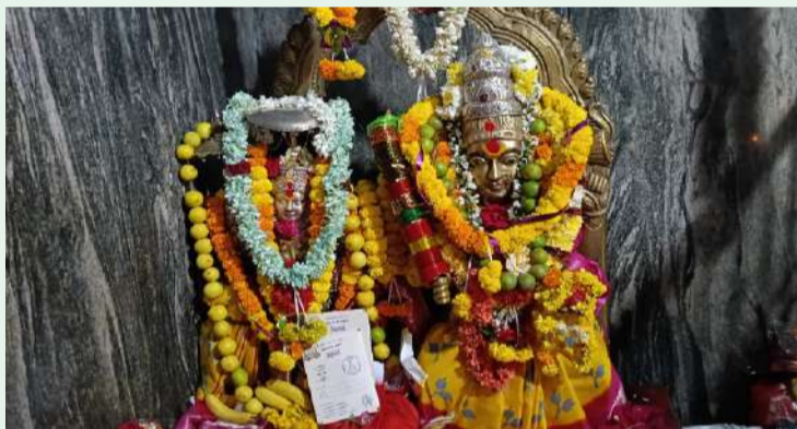
దొర్లపాడు మే 4 పల్లె వెలుగు న్యూస్

మండలంలోని డబ్బుగోవిందిన్నె గ్రామంలో వెలసిన మూల పెద్దమ్మ అమ్మవారికి మంగళవారం శుక్రవారం, ఆదివారం ప్రత్యేక అమ్మ మూల పెద్దమ్మకు ప్రత్యేక పూజలు చేశారు. వేకువజామునుంచే మహిళలు పుణ్యస్నానాలు ఆచరించి అమ్మవారిని దర్శించుకున్నారు. గాజులు, నిమ్మకాయలు, చీరలు, పిండివంటలు అమ్మవారికి మొక్కుగా చెల్లించారు. అనంతరం ఆలయ నిర్వాహకులు బోయ మధు భక్తాదులకు తీర్థప్రసాదాలు అందజేశారు.