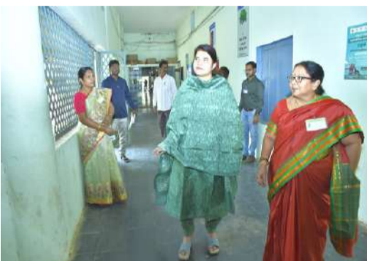
పరీక్షా కేంద్రాలను ఆకస్మికంగా తనిఖీ చేసిన జిల్లా కలెక్టర్. కట్టుదిట్టమైన భద్రతా ఏర్పాటు మధ్య నిర్వహణ. 1434 మందికి పరీక్ష. 36 మంది గ్రెజుండారు.