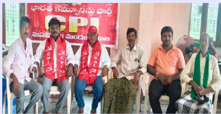
మహానంది, పల్లె వెలుగు