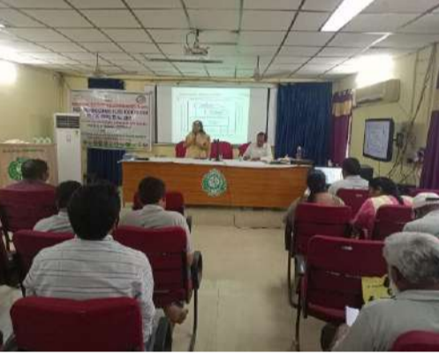
-వ్యవసాయ విస్తరణ సంస్కరణలపై విశదీకరణ