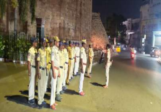
నేరాల నియంత్రణకు ప్రత్యేక చర్యలు