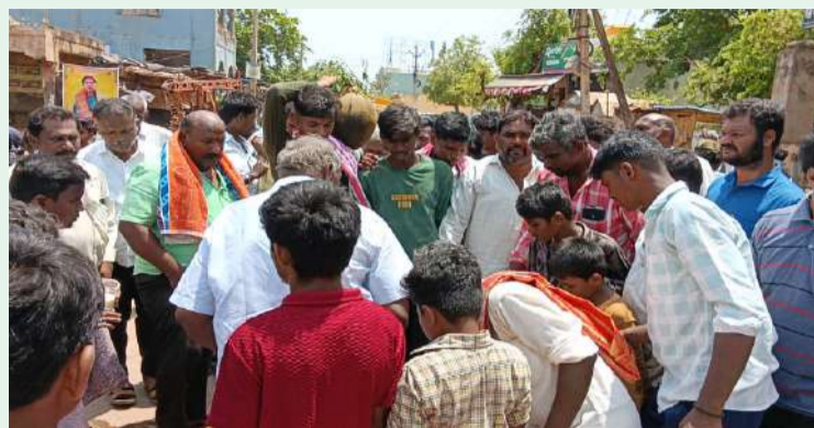
రుద్రవరం. పల్లె వెలుగు :

మండల కేంద్రం రుద్రవరంలో 16 రోజుల పండుగను ఘనంగా జరుపుకున్నారు. గత నెల 20,21 తేదీలలో పెద్దమ్మ జాతర నిర్వహించారు. జాతర నిర్వహించి 16 రోజులు అవుతున్న సందర్భంగా గ్రామ పెద్దలు సాంప్రదాయ ప్రకారము పెద్దమ్మ దగ్గర ఘనంగా పూజలు నిర్వహించి అంబలి తో గ్రామంలోని నలుదిక్కుల చల్లదనం చేసి పెద్దమ్మ జాతర కు ముగింపు పలికారు. గత నెలలో పెద్దమ్మ జాతర సందర్భంగా ముడుపు కట్టి గ్రామంలో ఎటువంటి శుభకార్యాలు మాంసాహారాలు తినకుండా ఉండాలని నిర్ణయించారు. 16 రోజుల పండుగ అనంతరం గ్రామంలో శుభకార్యాలు చేసుకోవచ్చన్నారు. అలాగే మాంసాహారాలు తినవచ్చని పెద్దలు తెలియజేశారు. ఈ కార్యక్రమంలో గ్రామ పెద్దలతో పాటు ప్రజలు హాజరై పూజా కార్యక్రమాలు నిర్వహించారు.