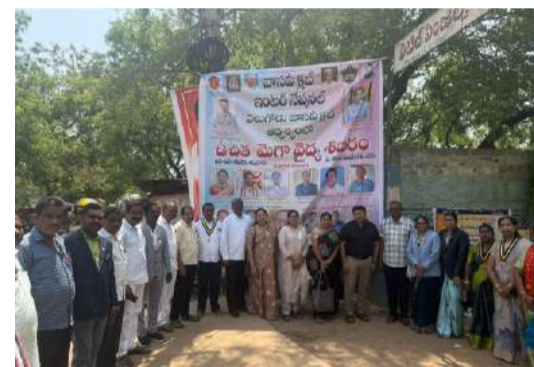
సేవలు అందించారు. ఈ ఉచిత వైద్య శిబిరంలో సుమారు 300 మంది కి పైగ వైద్య సేవ నిర్వహించి ఉచితంగా మందులు పంపిణీ చేశారు. ఈ కార్యక్రమంలో వాసవి క్లబ్ సభ్యులు, గ్రామ పెద్దలు ప్రజలు, సిబ్బంది తదితరులు పాల్గొన్నారు.