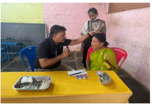
వెలుగోడు. మే 03 (పల్లె వెలుగు) : వెలుగోడు లో వాసవి క్లబ్ ఇంటర్నేషనల్ వారి ఆధ్వర్యంలో ఆదివారం ఉచిత మోగ వైద్య శిబిరం నిర్వహించారు. ఈ సందర్భంగా వాసవి క్లబ్ వారు మాట్లాడుతూ నంద్యాల పట్టణానికి చెందిన నెరవాటి