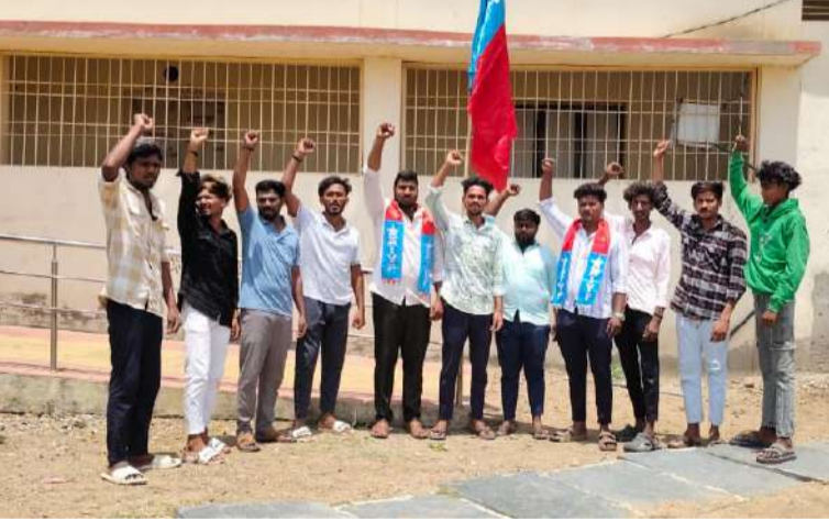
-మంత్రాలయం మండల సమితి ఆధ్వర్యంలో