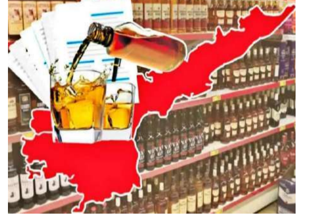
భారీగా పన్ను ఎగవేత జరిగిందనే ఆరోపణలపై ఐటీ శాఖ అధికారులు ఇప్పుడు గురిపెట్టారు.

ఆంధ్రప్రదేశ్ లిక్కర్ స్కామ్ కేసు వ్యవహారంలో ఆదాయపు పన్ను శాఖ ఎంట్రి ఇవ్వడంతో ఈ కేసు మరో కీలక మలుపు తిరిగింది. వైసీపీ అధినేత వైఎస్ జగన్ మోహన్ రెడ్డి హయాంలో జరిగిన మద్యం విక్రయాల్లో భారీగా పన్ను ఎగవేత జరిగిందనే ఆరోపణలపై ఐటీ శాఖ అధికారులు ఇప్పుడు గురిపెట్టారు. ఆంధ్రప్రదేశ్ లిక్కర్ స్కామ్ కేసు వ్యవహారంలో ఆదాయపు పన్ను శాఖ ఎంట్రి ఇవ్వడంతో ఈ కేసు మరో కీలక మలుపు తిరిగింది. వైసీపీ అధినేత వైఎస్ జగన్ మోహన్ రెడ్డి హయాంలో జరిగిన మద్యం విక్రయాల్లో