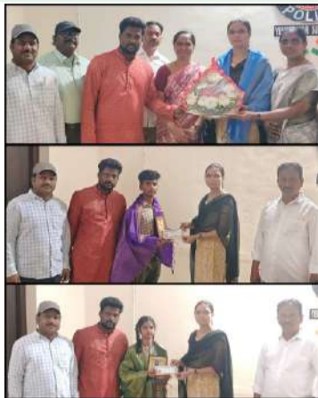
ఎమ్మిగనూరు పల్లె వెలుగు మే 2

విద్యార్థులు కష్టపడి కాకుండా ఇష్టపడి చదవండి -డి.ఎన్.వి భార్గవి