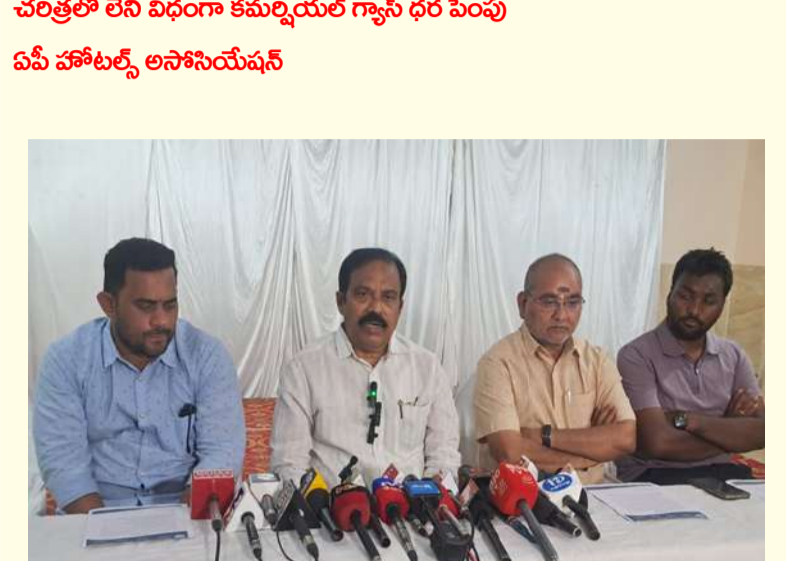
విజయనగరం కోట : పల్లె వెలుగు మే 2