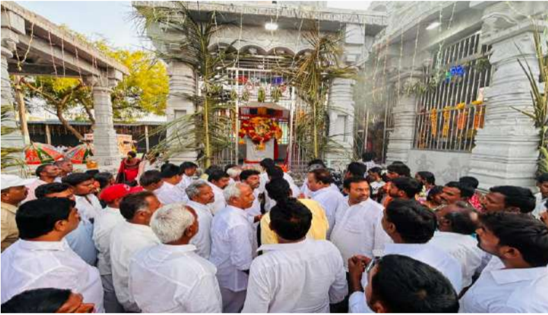
నందవరం పల్లె వెలుగు మే -2