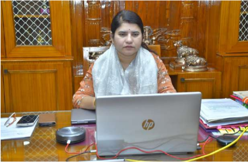
20 మందికి పైగా ఉన్న ప్రాంతాల్లో ప్రత్యేక కోచింగ్ కేంద్రాల ఏర్పాటు.