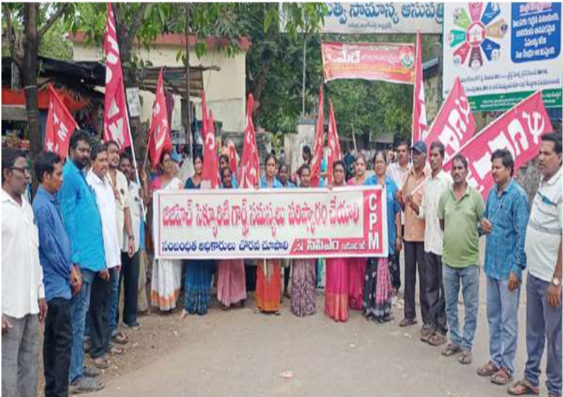
సంబంధిత అధికారులు చొరవ చూపాలని డిమాండ్