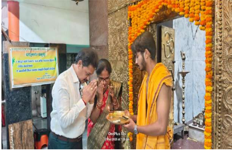
పదకవితా పితామహుడికి నీరాజనం పలికిన భక్తజనం నగర సంగీతన, శృత్య ప్రదర్శనలతో మారుమోగిన పీఠాలు విజేతలకు బహుమతుల ప్రధానం: పాల్గొన్న ప్రముఖులు