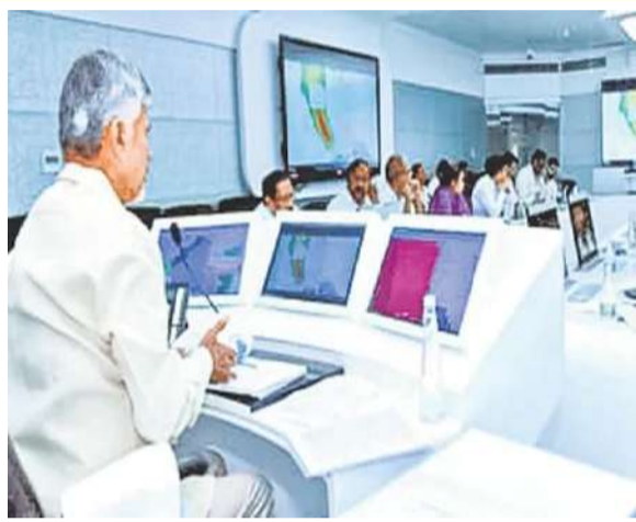
గుర్తించేందుకు 360 డిగ్రీలతో పనిచేసే సీసీ కెమెరా వ్యవస్థ ఉపయోగపడుతోందని తెలిపారు.

రాష్ట్రంలో శాంతి భద్రతలను పరిరక్షించడంలో.. నేరాలను అదుపు చేయడంలో పోలీసులు కీలక పాత్ర పోషిస్తున్నారు. అయితే, తాజాగా నేరస్తులను గుర్తించడంలో రియల్ టైమ్ గవర్నెన్స్ సాస్టెబి(ఆర్టీజిఎస్) ప్రధాన భూమిక పోషిస్తోందని అధికారులు తెలిపారు. (అదృశ్య కేసుల్లో ఫోటోల ఆధారంగా గుర్తింపు. రాష్ట్రంలో శాంతి భద్రతలను పరిరక్షించడంలో.. నేరాలను అదుపు చేయడంలో పోలీసులు కీలక పాత్ర పోషిస్తున్నారు. అయితే, తాజాగా నేరస్తులను గుర్తించడంలో రియల్ టైమ్ గవర్నెన్స్ సాస్టెబి(ఆర్టీజిఎస్) ప్రధాన భూమిక పోషిస్తోందని అధికారులు తెలిపారు. రాష్ట్ర వ్యాప్తంగా ప్రధాన కూడళ్లలో ఏర్పాటు చేసిన సీసీ కెమెరాలు పోలీసింగ్ కు మూడో నేత్రంగా పనిచేస్తున్నాయని ఆర్టిజిఎస్ అధికారులు పేర్కొన్నారు. నేరాలను పసిగడుతూ.. నేరస్తులను