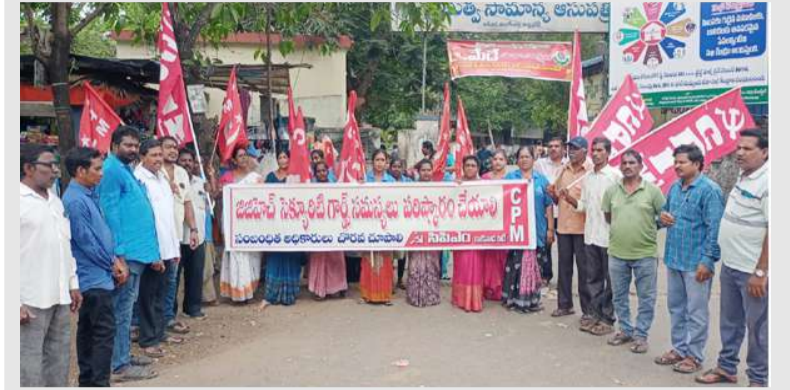
కాకినాడ : పల్లె వెలుగు మే -2