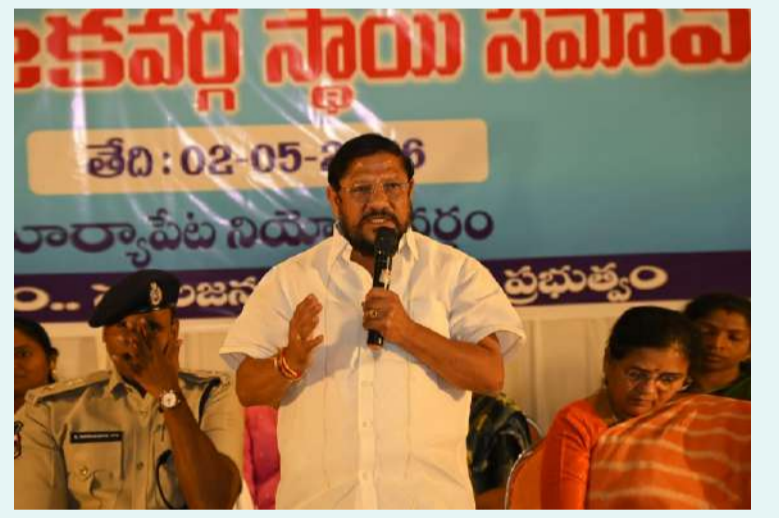
సూర్యాపేట మే 02 పల్లె వెలుగు