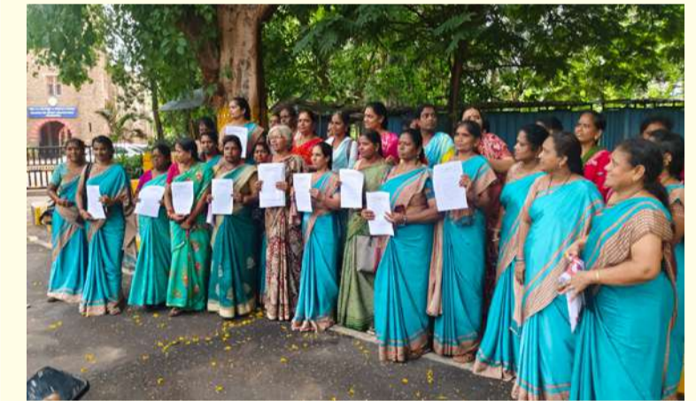
విశాఖ : పల్లె వెలుగు మే 2

ఏపీ మెప్పా ఆర్ పి ఎంప్లాయిస్ యూనియన్ సిబిటియు విశాఖ జిల్లా కమిటీ ఆధ్వర్యంలో నేడు కలెక్టర్ కి ఆర్టిలకు జన గణ ద్యూటీలు రద్దు చేయాలని వినతి పత్రం సమర్పించారు. మెప్పా ఎంపి 07.04. 2026న ఆర్పీ లకు జనగణన ద్యూటీలు వెయ్యవద్దని స్పష్టంగా ఆదేశించినప్పటికీ జీపీఎస్ అధికారులు ఆర్టిలకు ఈ ద్యూటీలు వేశారని వారు పేర్కొన్నారు. స్థానికంగా ఎవరి ఎస్ఎల్ఎఫ్ పరిధిలో ఆ ఆర్ పి కి ద్యూటీ వేయలేదని తెలిపారు. అనారోగ్యంతో ఉన్న ఆర్టి లకు ద్యూటీ నుండి మినహాయింపు కోరిన ఇవ్వడం లేదన్నారు. ఒక మహిళగా కూడా కనీసంగా గౌరవించడం లేదని, జోనల్ కమిషనర్లు సమస్యను పరిష్కరించాల్సింది పోయి, అమర్యాదగా, మినహాయింపు కోరిన ఇవ్వడం లేదన్నారు. ఒక మహిళగా కూడా కనీసంగా గౌరవించడం లేదని, జోనల్ కమిషనర్లు సమస్యను పరిష్కరించాల్సింది పోయి, అమర్యాదగా, అగౌరవంగా మాట్లాడుతున్నారని ఆగ్రహించారు. మహిళగా కించపరుస్తున్నారని, ఈ జనగణన విధులు నిర్వహించాలని తీవ్ర అడ్డీ తెస్తున్నారని మండిపడ్డారు. కావున కలెక్టర్ జోక్యం చేసుకొని మెప్పా ఎంపి ఆదేశాలు అమలు చేసి, ఆర్టిలను ఈ పని భారం నుండి మినహాయించాలని కోరారు. అలాగే నాలుగు నెలల బకాయి జీతాలను పూర్తిగా చెల్లించాలని, లాగిన్ ఆగిన వారికి తక్షణం లాగిన్లు ఇచ్చే విధంగా చర్యలు చేపట్టాలని, అక్షరాంధ్ర దబ్బలు వెంటనే చెల్లించాలని, ఎటువంటి కోతలు లేకుండా పూర్తి వేతనం చెల్లించాలని కలెక్టర్ కి వినతిపత్రం సమర్పించారు. ఈ కార్యక్రమంలో యూనియన్ గౌరవాధ్యక్షురాలు పి. మణి, ప్రధాన కార్యదర్శి సిహెచ్ రుషానీ, కోశాధికారి సిహెచ్ సత్య వరలక్ష్మి, ఉపాధ్యక్షులు ధనలక్ష్మి, త్రివేణి, కార్యదర్శులు మల్లీశ్వరి లత, రామలక్ష్మి, జిల్లా కమిటీ సభ్యులు సుబ్బమ్మ, భవాని, రాజేశ్వరి, ఆదిలక్ష్మి, తదితరులు నాయకత్వం వహించారు.