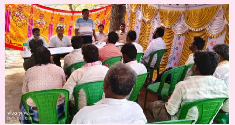
ఎమ్మిగనూరు పల్లె వెలుగు మే 1