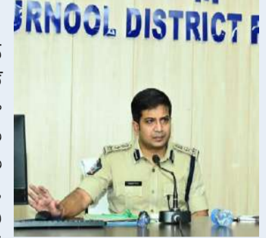
పల్లెవెలుగు కర్నూలు క్రైమ్.

ముసుగులో మోసాలు. వ్యక్తిగత వివరాలు పంచుకోవద్దు... సైబర్ నేరాల పట్ల ప్రజలు అప్రమత్తంగా ఉండాలి. కర్నూలు ఎస్పీ విక్రాంత్ పాటిల్