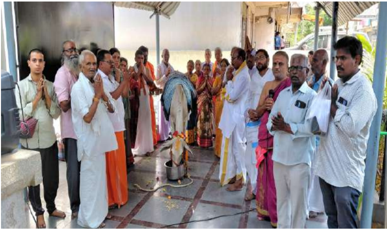
ఘనంగా ముగిసిన తిదిదే ధార్మిక కార్యక్రమాలు