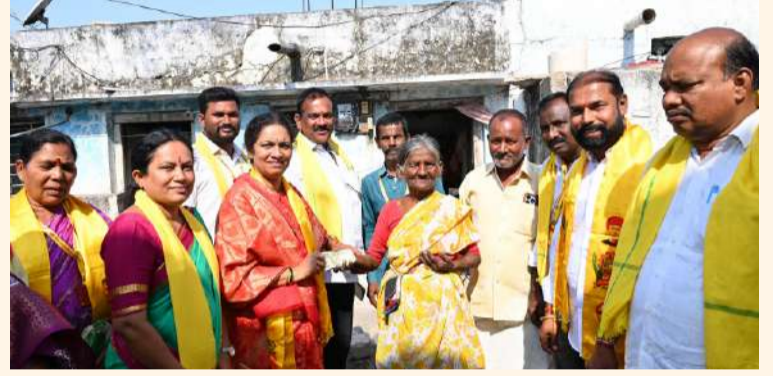
పల్లె వెలుగు కర్నూలు బ్యూరో