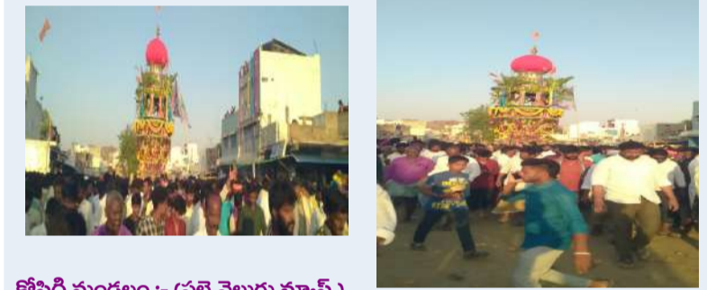
కోసిగి మండలం :- (పల్లె వెలుగు న్యూస్ )