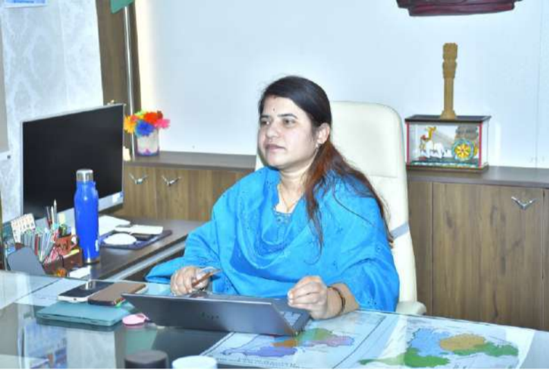
మండలాల నుంచి క్లెయిమ్స్ సేకరణపై ప్రత్యేక దృష్టి.

ఐదు జాతీయ రహదారి ప్రాజెక్టుల పురోగతిపై సమీక్ష.