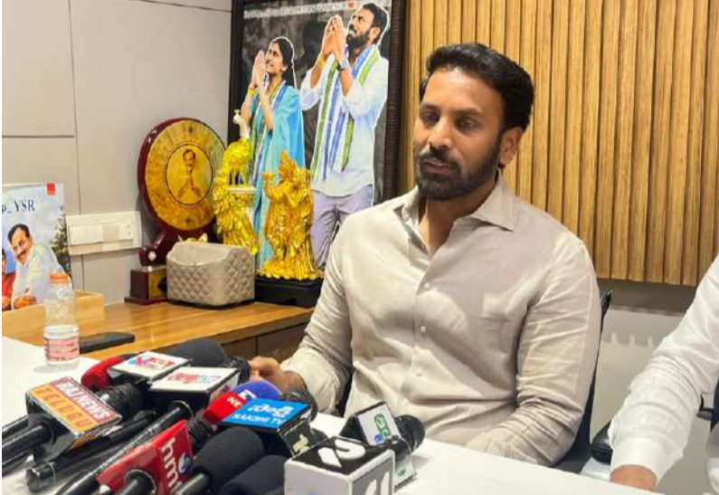
పల్లె వెలుగు నంద్యాల జిల్లా బ్యూరో.