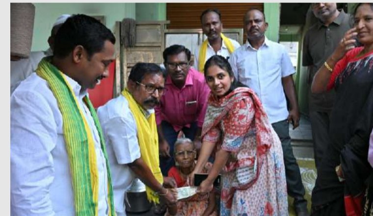
పల్లె వెలుగు కర్నూలు బ్యూరో

మే మాసంలో జిల్లావ్యాప్తంగా రూ.103.90 కోట్ల పెన్షన్ల పంపిణీ 2.35 లక్షల మంది లబ్ధిదారులకు ప్రయోజనం