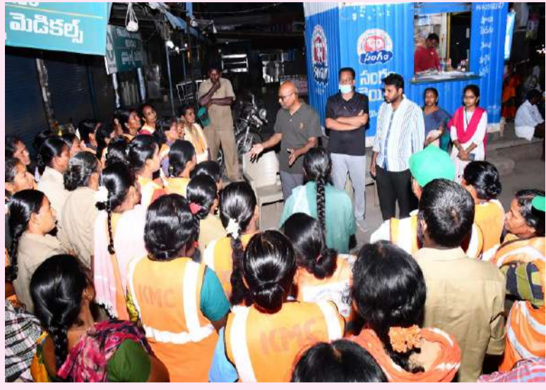
పల్లె వెలుగు కర్నూలు రిపోర్టర్ :