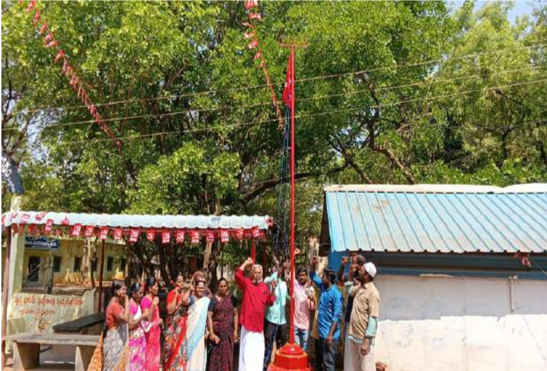
రుద్రవరం. పల్లె వెలుగు :