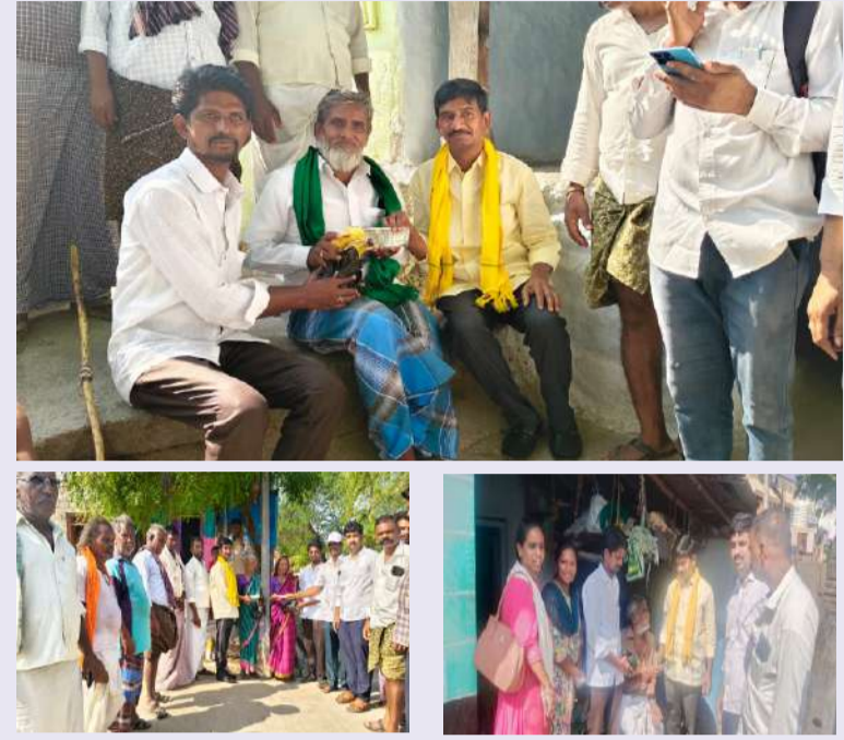
నందవరం పల్లె వెలుగు మే 1