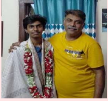
సంద్యాల ప్రతినిధి. మే 01 (నంది పత్రిక)