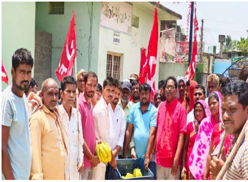
కేసముద్రం, మే 01

:కేసముద్రం మండల కేంద్రంలో శుక్రవారం భారత కార్మిక సంఘాల సమాఖ్య ఆధ్వర్యంలో 140వ మేడే ఉత్సవాలను ఘనంగా నిర్వహించారు. ముందుగా పట్టణంలో అంబేద్కర్ సెంటర్ నుండి మార్చెట్ వరకు ర్యాలీ నిర్వహించారు. మార్చెట్ సెంటర్లో హమాలి కార్మికుల జెండా గడ్డెపై హమాళీ యూనియన్