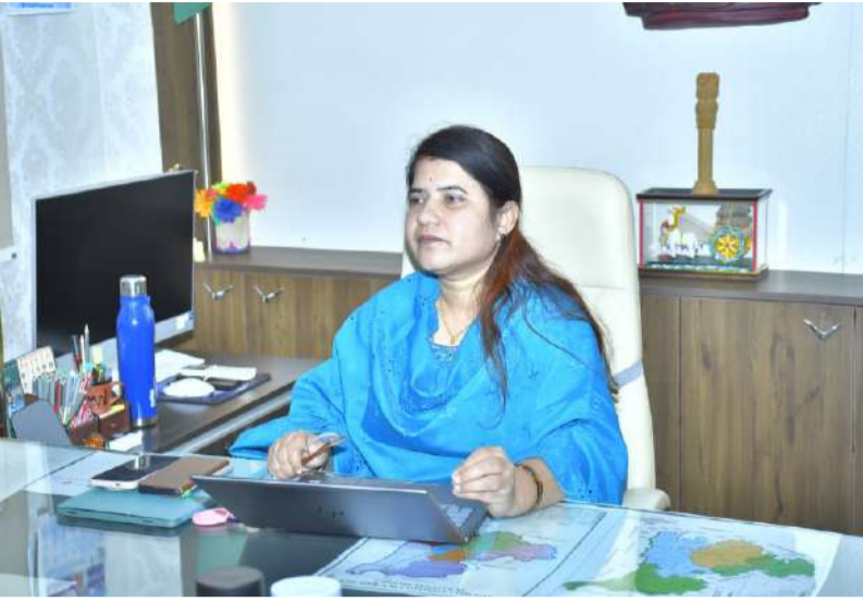
శ్రీశైలం జలవనరుల శాఖ క్వార్టర్స్ ఆక్రమణలపై జిల్లా కలెక్టర్ జి.