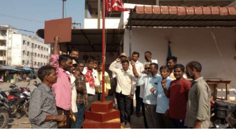
రంగారెడ్డి రాజేంద్రనగర్ పల్లె వెలుగు ప్రతినిధి: