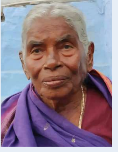
పల్లె వెలుగు నంద్యాల రూరల్.