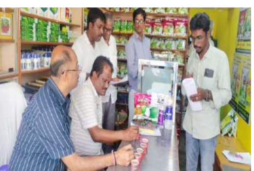
నాణ్యతలేని విత్తనాలు విక్రయించే దుకాణాలపై వ్యవసాయ అధికారులు. 20 లక్షలు విలువ చేసే పత్తి విత్తనాలు