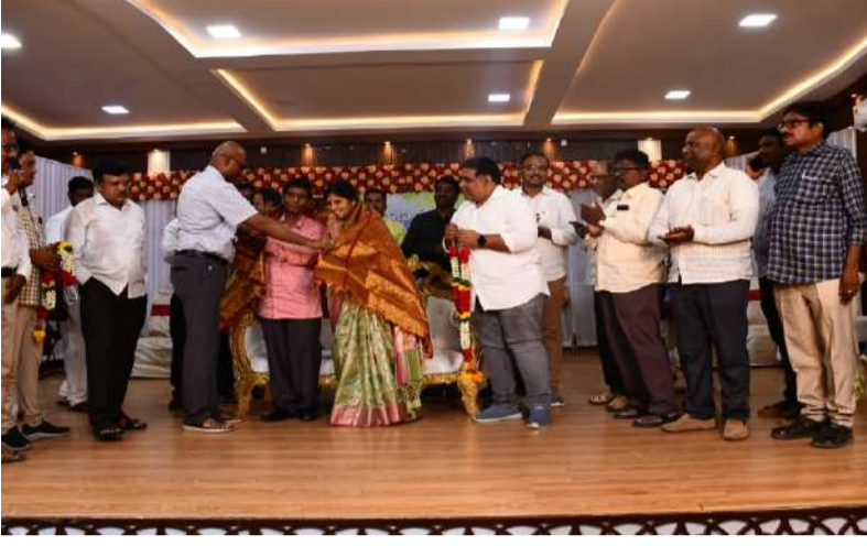
పదేళ్లపాటు ఏకతాటిగా మేనేజర్ గా పనిచేసిన ఉత్తీక అధికారి సహోద్యోగులు, రిటైర్డ్ అధికారులు, ప్రజా సంఘాల నేతల శుభాకాంక్షల వెల్లువ