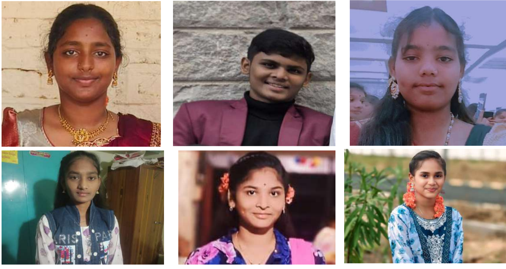
పందశాతం ఫలితాలు సాధించిన కేజీబీబీ బాలికలు