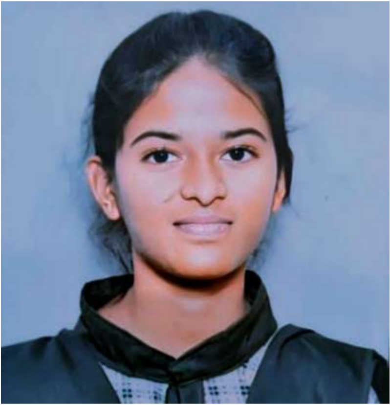
బండి ఆత్మకూరు పల్లె వెలుగు ఏప్రిల్ 30 :