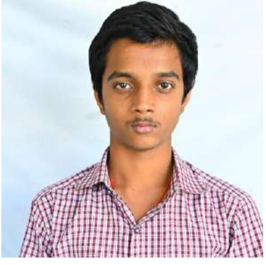
మండల టాపర్ గా శాంతినికేతన్ విద్యార్థి