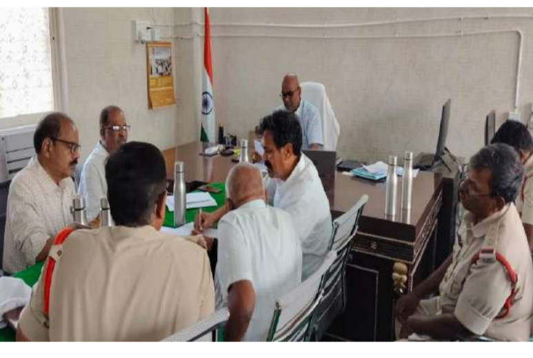
ట్రాఫిక్ పోలీస్, ఏపీఎస్ఆర్టీసీ శాఖలు సహకరించాలి