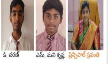
పఠాన్ చెరు, సంగారెడ్డి, ఏప్రిల్ 30.

పఠాన్ చెరు మండలం చిన్న కంచర్ల గ్రామంలో గల బీసీ గురుకుల మహాత్మా జ్యోతిబాపూలే పాఠశాల, విద్యార్థులు మరోసారి పదవ తరగతి ఫలితాల్లో