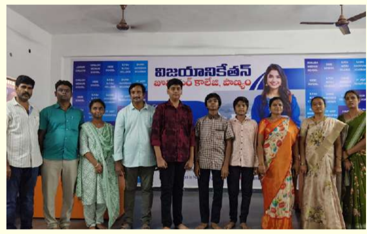
పాఠశాల ఏప్రిల్ 30 పల్లె వెలుగు :