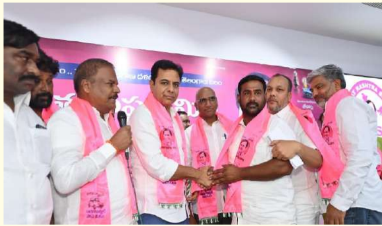
హైదరాబాద్, ఏప్రిల్ 29

రైతులు, విద్యార్థులు, అన్ని వర్గాల సమస్యలపై తీవ్ర విమర్శలు