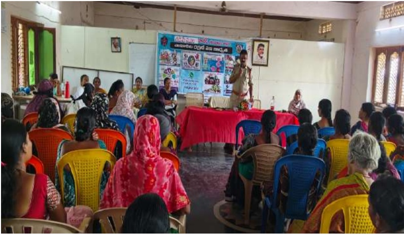
గడివేముల పల్లె వెలుగు దినపత్రిక