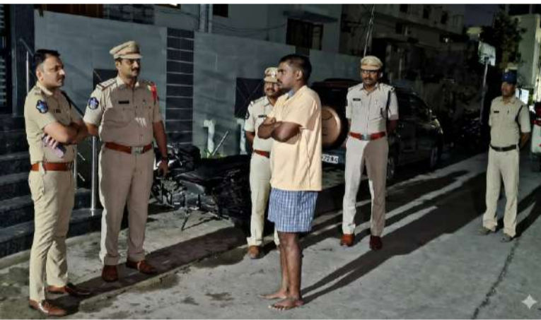
అసాంఘిక, చట్ట వ్యతిరేక కార్యకలాపాల నియంత్రణ లక్ష్యం. నిరంతరం అప్రమత్తంగా ఉంటూ గస్తీ నిర్వహించాలని సిబ్బందికి ఆదేశాలు జారీ.