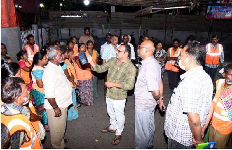
ఇద్దరు శానిటేషన్ కార్యదర్శులకు షోకాజ్ నోటీసులు సమర్పించుటపై పారిశుధ్య నిర్వహణలో ప్రజలే కీలకం కార్మికులకు పనిముట్లు, హెల్మెట్స్ కిట్లు వెంటనే అందించాలి