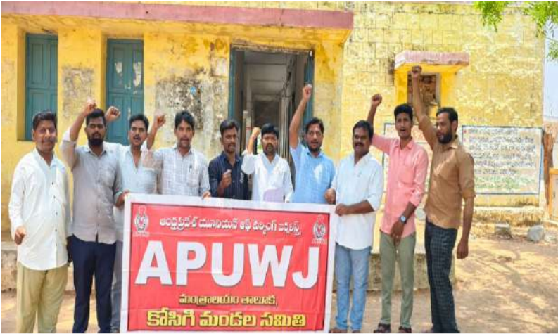
కోసిగిలో ఏపీయూడబ్ల్యుజే భారీగా ధర్మా... నిందితులను వెంటనే అరెస్ట్ చేయాలి: ఏపీయూడబ్ల్యుజే డిమాండ్ కోసిగి తహసిల్దార్ కార్యాలయం ముందు జర్నలిస్టుల నిరసన