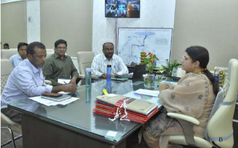
నూతన పరిశ్రమలతో నిరుద్యోగ యువతకు ఉపాధి అవకాశాలు. పరిశ్రమల స్థాపనతో జిల్లా అభివృద్ధి వేగవంతం - కలెక్టర్ రాజకుమారి. జిల్లాలో పరిశ్రమల స్థాపనకు మౌలిక వసతులు సమృద్ధిగా ఉన్నాయని వెల్లడి.