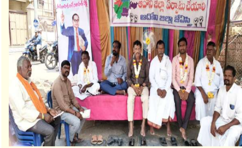
ఆదోని (పల్లె వెలుగు):