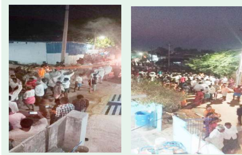
దొర్నిపాడు ఏప్రిల్ 29 పల్లె వెలుగు న్యూస్

దొర్నిపాడు గ్రామంలో 13 సంవత్సరాల తర్వాత అంగరంగ వైభవంగా జరిగే అమ్మవార్ల తిరుణాల జ్యోతి ఉత్సవాలకు ఎద్దులతో తేరు బండి పై గ్రామోత్సవం నిర్వహించే సిరిమానును కొండాపురం గ్రామం నుండి బుధవారం మేళ తాళాలతో పూజలు అందుకుంటూ బయలుదేరి దొర్నిపాడు గ్రామానికి గ్రామ పెద్దలు తీసుకొని వస్తున్నారని జ్యోతులు, తిరుణాల సందర్భంగా గ్రామంలో సిరిసంపదలు కలగాలంటే సిరిమానుతో గ్రామోత్సవం నిర్వహించడం వల్ల గ్రామం సుఖిక్రంగా సిరిసంపదలతో ఉంటుందని పెద్దల నానుడి మీ 5 6 ,7 తేదీల్లో జరిగే తిరుణాల మహోత్సవాలకు ప్రజలు పెద్ద సంఖ్యలో తరలివస్తారుతిరుణాల అనంతరము అనువాయితీ ప్రకారము సిరిమానును కొండాపురం గ్రామంలో ఉంచడం అనువాయితీ అందులో భాగంగా కొండాపురం నుండి తిరునాళ్లకు సిరిమానును గ్రామ పెద్దలు, ప్రజలు పెద్ద సంఖ్యలో పాల్గొని గ్రామోత్సవంతో తీసుకొస్తున్నారు.