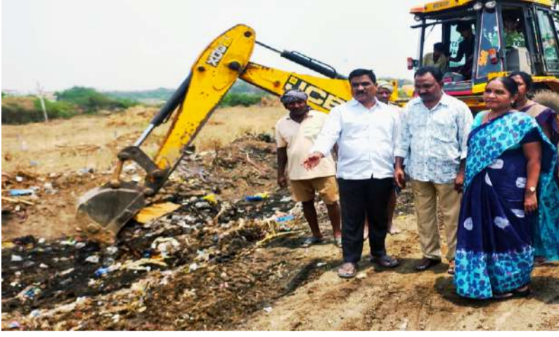
బండి ఆత్మకూరు పల్లె వెలుగు ఏప్రిల్ 29:

రహదారుల పరిశుభ్రతపై సంబంధిత అధికారులు చర్యలు చేపట్టాలని పంచాయతీరాజ్ కమిషనర్ అధికారులందరికీ ఆదేశాలు జారీ చేశారు. ఇకనుండి ప్రతి బుధవారం స్వచ్ఛపథం రోజుగా నిర్వహించాలని పేర్కొన్నారు. అన్ని గ్రామ పంచాయతీల పరిధిలో రహదారుల పక్కన ఉన్న చెత్త తొలగింపు తో పాటు రోడ్ల పరిశుభ్రతను చేపట్టాలని పేర్కొన్నారు. గ్రామ ప్రధాన రహదారులు అంతర్గత వీధుల శుభ్రతపై ప్రత్యేక దృష్టి పెట్టాలని అన్నారు. శుభ్రత కార్యక్రమం చేపట్టే ముందు తర్వాత ఫోటోలు తీసి నమోదు చేయాలని ఆదేశించారు. గ్రామాలలో చెత్త నిర్వహణ వద్దతులను మెరుగుపరిచి ఎక్కడ చెత్త పేరుకొని పోకుండా చర్య చేపట్టాలని పేర్కొన్నారు. ప్రతిరోజు ఉదయం 7 గంటల నుండి శుభ్రత పనులను అధికారులు పర్యవేక్షించాలని ఆదేశాలలో పేర్కొన్నారు. చేపట్టిన కార్యక్రమాలను పి ఆర్ వన్ యాప్ లో సమయానికి అప్డేట్ చేయాలని పేర్కొన్నారు. డంపింగ్ యార్డులు ఎన్ డబ్ల్యూ పిసి మరియు ఇతర శుభ్రత మౌలిక సదుపాయాలను