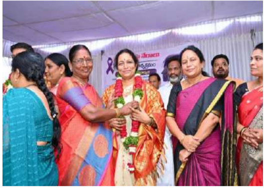
- బాల్య వివాహాలను రూపుమాపాలి: కర్నూలు ఎస్పీ విక్రాంత్ పాటిల్ ఐపీఎస్ - మహిళలు అన్ని రంగాల్లో రాణించాలి: ఎమ్మెల్యే గౌరు చరితా రెడ్డి - ఓర్వకల్లులో ఘనంగా అవగాహన కార్యక్రమం కు స్టార్ట్ ఫోన్ల పంపిణీ