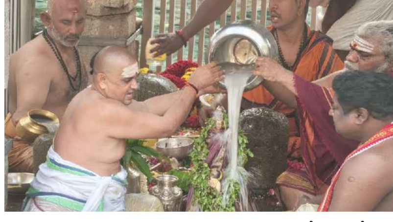
మహానంది, పల్లె వెలుగు

మహానంది పుణ్యక్షేత్రంలో గంగాదేవి పుష్కరోత్సవ వేడుకలను భక్తిశ్రద్ధలతో వైభవంగా నిర్వహించారు. గురువారం వైశాఖ శుద్ధ సప్తమిని పురస్కరించుకొని గంగా పుష్కరోత్సవ వేడుకలను వేద పండితులు వేదమంత్రాలతో నిర్వహించారు. ఆలయ ఈవో ఎన్.శ్రీనివాసరెడ్డి పర్యవేక్షణలో, ఏఈవో మధుచే వేద పండితులు