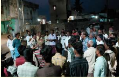
బండిఆత్మకూరు పల్లె వెలుగు ఏప్రిల్ 23 :

ప్రశాంతమైన గ్రామాల్లో అల్లర్లు, గొడవలు సృష్టిస్తే కఠిన చర్యలు తీసుకుంటామని బండి ఆత్మకూరు ఎస్పీ జగన్మోహన్ హెచ్చరించారు. గురువారం సాయంత్రం మండల పరిధిలోని సింగవరం గ్రామంలో ప్రజలకు పోలీస్ శాఖ తరఫున అవగాహన కల్పించారు. ఈ సందర్భంగా ఎస్పీ జగన్మోహన్ మాట్లాడుతూ చిన్న చిన్న సమస్యలకు ఘర్షణ పడి జీవితాలను నాశనం చేసుకోవద్దని కోరారు. సమస్యలు ఉంటే నేరుగా పోలీసు అధికారులకు సమాచారం ఇవ్వాలని చర్యలు తీసుకుంటామని కోరారు. గ్రామాల్లో ప్రశాంతత వాతావరణాన్ని ఏర్పాటు చేయాలని సింగవరం గ్రామస్థులకు సూచించారు. చట్టాన్ని చేతిలో తీసుకొని ఇష్టానుసారంగా ప్రవర్తిస్తే కఠిన చర్యలు తీసుకొని కేసులు నమోదు చేస్తామని హెచ్చరించారు. ఈ కార్యక్రమంలో పోలీస్ సిబ్బంది పాల్గొన్నారు.