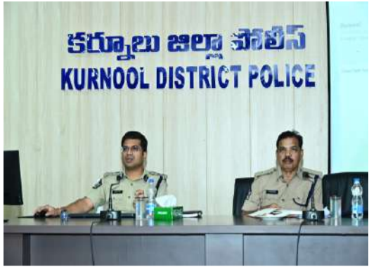
నేర నియంత్రణే లక్ష్యం. అలసత్వం వహిస్తే సహించేది లేదు గట్టిగా పనిచేయాలి. డయల్ 112 కాల్స్ పై వెంటనే స్పందించాలి.