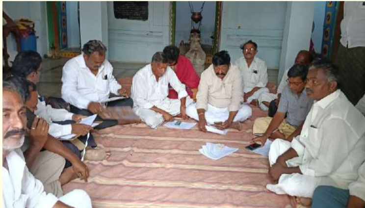
దొర్నిపాడు ఏప్రిల్ 23 పల్లె వెలుగు న్యూస్

వేలం పాటలు నిర్వహిస్తున్న దేవదాయ అధికారులు