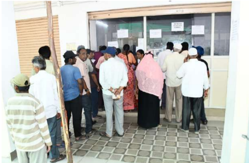
రూ.16.86 కోట్లు దాటిన వసూళ్లు ముందస్తు చెల్లింపులపై 5% రాయితీకి ఆదరణ