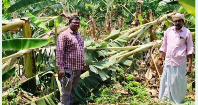
మహానంది, పల్లె వెలుగు

మహానంది మండలంలో బుధవారం సాయంత్రం. ఈదురు గాలులతో కురిసిన వర్షానికి 51 హెక్టార్లలో అరటిపంట దెబ్బతిన్నట్లు ఉద్యానశాఖ అధికారి బి. హరేంద్ర తెలిపారు. గురువారం మండలంలోని తిమ్మాపురం, బుక్కాపురం, తమ్మదపల్లె గ్రామాల్లో ఈదురు దెబ్బతిన్న అరటి తోటలను పరిశీలించారు. మండలంలో 51 హెక్టార్ల విస్తీర్ణంలో అరటి పంట దెబ్బతిన్నట్లు ప్రాథమికంగా అంచనా వేయడం జరిగిందన్నారు. ఉన్నతాధికారులకు నివేదికలు పంపుతామన్నారు.