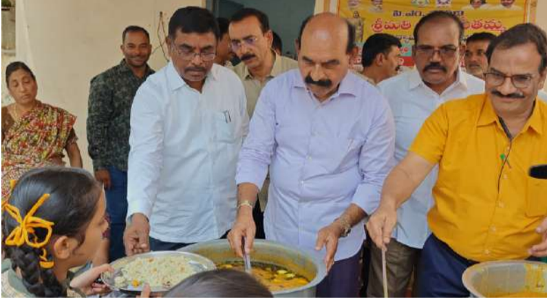
విద్యార్థులతో కలిసి భోజనం చేసిన మంత్రి ఫరూక్.