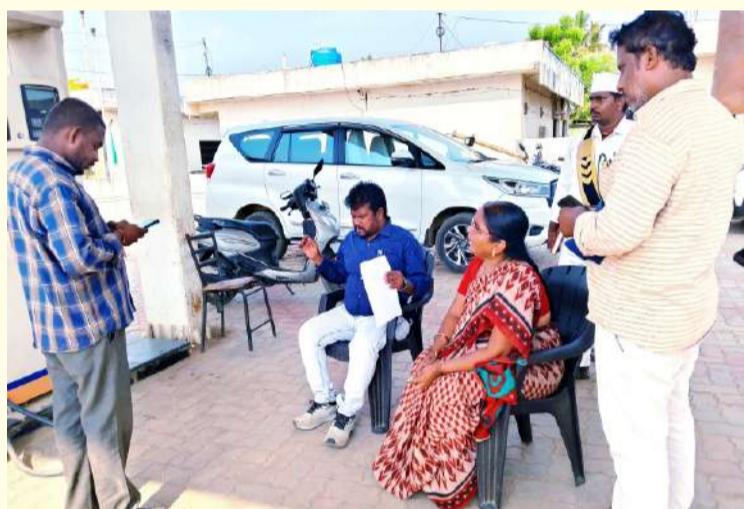
బండి ఆత్మకూరు పల్లె వెలుగు ఏప్రిల్ 23: