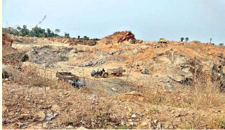
విజయనగరం/జామి, ఏప్రిల్ 23

- గడువు ముగిసినా కొనసాగుతున్న తవ్వకాలు - ప్రభుత్వ ఆదాయానికి గండి - అటువైపు చూడని అధికారులు