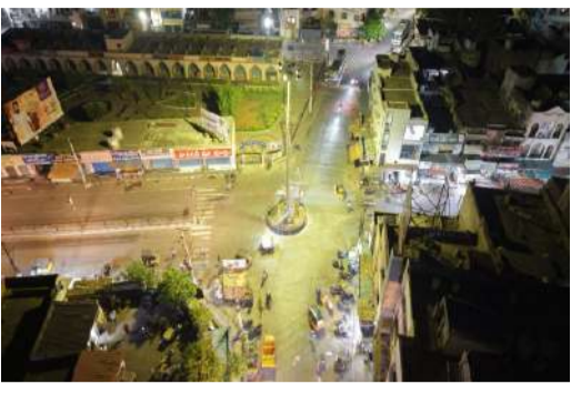
నేరాల నియంత్రణకు ప్రత్యేక చర్యలు.