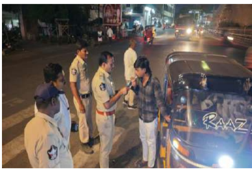
ఫుట్ పత్రోలింగ్, డ్రంక్ లండ్ డ్రైవ్ తనిఖీలు.