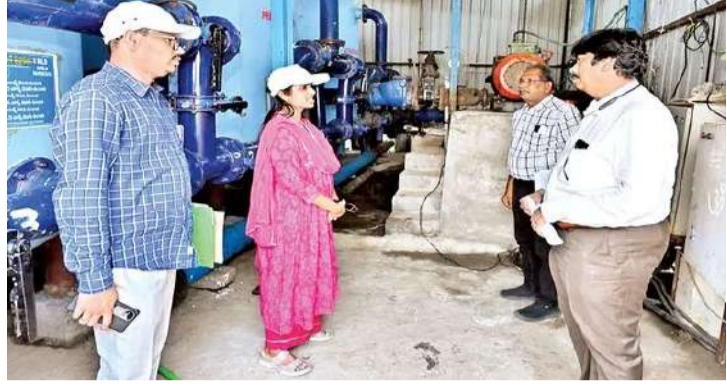
కలెక్టర్ డా.పి. సిరి