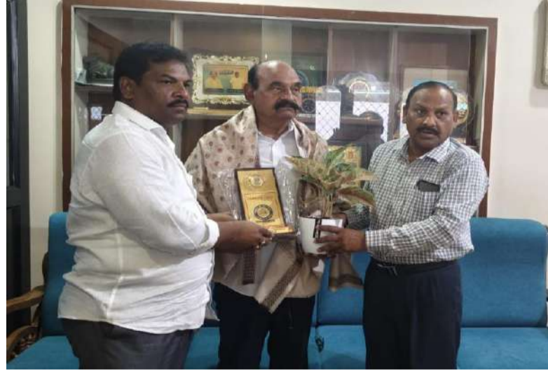
పల్లె వెలుగు నంద్యాల జిల్లా బ్యూరో.