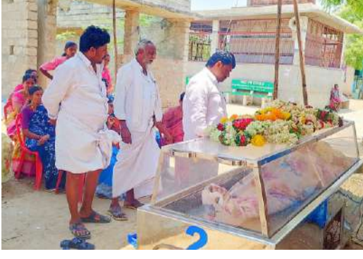
కొనియాడారు. "ఎన్నో రకాల్లోని నిజాయితీ, నిబద్ధతతో పనిచేస్తూ ప్రజా సమస్యలను