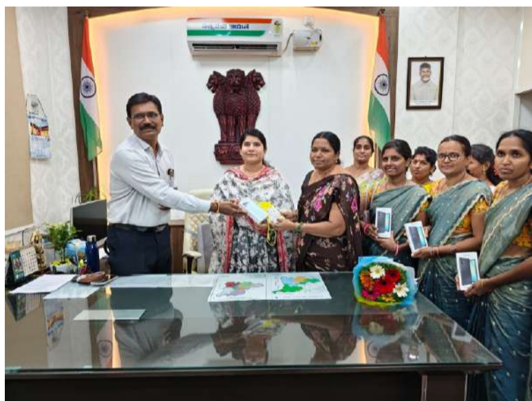
జిల్లాలో 1,086 మంది లబ్ధిదారులకు 5జి ఫోన్లు.