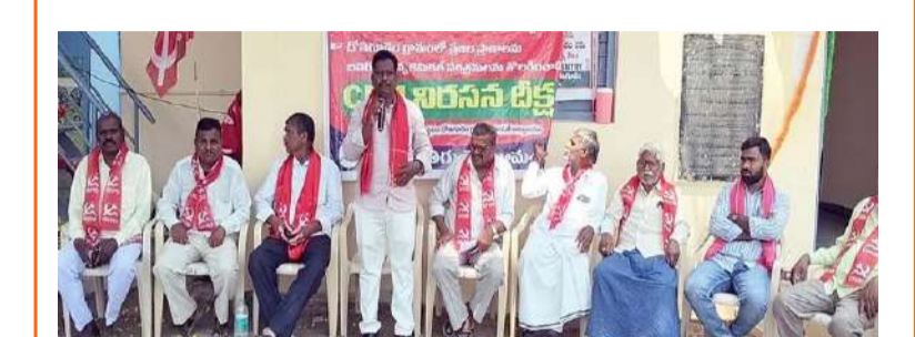
భూదాన్ (పోచంపల్లి, ఏప్రిల్ 21) పల్లె వెలుగు