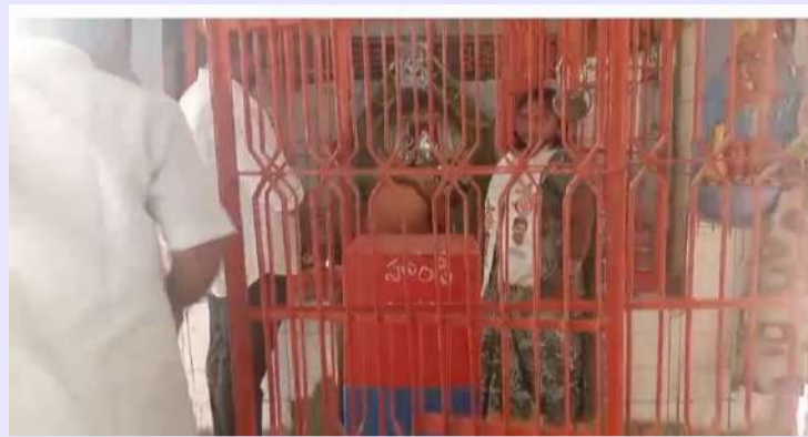
పోరుమామిళ్ల, ఏప్రిల్ 21 (పల్లె వెలుగు)