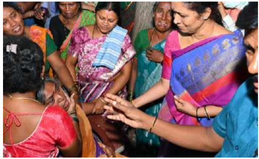
కర్నూలు ప్రభుత్వ ఆసుపత్రి మార్చురీ వద్ద కుటుంబ సభ్యులకు భరోసా - మృతుని కుటుంబానికి ప్రభుత్వ సాయం అందేలా చూస్తామని హామీ