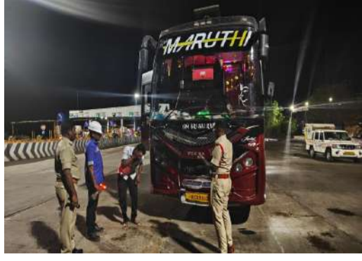
ప్రజల భద్రత లక్ష్యంగా విస్తృత తనిఖీలు.