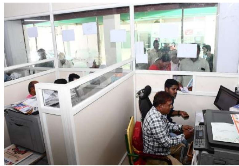
నగరపాలక అదనపు కమిషనర్ ఆర్జివి కృష్ణ