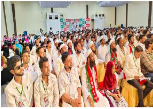
పల్లె వెలుగు నంద్యాల రూరల్.