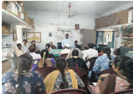
వ్యవసాయ అధికారులకు రెండు రోజుల శిక్షణ కార్యక్రమం.