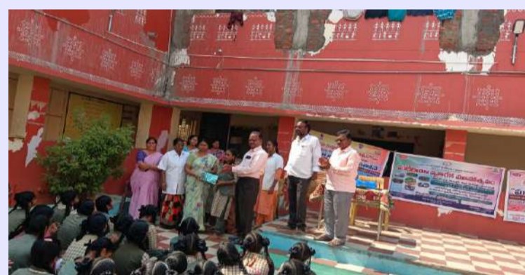
బద్వేల్, ఏప్రిల్ 21 (పల్లె వెలుగు)