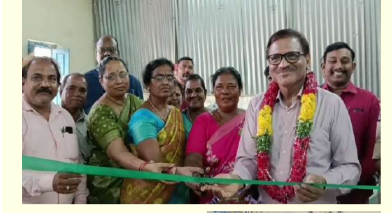
పల్లె వెలుగు కర్నూలు బ్యూరో