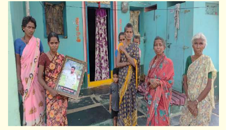
పల్లె వెలుగు కర్నూలు బ్యూరో