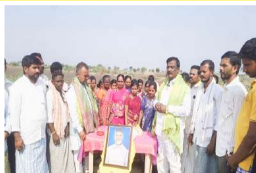
ఉపాధి కూలీలతో చంద్రబాబు జన్మదిన వేడుకలు.