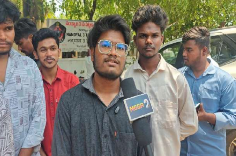
పల్లె వెలుగు నంద్యాల జిల్లా బ్యూరో.

నంద్యాల పట్టణంలోని ప్రముఖ కళాశాలలో డిగ్రీ రెండవ సంవత్సరం చదువుతున్న విద్యార్థులు ప్రభుత్వ పి.యస్.సి&కె.వి.యస్.సి కళాశాల నందు డిగ్రీ రెండవ సంవత్సరం పరీక్షలు రాసేందుకు పరీక్ష కేంద్రం(ఎగ్జామ్స్ సెంటర్)లో విద్యార్థుల మొబైల్ ఫోన్లు అనుమతి లేనందున అందరూ ఒకే కళాశాలకు చెందిన విద్యార్థిని, విద్యార్థులు కావడంతో తమ15 మొబైల్ ఫోన్లు ఒక స్కూటీ డిక్టీలో పెట్టి మూడు గంటలు పరీక్షలు రాసి వచ్చి చూడగా 15