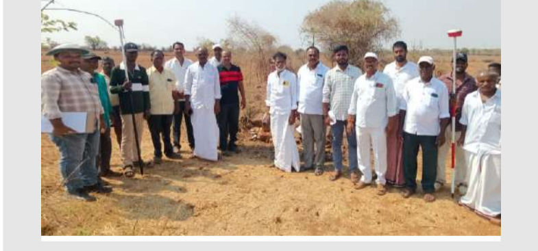
పల్లె వెలుగు -ప్యాపిలి