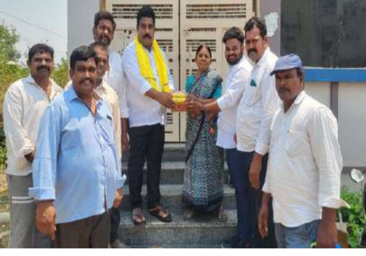
పల్లె వెలుగు నంద్యాల జిల్లా బ్యూరో.