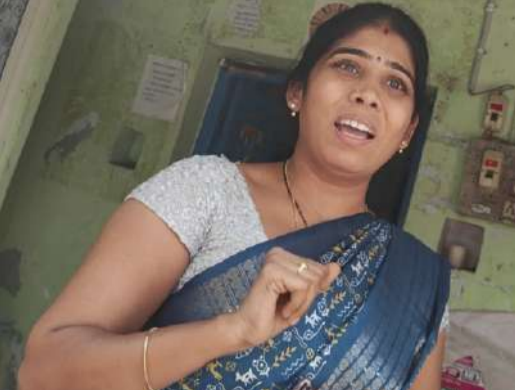
( విలేకరిపై వాదోప వాదనలతో, బెదిరింపులకు గురి చేస్తున్న డేటా ఆపరేటర్ )

నంద్యాల పట్టణంలోని స్థానిక 13 వ వార్డు సచివాలయంలో పట్టపగలే డేటా ఆపరేటర్ కొనుక్కుతిస్తుంది. వివరాల్లోకి వెళితే శిల్పా సహకార్ బ్యాంకు ఎదురుగా ఉన్న టోక్నే నందు 13వ వార్డు సచివాలయము అధికారులు ఏర్పాటు చేశారు. 13వ వార్డు సచివాలయంలో డేటా ఆపరేటర్ భోజన అనంతరం మధ్యాహ్నం సుమారు రెండు గంటల సమయంలో టేబుల్ పైనే కునుకుతిస్తు కెమెరాకు