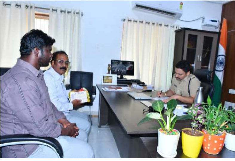
విచారణ జరిపి ఫిర్యాదుదారులకు చట్ట పరిధిలో న్యాయం చేస్తాం.