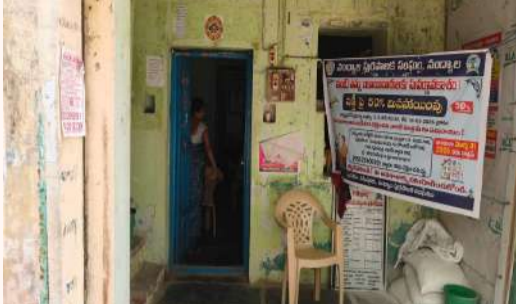
(13వ వార్డు సచివాలయం )

వికారు. ఒక బాధ్యత గల అధికారి మధ్యాహ్నం రెండు గంటల సమయంలోనే భోజనం అనంతరం కునుకు తీయడం ఏమిటి అని ప్రజలు ముక్కున వేలు వేసుకుంటున్నారు. సచివాలయములు తనిఖీ చేయవలసిన అధికారుల అలసత్వంతోనే సచివాలయాల కార్యాలయంలో సచివాలయ సిబ్బంది ఇష్టానుసారముగా రాకపోకలతో పాటు మధ్యాహ్నము రెండు గంటలకు భోజన అనంతరం సచివాలయాన్ని గెస్ట్ హౌస్ మాదిరి కార్యాలయాన్ని ఏర్పాటు చేసుకోని కునుకు తీస్తున్నట్లు విమర్శలున్నాయి. ఏదేమైనా