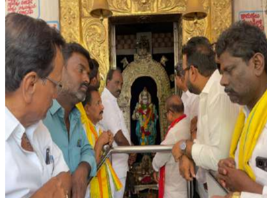
ఆంధ్రప్రదేశ్ ముఖ్యమంత్రి నారా చంద్రబాబు నాయుడు గారి జన్మదినం సందర్భంగా ప్రత్యేక సేవా కార్యక్రమాల నిర్వహించబడినాయి.