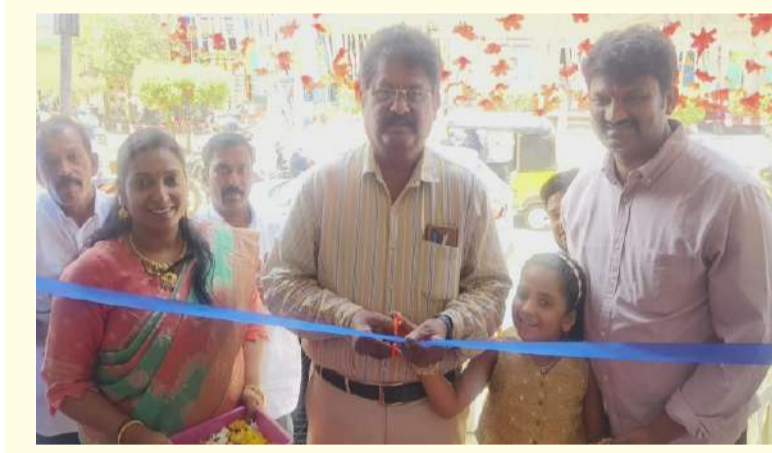
పల్లె వెలుగు నంద్యాల జిల్లా బ్యూరో.