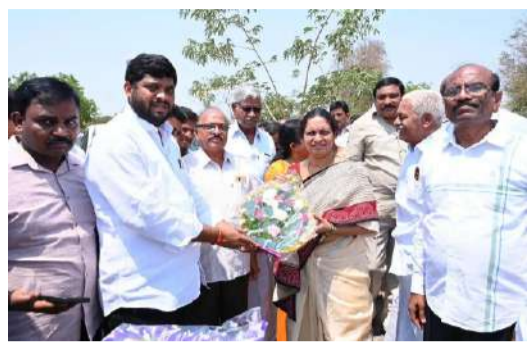
గడివేముల పల్లె వెలుగు దినపత్రిక