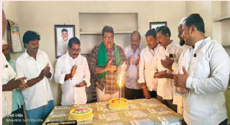
పాణ్యం ఏప్రిల్ 20 పల్లె వెలుగు :