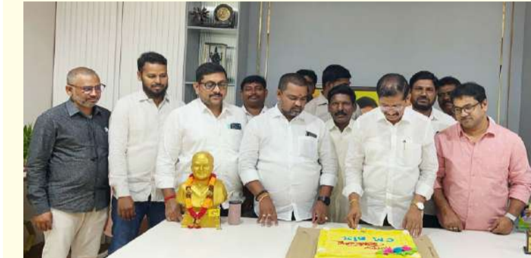
పల్లె వెలుగు కర్నూలు బ్యూరో

...కేక్ కట్ చేసి సీ.ఎం కి విషెస్ తెలిపిన ఎంపీ నాగరాజు