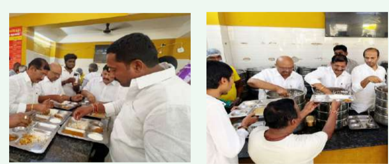
పల్లె వెలుగు కర్నూలు బ్యూరో