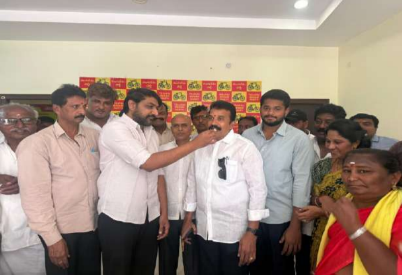
పల్లె వెలుగు నంద్యాల జిల్లా బ్యూరో.