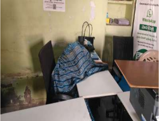
(మధ్యాహ్నం సుమారు రెండు గంటల సమయంలో కార్యాలయంలో కునుకు తిస్తున్న డేటా ఆపరేటర్ )