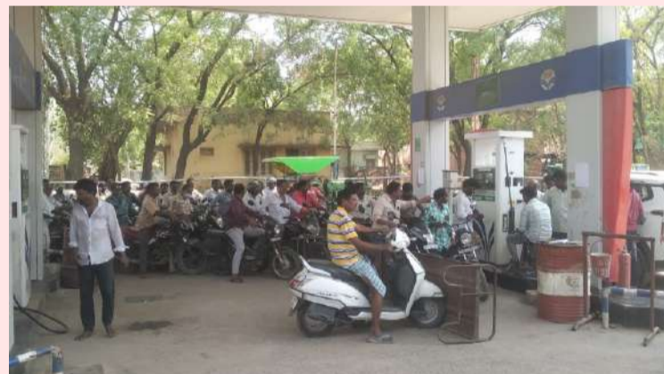
పోరుమామిళ్ల ఏప్రిల్ 20 ( పల్లె వెలుగు)

వైయస్సార్ కడప జిల్లా పోరుమామిళ్ల పట్టణంలో పెట్రోల్ కొరత రోజురోజుకు తీవ్రంగా మారుతోంది. రెండు రోజులుగా పెట్రోల్ బంకుల్లో సరఫరా సరిగా లేకపోవడంతో వాహనదారులు, ప్రయాణికులు తీవ్ర ఇబ్బందులు ఎదుర్కొంటున్నారు. అత్యుపసర వసుల కోసం బయటకు వెళ్లాలని వారు కూడా బంకుల వద్ద గంటల తరబడి వేచి ఉండాల్సి పరిస్థితి ఏర్పడింది. పట్టణంలోని ఎన్ఆర్ పెట్రోల్ పంపుల్లో ఆవైస్ సమస్య కారణంగా ఇంధన సరఫరా నిలిచిపోయింది యాజమాన్యం చెబుతోంది. మరోవైపు హెచ్చీ పెట్రోల్ పంప్ లో ఘర్షణ సాక్ లేకపోవడంతో వాహనదారులు నిరాశతో వెనుదిరుగుతున్నారు. “ఇవాళ వస్తుంది రేపు వస్తుంది” అంటూ పంప్ యాజమాన్యం చెబుతున్నప్పటికీ, పరిస్థితిలో మాత్రం మార్పు కనిపించడంలేదని ప్రజలు ఆవేదన వ్యక్తం చేస్తున్నారు. కొంతమంది అయితే ఇతర ప్రాంతాలకు వెళ్లి ఇంధనం తీసుకురావాలని పరిస్థితి ఏర్పడింది. ఈ కొరత ప్రభావం రవాణాపై కూడా పడుతోంది. పాల ఆటోలు, బైక్లు, కార్లు నడవకపోవడంతో విద్యార్థులు, ఉద్యోగులు తమ గమ్యస్థానాలకు చేరుకోవడంలో ఇబ్బందులు పడుతున్నారు. ఇంధన సరఫరా ఎప్పుడు సాధారణ స్థితికి వస్తుందో స్పష్టత లేకపోవడంతో ప్రజల్లో ఆందోళన నెలకొంది. అధికారులు వెంటనే స్పందించి సమస్యను పరిష్కరించాలని స్థానికులు కోరుతున్నారు.