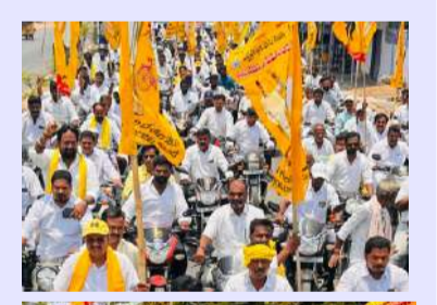
ఎమ్మిగనూరు పల్లె వెలుగు ఏప్రిల్ 20