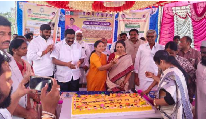
జొన్న రైతులు దళారులను సమ్మి మోసపోవద్దు