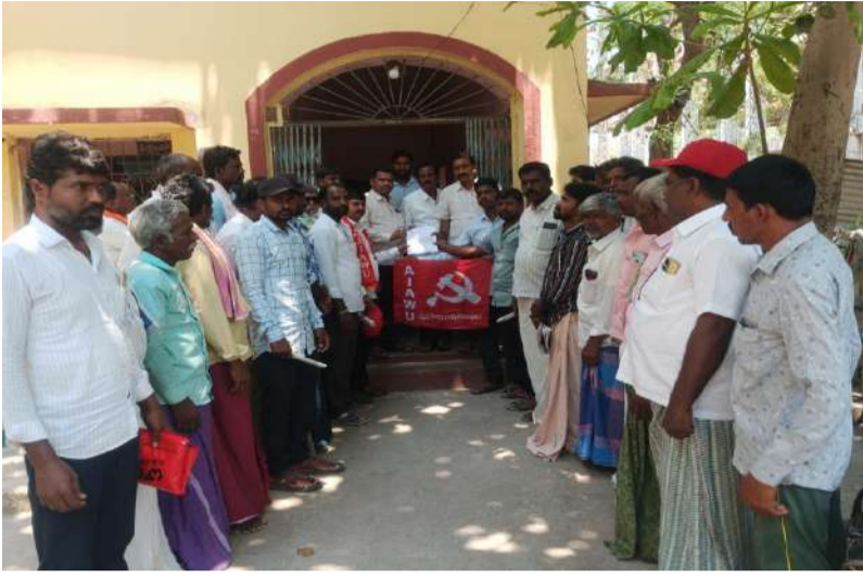
పాత ఉపాధి హామీ చట్టాన్ని అమలు చేయాలని కోరుతూ ఎంపిడిఓ కార్యాలయం ముందు ధర్నా