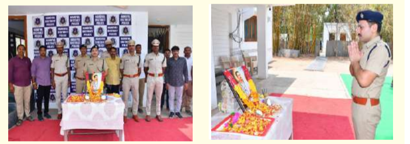
పల్లె వెలుగు సంద్యాల క్రైమ్.