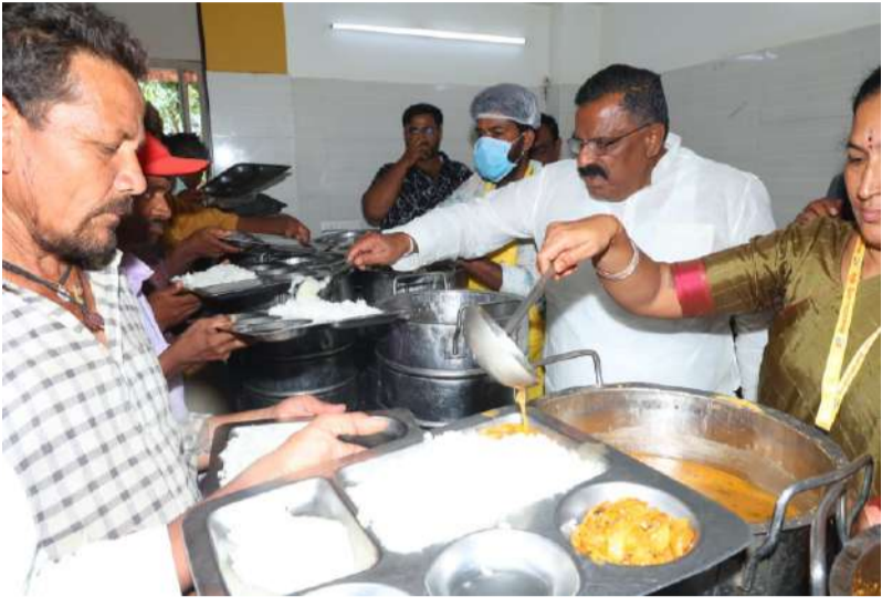
పల్లె వెలుగు - డోన్