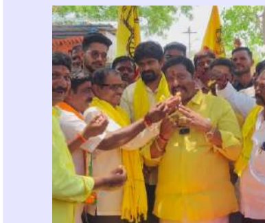
కోసిగి, ఏప్రిల్ - 20 (పల్లెవెలుగు):