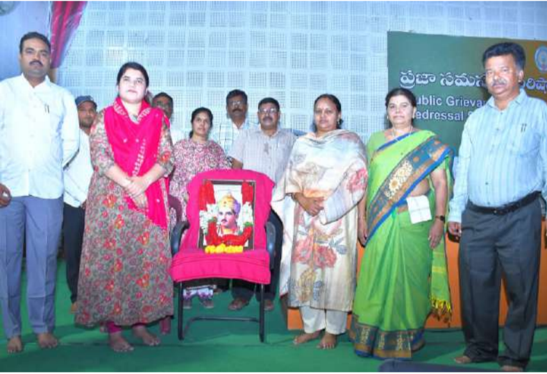
సామ్రాజ్యత్వం, సమానత్వం కోసం బసవేశ్వరుల బోధనలు. కలెక్టరేట్లో బసవేశ్వరుల 893వ జయంతి వేడుకలు.