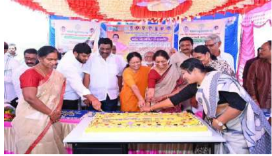
గడివేముల పల్లె వెలుగు దిన పత్రిక