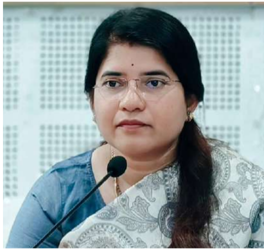
మధ్యాహ్నం 1:00 గంటల వరకు నిర్వహిస్తున్నట్లు కలెక్టర్ తెలిపారు. ప్రజలు తమ అర్జులను ప్రత్యక్షంగా

జిల్లా వ్యాప్తంగా ప్రజల సమస్యలను వేగవంతంగా పరిష్కరించేందుకు ఈ నెల 20వ తేదీ (సోమవారం)న ప్రజా సమస్యల పరిష్కార వేదిక నిర్వహించనున్నట్లు జిల్లా కలెక్టర్ జి. రాజకుమారి ఆదివారం ఒక ప్రకటనలో తెలిపారు. ఈ కార్యక్రమం సంద్యాల జిల్లా కలెక్టరేట్లో పాటు అన్ని డివిజన్, మండల కేంద్రాలు మరియు మున్సిపల్ కార్యాలయాల్లో ఒకేసారి నిర్వహించబడుతుందన్నారు. వేసవి ఉష్ణోగ్రతలను దృష్టిలో ఉంచుకుని కార్యక్రమాన్ని ఉదయం 9:30 గంటల నుంచి