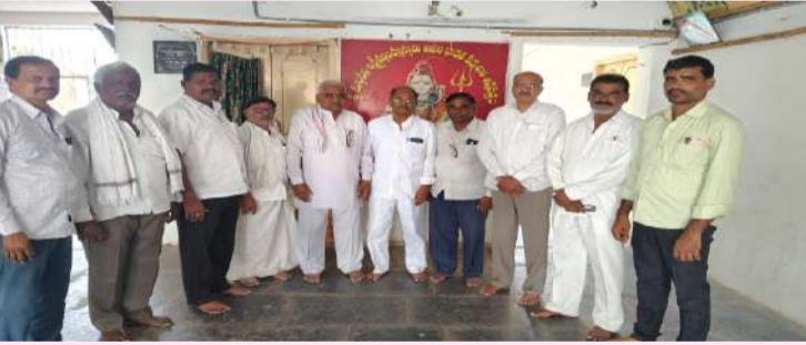
మట్టపల్లి ఏప్రిల్ 19 పల్లె వెలుగు