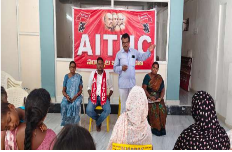
ప్రభుత్వ పాఠశాలల్లో ఖాళీగా ఉన్న స్కూల్ ఆయా, స్వీపర్ పోస్టులను భర్తీ చేయాలి. ఆయాలకు, స్వీపర్స్ కు పని భారం తగ్గించాలి, రాజకీయ వేధింపులు ఆపాలి.