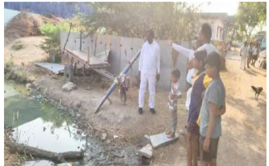
సిసి రోడ్ డ్రైనేజీ పనులను పరిశీలించిన కురువ కార్పొరేషన్ చైర్మన్.