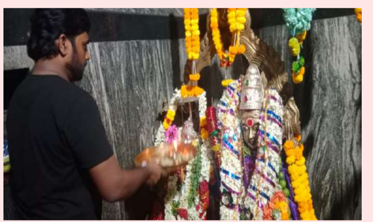
దొర్నపాడు ఏప్రిల్ 19 పల్లె వెలుగు న్యూస్

ప్రజలు కోర్ కోరికలు తీరుస్తూ కష్టాల నుండి గట్టెక్కించే అమ్మలగన్న అమ్మ మూల పెద్దమ్మకు నిత్యం పూజలు అందుకుంటూ ప్రజలకు దర్శనమిస్తుంది, దొర్నపాడు మండలంలోని గోవింద దేవ్ గ్రామంలో సాష్టాంగంగా కొలువై కొలిచేవారికి కొంగుబంగారంగా బానిస్సులూ నిత్యం పూజల లో భాగంగా ఆదివారం , శుక్రవారం మంగళవారం , మూడు దినాలలో అమ్మవారిని కొలిచేందుకు వివిధ జిల్లాల, రాష్ట్రాల నుండి అత్యధిక సంఖ్యలో భక్తులు వచ్చి అమ్మవారికి ధూప దీప నైవేద్యాలను సమర్పించి పూజలు నిర్వహిస్తుంటారు. భక్తులకు గ్రామానికి చెందిన అమ్మవారి భక్తులు పూజారులైన బోయలు తీర్థ ప్రసాదము సమర్పించి అమ్మవారి కరుణా కటాక్షం కలగాలని వారు కోరుతారు.