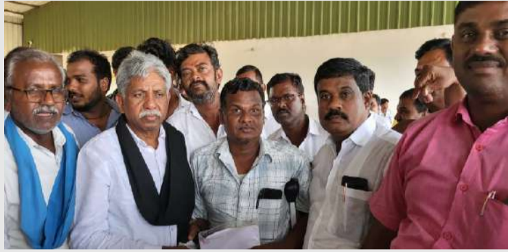
పల్లె వెలుగు సంస్థానం జిల్లా బ్యూరో.