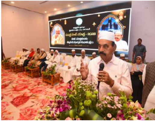
రాజకీయ కక్షతో నిధుల నిలిపివేత సొంత జిల్లాలో హజీ భవన్ ను పూర్తి చేయలేదని ద్వజమెత్తిన మంత్రి ఫరూక్ రెండవ విడతలో 177 మంది హజీ యాత్రకు జెండా ఊపి వీడ్కోలు పలికిన మైనారిటీల మంత్రి ఫరూక్ విజయవంతంగా హజీ యాత్రను పూర్తి చేసి రావాలని శుభాకాంక్షలు తెలిపిన మంత్రి ఫరూక్ ప్రభుత్వ శాఖల అధికారులకు, సిబ్బందికి, మీడియాకు కృతజ్ఞతలు తెలిపిన మంత్రి