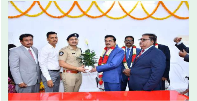
పల్లె వెలుగు నంద్యాల జిల్లా బ్యూరో.