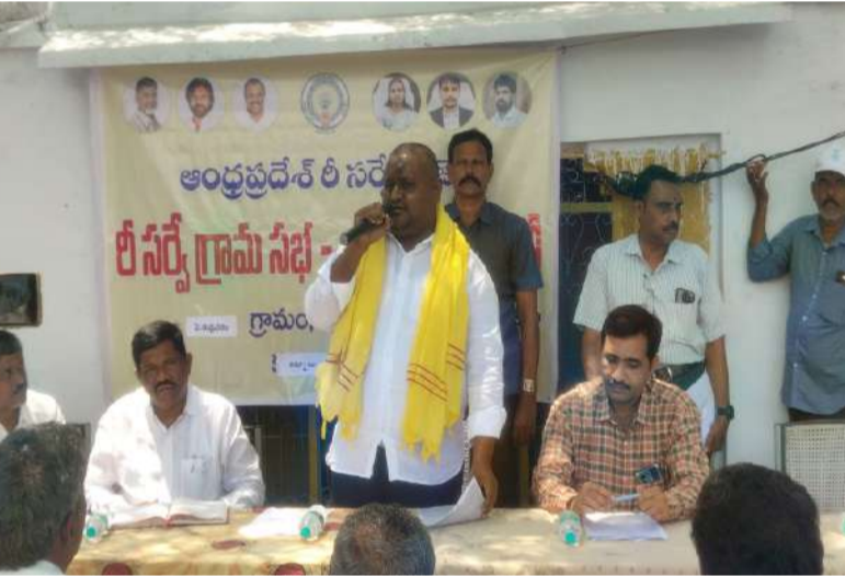
కోడుమూరు ఎమ్మెల్యే బొగ్గల దస్తగిరి