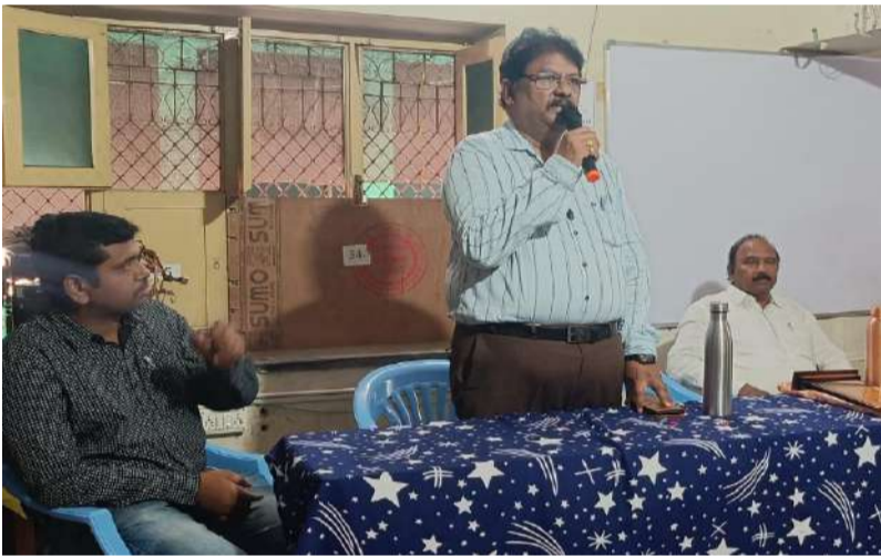
నేషనల్ కంప్యూటర్స్ లో విద్యార్థి వ్యక్తిత్వ వికాస కార్యక్రమం.