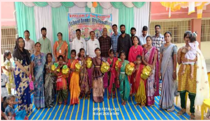
హోళగుండ్ పల్లె వెలుగు ఏప్రిల్ 18

స్థానిక మండల పరిషత్ ప్రాథమిక పాఠశాల, 10వ వార్షికోత్సవ యాన్యువల్ డే కార్యక్రమం శుక్రవారం ఘనంగా నిర్వహించబడింది. ఈ సందర్భంగా సరస్వతి పూజను నిర్వహించి కార్యక్రమాన్ని ఆధ్యాత్మిక వాతావరణంలో ప్రారంభించారు. ఈ కార్యక్రమానికి మండల విద్యార్థి కార్యకర్తలు, జిల్లా పరిషత్ ఉన్నత పాఠశాల ఉపాధ్యాయులు, ఎలఆర్సీ సిబ్బంది హాజరై విద్యార్థులను ప్రోత్సహించారు. చిన్నారులు తమ ఆటపాటలు, సాంస్కృతిక కార్యక్రమాలతో అందరినీ ఆకట్టుకుని మేడుకలకు ప్రత్యేక ఆకర్షణగా నిలిచారు. ఈ సందర్భంగా మండల విద్యార్థి కార్యకర్తలు మాట్లాడుతూ, విద్యార్థులు క్రమశిక్షణతో చదువుకుని ఉన్నత లక్ష్యాలను సాధించాలని సూచించారు. ప్రతిరోజూ పాఠశాలకు హాజరవుతూ మంచి విద్యను అలవర్చుకోవాలని, ప్రభుత్వ పాఠశాలలో నాణ్యమైన విద్యతోపాటు పలు ఉచిత సదుపాయాలు అందుబాటులో ఉన్నాయని తెలిపారు. కార్యక్రమం ముగింపులో మండల విద్యాధికారి అధికారులను పాఠశాల ప్రధానోపాధ్యాయుడు, ఉపాధ్యాయులు కలిసి పాఠశాల తరఫున ఘనంగా సత్కరించారు.