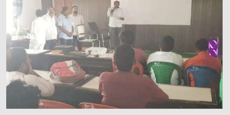
పల్లె వెలుగు బేతంచెర్ల ప్రతినిధి (ఏప్రిల్ 18):-