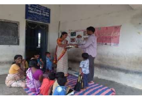
పల్లె వెలుగు నంద్యాల జిల్లా బ్యారో.

ఎండలు ముందుతున్నాయి. గ్రామాల్లో ప్రజలు బయటకువచ్చేందుకు జంకుతున్నారు. వేసవి కారణంగా అంగన్ వాడీ కేంద్రాలకు వచ్చే చిన్నారుల హాజరు శాతం తగ్గింది. చెర్రబూతూర్ అంగన్ వాడీ కేంద్రలో పౌష్టికాహారం పంపిణీ చేస్తున్న అంగన్ వాడీ టీచర్ ఎండలు ముందుతున్నాయి. గ్రామాల్లో ప్రజలు బయటకువచ్చేందుకు జంకుతున్నారు. వేసవి కారణంగా అంగన్ వాడీ కేంద్రాలకు వచ్చే చిన్నారుల హాజరు శాతం తగ్గింది. గర్భిణిలు, బాలింతలు తప్ప అంగన్ వాడీ కేంద్రాలకు ఎవ్వరూ రావడం లేదు. దీనిని దృష్టిలో ఉంచుకుని ప్రభుత్వం లబ్ధిదారులకు అంగన్ వాడీ సరుకులు ఇంటికే పంపించాలని నిర్ణయించింది. మే 1 నుంచి 31వ తేదీ వరకు ఈ విధానాన్ని అమలు చేయనున్నారు. జూన్ 1 నుంచి యథావిధిగా కేంద్రాలను ప్రారంభించనున్నారు. కరీంనగర్ అర్బన్ పరదిలో 107, కరీంనగర్ రూరల్ మండలంలో 19 అంగన్ వాడీ కేంద్రాలు ఉన్నాయి. అంగన్ వాడీ కేంద్రాల్లో బాలింతలు, గర్భిణులు, చిన్నారులకు ప్రతీ రోజు ఉడకబెట్టిన గుడ్లు, బాలామృతం, పాలు, మురుకులు, అన్నం వస్తుతో కూడిన పోషకాహారం అందిస్తారు. ప్రస్తుతం ఎండలు తీవ్రస్థాయికి చేరుకున్నాయి.