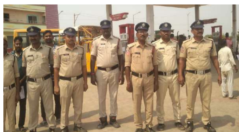
పోరుమామిళ్ల ఏప్రిల్ 18 (పల్లె వెలుగు)

వైయస్సార్ కడప జిల్లా పోరుమామిళ్ల పట్టణంలోని అగ్నిమాపక కేంద్రం ఆధ్వర్యంలో నిర్వహిస్తున్న అగ్నిమాపక వారోత్సవాల్లో భాగంగా 5వ రోజు ఫైర్ సేఫ్టీ అవగాహన కార్యక్రమం పట్టణంలోని ఎస్సార్ పెట్రోల్ పంపు వద్ద నిర్వహించారు. ఈ సందర్భంగా పెట్రోల్ బంక్ పరిసరాల్లో అగ్ని ప్రమాదాలు సంభవించినప్పుడు ఎలా స్పందించాలి, వాటిని ఎలా నియంత్రించాలి అనే అంశాలపై ప్రత్యేక ప్రదర్శన (డెమో) ఇచ్చారు. పెట్రోల్, డీజిల్ వంటి సులభంగా మంటలు వ్యాపించే పదార్థాల అగ్ని ప్రమాదాలను సాధారణ నీటితో ఆర్పడం ప్రమాదకరమని, ఫోమ్ ఆధారిత ఫైర్ ఎక్స్టింగ్విషర్లను ఉపయోగించడం