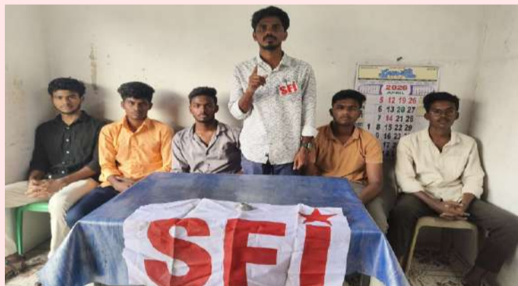
ఆదోని (పల్లె వెలుగు):

ఫీజు కట్టలేదని విద్యార్థులను ఇంటికి పంపించిన యాజమాన్యం.