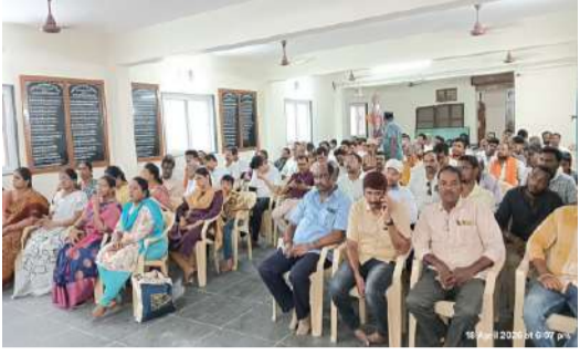
నంద్యాల ప్రతినిధి, ఏప్రిల్ 18 (పల్లె వెలుగు):

మహారాష్ట్ర రాష్ట్రంలోని నాసిక్ లో ఉన్న సాఫ్ట్వేర్ కంపెనీలో లవ్ జిహాద్ పేరుతో వ్యవస్థీకృతంగా హిందూ అమ్మాయిలని టార్గెట్ చేసుకొని మతమార్పిడులు చేసిన సంఘటన భారతదేశంలోని హిందూ సమాజాన్ని కుదిపివేసింది. ఈ సందర్భంగా విహెచ్ పీ నంద్యాల నగరంలో నిరసన ప్రదర్శన చేస్తూ డిఎస్పీ కి వినతి పత్రం