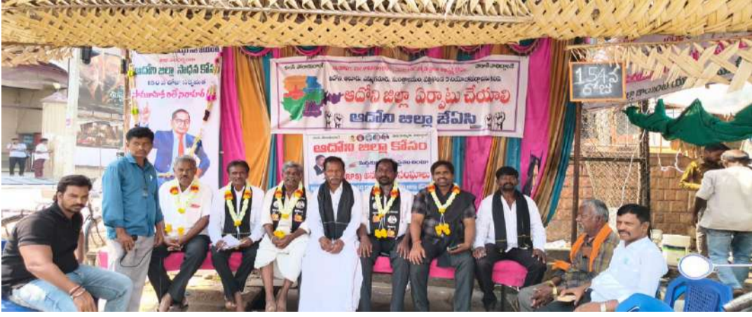
ఆదోని జిల్లా సాధన జె.ఏ.సి నాయకుల నిలదీత.