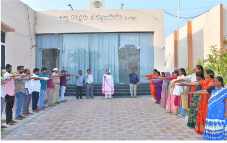
పల్లె వెలుగు నంద్యాల జిల్లా బ్యూరో.