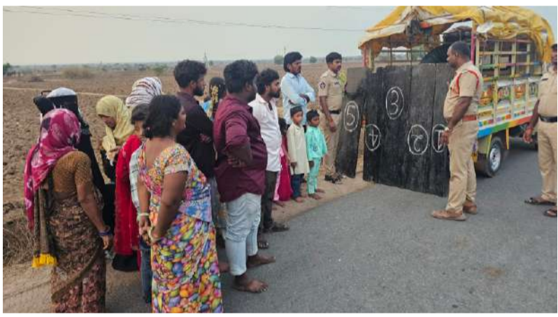
హోళగుండ పల్లె వెలుగు ఏప్రిల్ 18