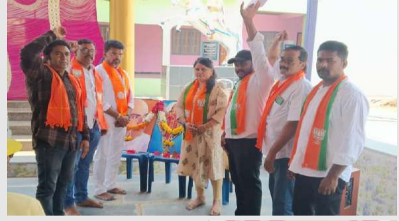
మహానంది, పల్లె వెలుగు