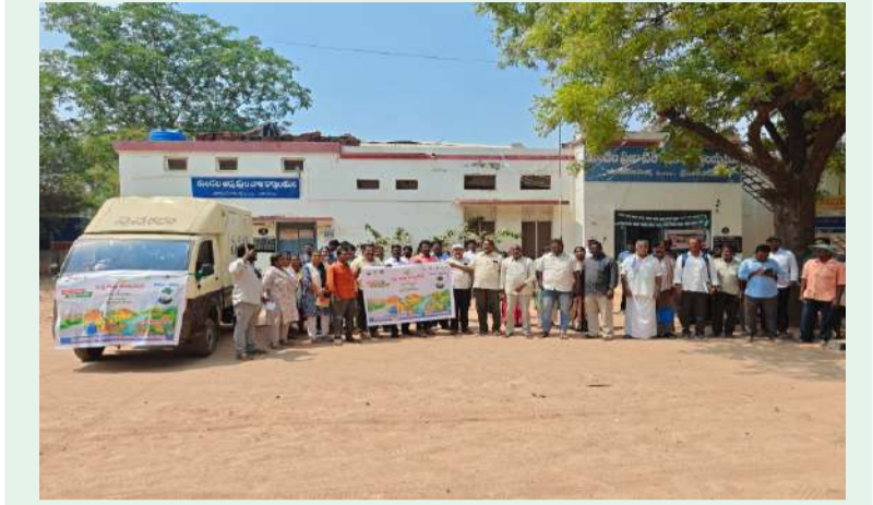
పొరుమామిళ్ల : ఏప్రిల్ 18 (పల్లె వెలుగు)