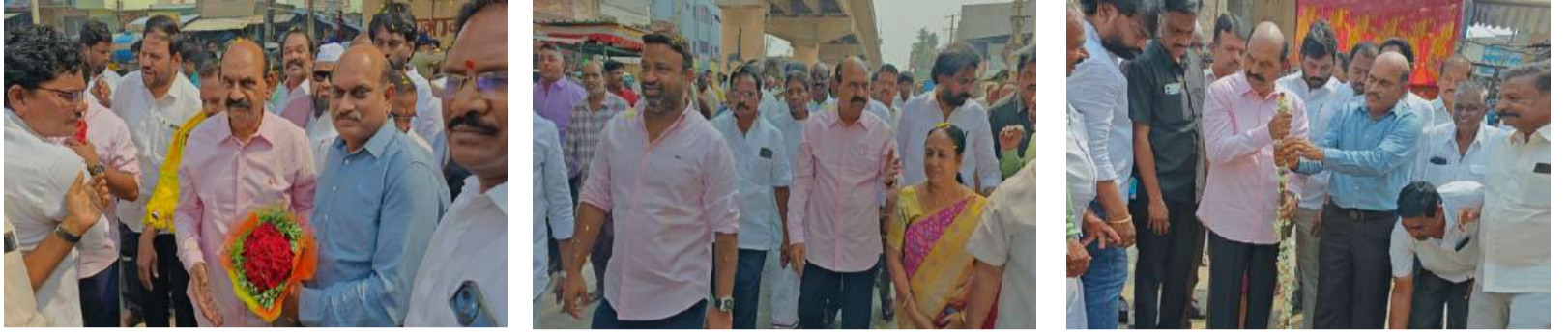
పల్లె వెలుగు సంస్కార జిల్లా బ్యూరో.