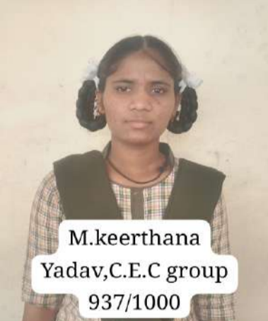
పల్లెవెలుగు బేతంచెర్ల ప్రతినధి (ఏప్రిల్ 15) :-