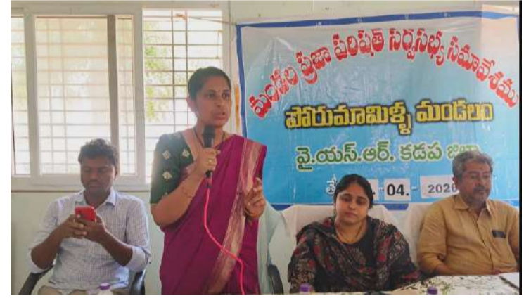
పోరుమామిళ్ళ ఏప్రిల్ 15 (పల్లె వెలుగు)