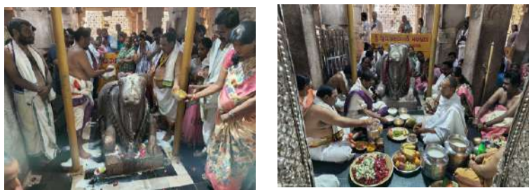
మహానంది, పల్లె వెలుగు

మహానంది పుణ్యక్షేత్రంలో వెలసిన నందిశ్వరునికి వేద పండితులు ప్రదానకాలంలో విశేష అభిషేకాలు, అర్చనల పూజలను వేదోక్తంగా చేశారు. బుధవారం చైత్ర బహుళ త్రయోదశి నంది ప్రదానం సందర్భంగా దేవస్థానం అధికారుల పర్యవేక్షణలో విశేషాభిషేకాలను భక్తిశ్రద్ధలతో ఘనంగా నిర్వహించారు. ఈ క్రమంలోనే గణపతిపూజ, ఆరాధన, ద్రవ్య పూజ పీఠార్చన, గంధం, పలురకాల చూర్ణాలతో అభిషేకించారు. భక్తులు అధిక సంఖ్యలో పాల్గొని స్వామివారిని దర్శించుకున్నారు.