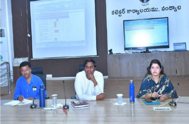
జిల్లా కలెక్టర్ జి.రాజకుమారి.