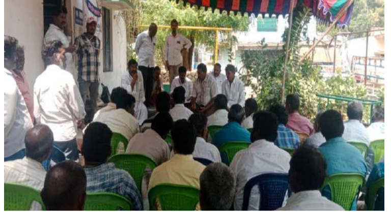
వేలంపాటలు నిర్వహిస్తున్న అధికారులు