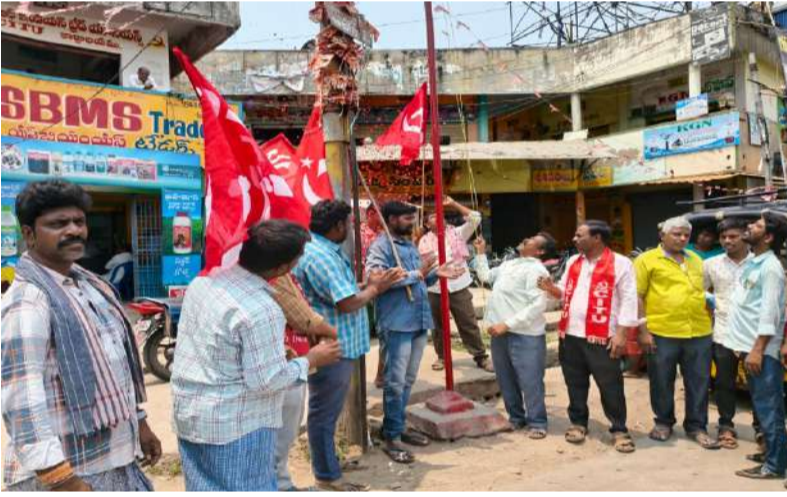
కార్మికుల హక్కుల రక్షణ కోసం నంద్యాలలో మహాసభలు నిలిపాయి.