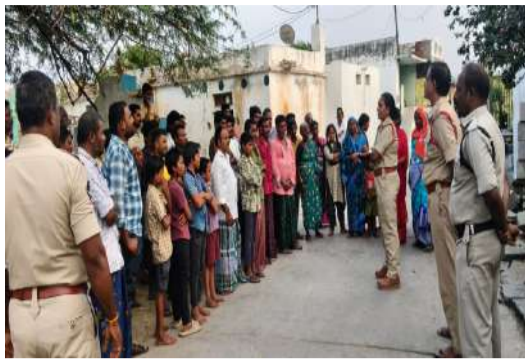
నేర నియంతరణ, ప్రజల భద్రతకు భరోసా. రోడ్డు ప్రమాదాలపై అవగాహన... నిబంధనలు ఉల్లంఘించిన వారిపై జరిమాన.