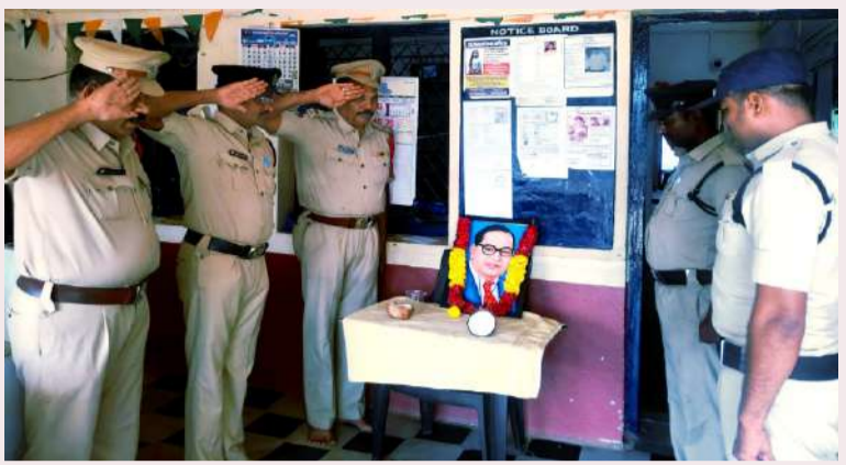
బండి ఆత్మకూరు పల్లె వెలుగు ఏప్రిల్ 14: