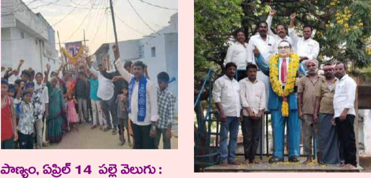
పాణ్యం, ఏప్రిల్ 14 పల్లె వెలుగు :