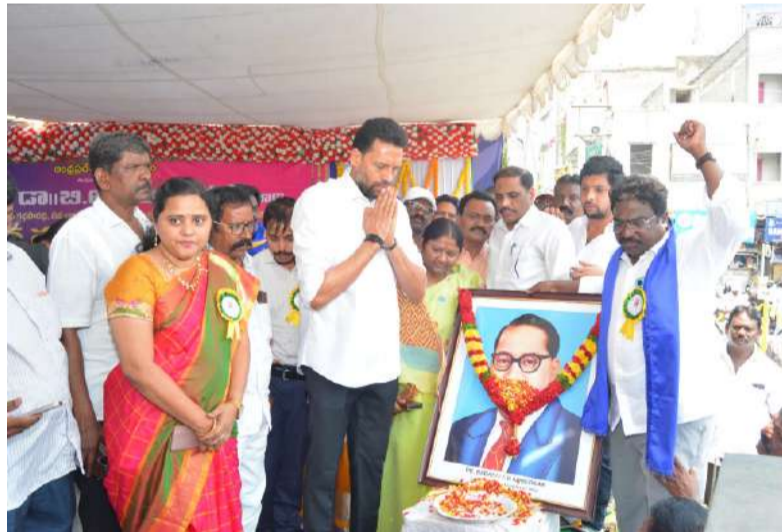
కర్నూలులో ఘనంగా డాక్టర్ బి.ఆర్. అంబేద్కర్ జయంతి వేడుకలు అంబేద్కర్ విగ్రహానికి పూలమాలలు వేసి నివాళులర్పించిన మంత్రి, ఎంపీ, జేపీ ఓర్వకల్లు పారిశ్రామికాభివృద్ధితో యువతకు ఉపాధి అవకాశాలు