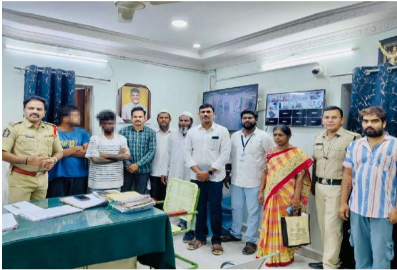
పల్లె వెలుగు కర్నూలు బ్యూరో