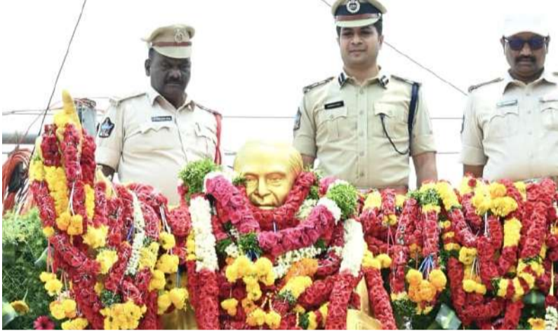
పాత బస్టాండ్ వద్ద బాబాసాహెబ్ విగ్రహానికి ఎస్సీ ఘన నివాళి