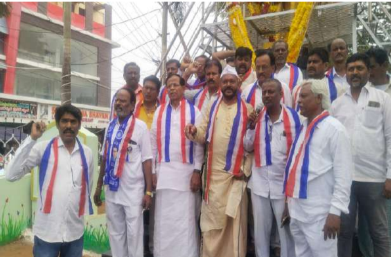
జి.సి.ఫెడరేషన్ ఆధ్వర్యంలో డాక్టర్ బి.ఆర్ అంబేద్కర్ 135వ జయంతి వేడుకలు.