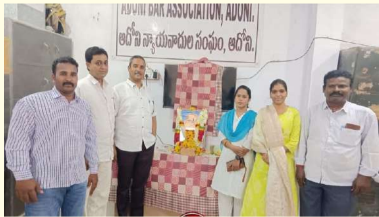
ఆదోని బాల్ అసోసియేషన్ ఆధ్వర్యంలో ఘనంగా అంబేద్కర్ జయంతి వేడుకలు.