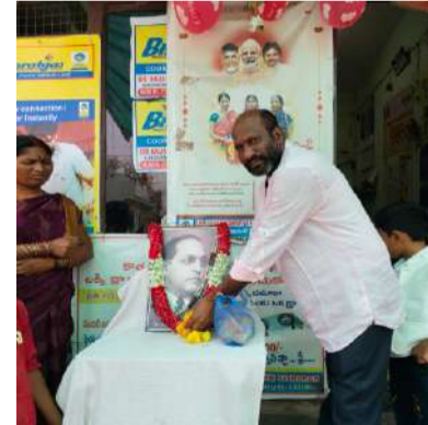
గడివేముల పల్లె వెలుగు దినపత్రిక