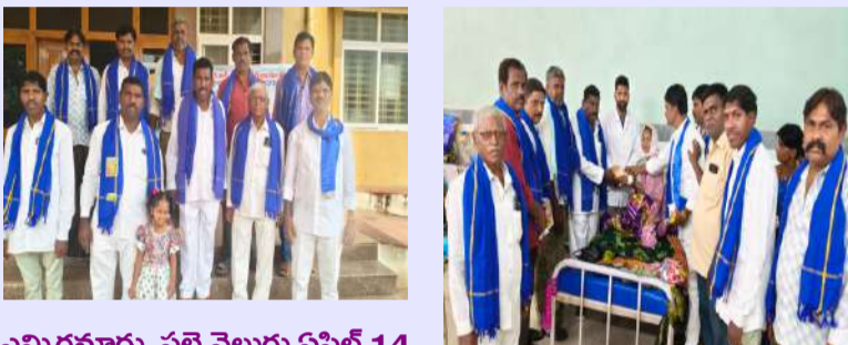
ఎమ్మిగనూరు పల్లె వెలుగు ఏప్రిల్ 14