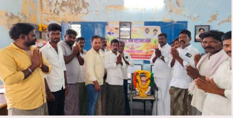
నందవరం పల్లె వెలుగు ఏప్రిల్ 14