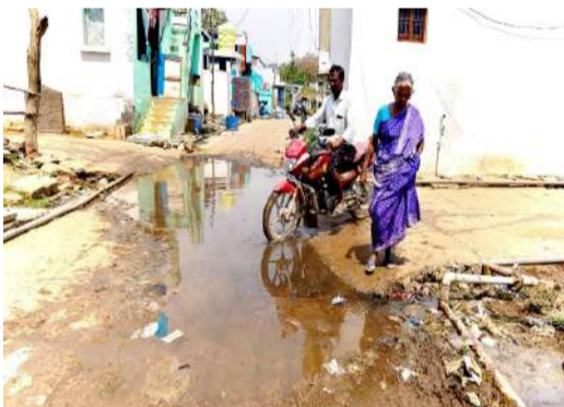
మహానంది, పల్లె వెలుగు

మహానంది మండలం గాజులపల్లె గ్రామంలోని చాకలి పేట వద్ద డ్రైనేజీ వ్యవస్థ అస్తివ్యస్తంగా మారింది. దీంతో మురుగునీటి కాలువల్లో పారలేక రోడ్డుపై ప్రవహిస్తోంది. దీంతో రోడ్లంతా దుర్వాస వెదజల్లుతోందని గ్రామస్థులు వాపోతున్నారు. మురుగు నీరు ఎక్కడికక్కడ నిలిచిపోయింది. స్పందనలో ఫిర్యాదు చేసిన అధికారులు స్పందించడం లేదన్నారు. అధికారులు మాత్రం తమ కార్యాలయాలకు పరిమితమయ్యారని