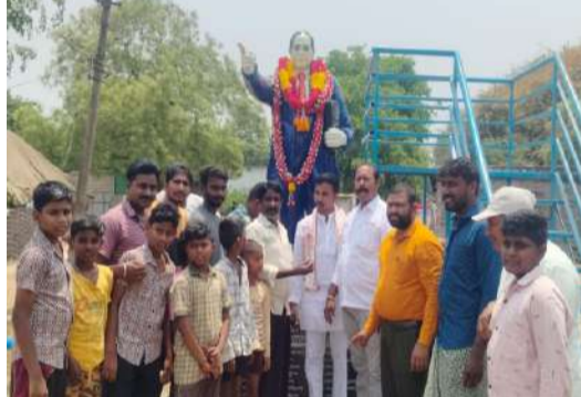
మహానంది, పల్లె వెలుగు