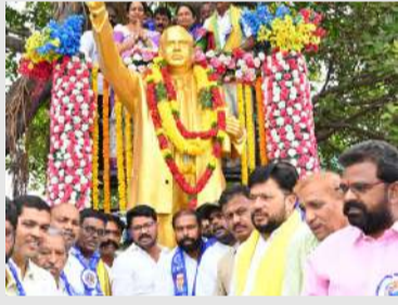
పల్లె వెలుగు కర్నూలు బ్యూరో