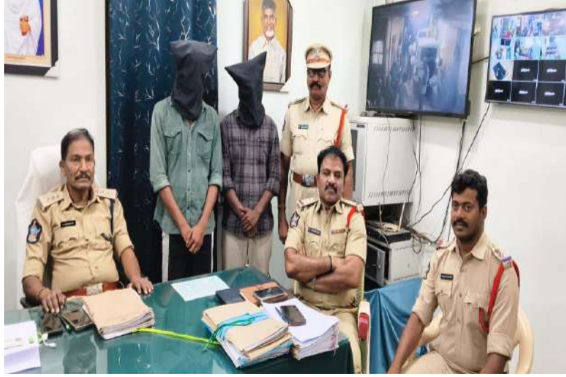
పల్లె వెలుగు కర్నూలు బ్యూరో