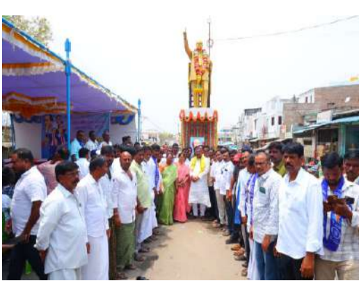
పల్లె వెలుగు - ప్యాపిలి