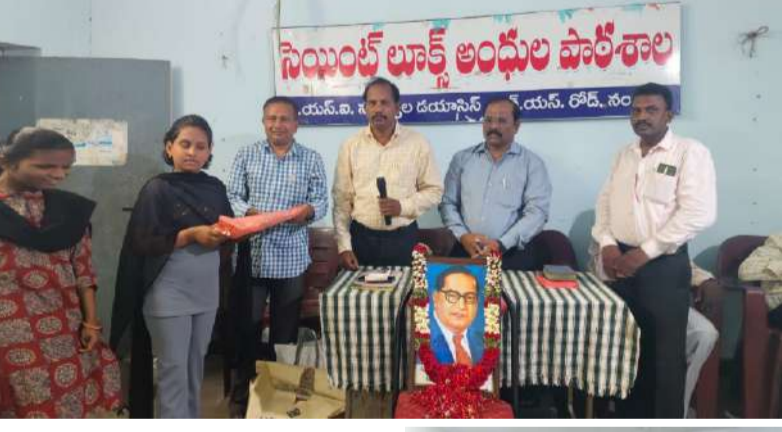
నంద్యాల ప్రతినంది, ఏప్రిల్ 14 (పల్లె వెలుగు) :