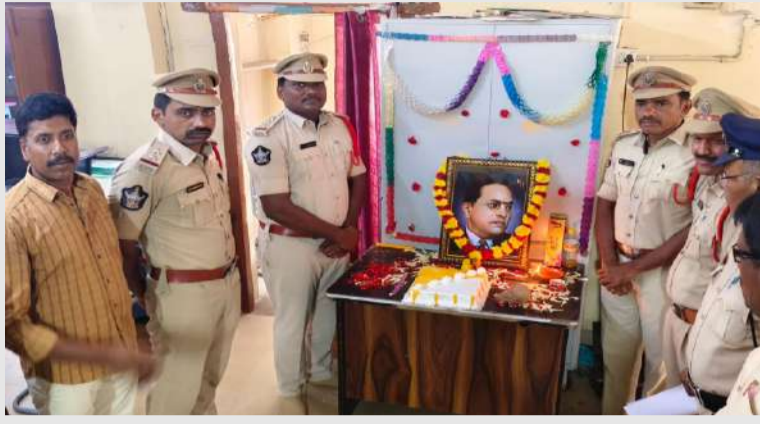
పల్లె వెలుగు కర్నూలు బ్యూరో

రాజ్యాంగ నిర్మాతకు ఘన నివాళులర్పించిన సీబి మరియు పోలీస్ సిబ్బంది