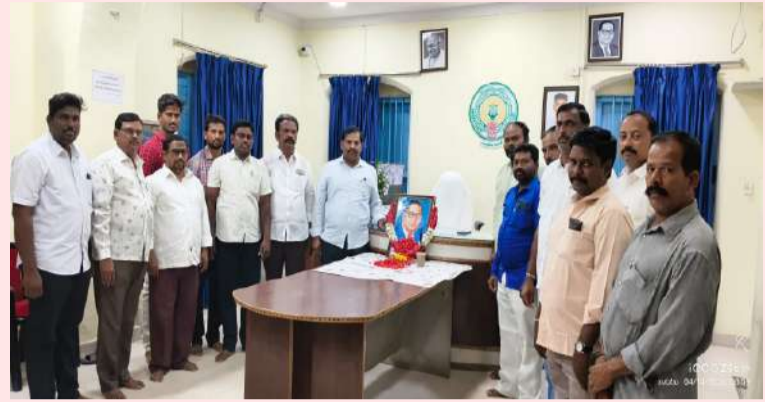
పల్లె వెలుగు నంద్యాల జిల్లా బ్యూరో.