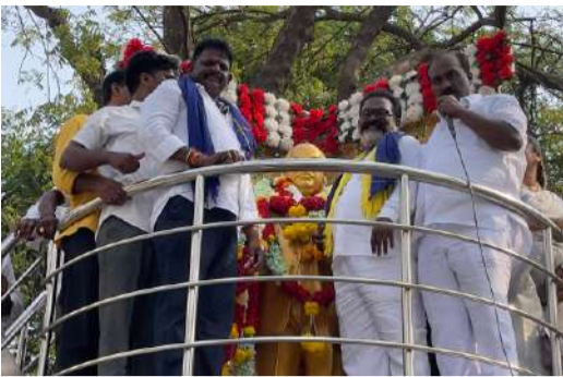
ప్రగతిశీల సమాజాన్ని నిర్మించిన గొప్ప వ్యక్తి. ఆదోనిలో డాక్టర్ బి.ఆర్. అంబేద్కర్ జయంతి తెలుగుదేశం పార్టీ ఆధ్వర్యంలో ఘనంగా వేడుకలు.