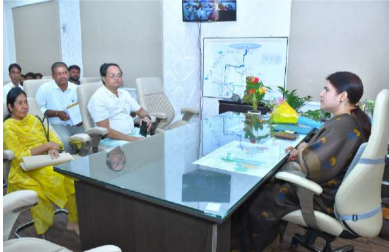
హాస్పిటల్ పరిసరాల్లో సీసీటీవీ, ప్రహారీ గోడ ఏర్పాటు చేయండి.