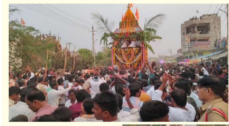
గూడూరు పల్లె వెలుగు ఏప్రిల్ 13