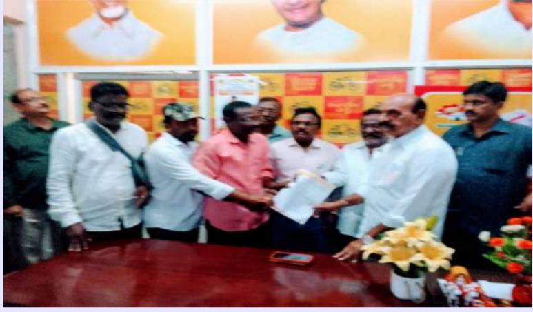
నంద్యాల ప్రతినిధి, ఏప్రిల్ 13 (పల్లె వెలుగు):