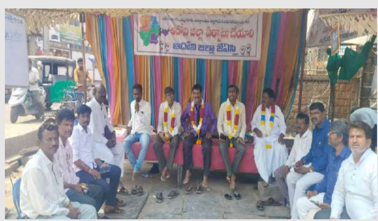
ఆదోని (పల్లె వెలుగు):