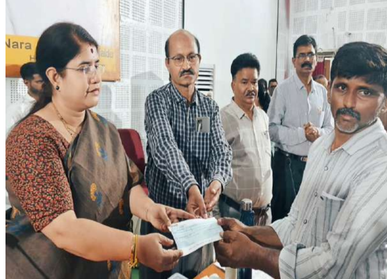
పల్లె వెలుగు నంద్యాల జిల్లా బ్యూరో.

ఆర్థిక సహాయం అందజేసినట్లు కలెక్టర్ వెల్లడించారు. ఈ సహాయాన్ని సద్వినియోగం చేసుకుని తిరిగి జీవనోపాధిని సాధించుకోవాలని రైతుకు సూచించారు.