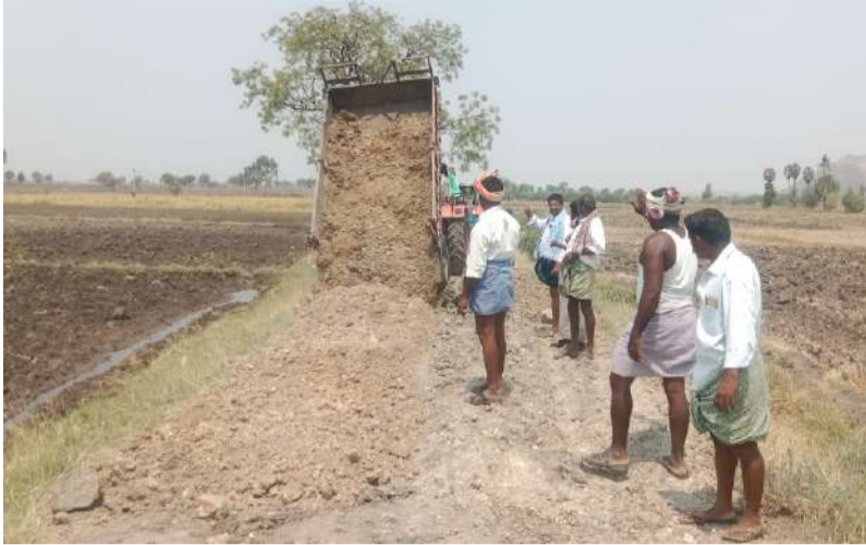
హోళగుండ పల్లె వెలుగు ఏప్రిల్ 13