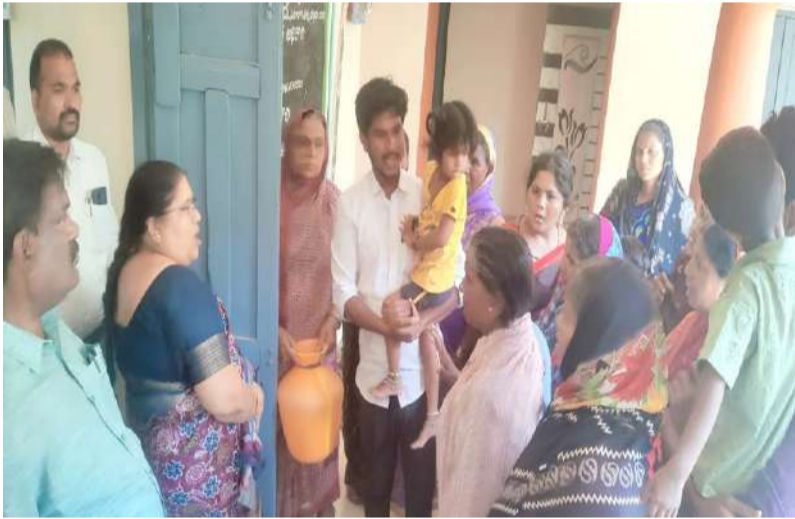
"మాకు నీళ్లు కావాలి" అంటూ మండల కార్యాలయం ముట్టడించిన మహిళలు