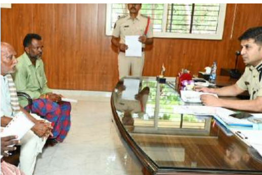
ప్రజా ఫిర్యాదుల పరిష్కార వేదిక (పబ్లిక్ రీమోన్ రిస్పెంస్ సిస్టం) కార్యక్రమానికి 112 ఫిర్యాదులు.