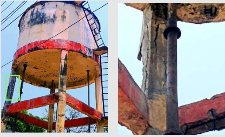
బండి ఆత్మకూరు పల్లె వెలుగు ఏప్రిల్ 13 :

బండి ఆత్మకూరు మండల పరిధిలో ఉన్న ఈర్లు పాడు గ్రామంలోని రక్షిత మంచినీటి సరఫరా పథకానికి సంబంధించిన ఓవర్ హెడ్ ట్యాంకును పడగొట్టి పుణ్యం కట్టుకోవాలని ఆ గ్రామ ప్రజలు నంద్యాల జిల్లా కలెక్టర్ విజ్ఞప్తి చేస్తున్నారు. మంచినీళ్ల ట్యాంకును పడగొట్టాలని గ్రామ ప్రజలు విజ్ఞప్తి చేయడం ఏమిటి అని ఆశ్చర్య పోయారు సుమా! ట్యాంకు పడగొట్టాలి అనే ప్రజా విజ్ఞప్తికి ఓ కారణం కూడా ఉంది. ఈర్లుపాడు గ్రామంలో 25 సంవత్సరాల క్రితం రామాలయం సమీపంలో రక్షిత మంచినీటి సరఫరా పథకంలో భాగంగా ఓవర్ హెడ్ ట్యాంక్ నిర్మాణం జరిగింది. ఈ ప్రాంతంలో బోరు ఏర్పాటు చేసి గ్రామంలో ప్రజలకు నీటి సరఫరాను అందిస్తూ ఉండేవారు. కాలక్రమేనా బోరులో భూగర్భ జలాలు ఇంకిపోవడంతో నీటి సరఫరాకు అటంకం ఏర్పడింది. దీనితో కర్నూలు కడప కాల్య వద్ద ఉన్న బోరునే ఆధారం చేసుకొని గ్రామ ప్రజలకు నీటి సరఫరా చేస్తూ ఉన్నారు. గత 15 సంవత్సరాల నుండి ట్యాంకుకు నీటి సరఫరా నిలిచిపోవడంతో బ్యాంకు నిరుపయోగంగా ఉంది. ప్రస్తుతం ట్యాంకు నిరుపయోగంగా ఉండడంతో మూడు పిల్లర్లు బాగా దెబ్బతిన్నాయి. ట్యాంకు అప్పుడు ఇప్పుడా అనే విధంగా కూలండుకు సిద్ధంగా ఉంది. జనసంచారం ఉన్న ప్రాంతంలో ఈ ట్యాంకు ఉండటం వల్ల ప్రజలు ఆందోళన చెందుతున్నారు. అది కాక ప్రతి మంగళవారం ఈర్లుపాడు గ్రామంలో వారపు సంత జరుగుతూ ఉంటుంది. గ్రామంలోని ప్రజలందరూ ఈ ప్రాంతానికి వచ్చి వారపు సంతను చేసుకొని వెళ్తూ ఉంటారు. నిత్యం రద్దీగా ఉండే ప్రాంతంలో ఈ ట్యాంక్ ఉండటంవల్ల ప్రజలు భయాందోళనకు గురి అవుతున్నారు. జిల్లా కలెక్టర్ విషయంలో వెంటనే చర్య తీసుకొని ట్యాంకును పడగొట్టించి పుణ్యం కట్టుకోవాలని గ్రామ ప్రజలు విజ్ఞప్తి చేస్తూ ఉన్నారు.?