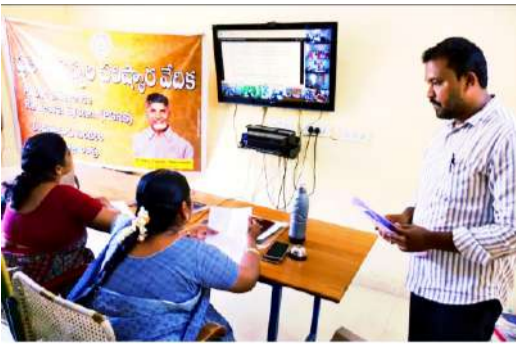
బండి ఆత్మకూరు పల్లె వెలుగు ఏప్రిల్ 13: