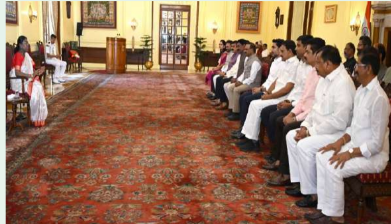
పల్లె వెలుగు కర్నూలు బ్యూరో