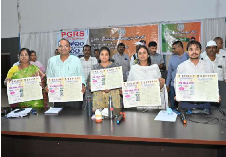
పోస్టర్లను అవిష్కరించిన జిల్లా కలెక్టర్ డా. ఏ. సిరి