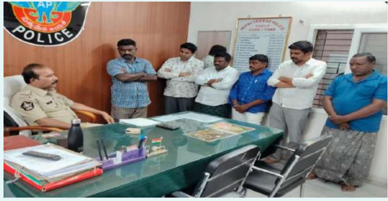
ఒకటో పట్టణ పోలీస్ స్టేషన్ నిబంధనలను చర్చిస్తున్నారు.