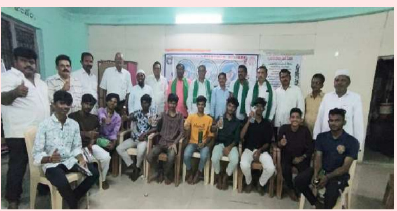
పల్లె వెలుగు నంద్యాల రూరల్.

“జననీ జన్మభూమిశ్చ” గేయాన్ని అవిష్కరించిన విద్యార్థులు.