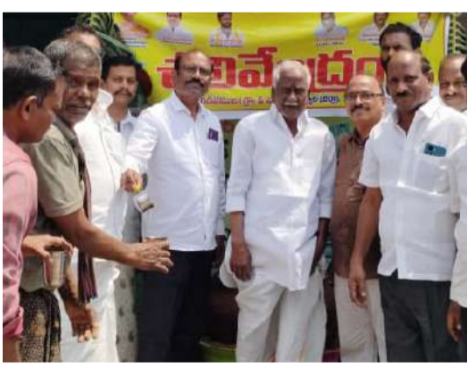
గడివేముల పల్లె వెలుగు దినపత్రిక

నంద్యాల జిల్లా గడివేముల మండలం గ్రామ పాత బస్టాండ్ సమీపంలో ప్రజలకు వేసవి తాగునీటి దృష్ట్యా చలివేంద్రము ఏర్పాటుచేయడం అభినందనీయమైన చర్య చలివేంద్రాలను ఏర్పాటు చేసి ప్రయాణికులకు, బాటసారులకు ఉచితంగా చల్లని మంచినీటిని అందిస్తున్నాయి. సేవ యొక్క ప్రాముఖ్యత: ఎండలు ఎక్కువగా ఉండే