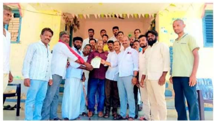
మెడక్ కొల్లూరి ఏప్రిల్ 12 పల్లె వెలుగు