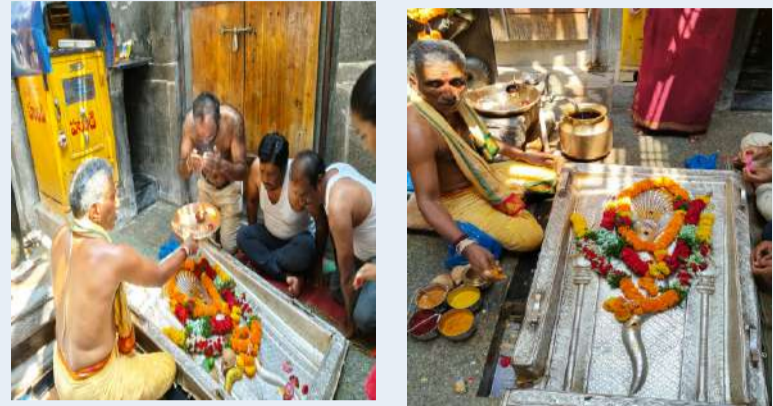
పాణ్యం. ఎన్.కొత్తూరు. పల్లె వెలుగు. ఏప్రిల్ 12.