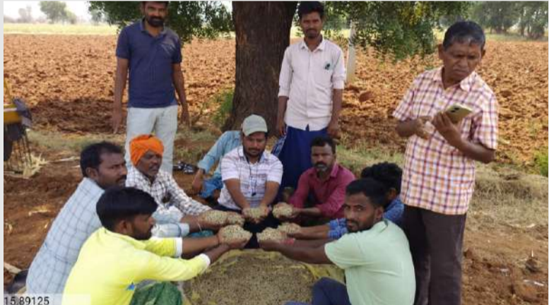
కోసిగి, ఏప్రిల్ -12 (పల్లెవెలుగు):