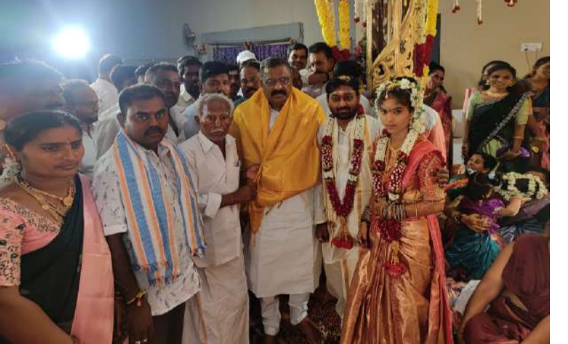
పల్లె వెలుగు - డోన్