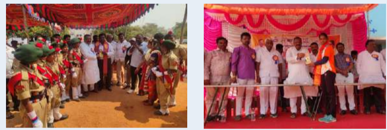
పల్లె వెలుగు - డోన్

క్రీడలతోనే మానసిక ఉల్లాసం, శారీరక దృఢత్వం: ఎమ్మెల్యే కోట్ల జయసూర్య ప్రకాశ్ రెడ్డి