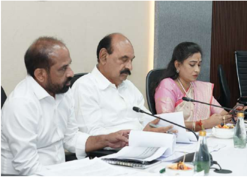
పజ్జిక లిటిగేషన్ పాలసీ- పై మంత్రి వర్గ ఉపసంఘం భేటీ