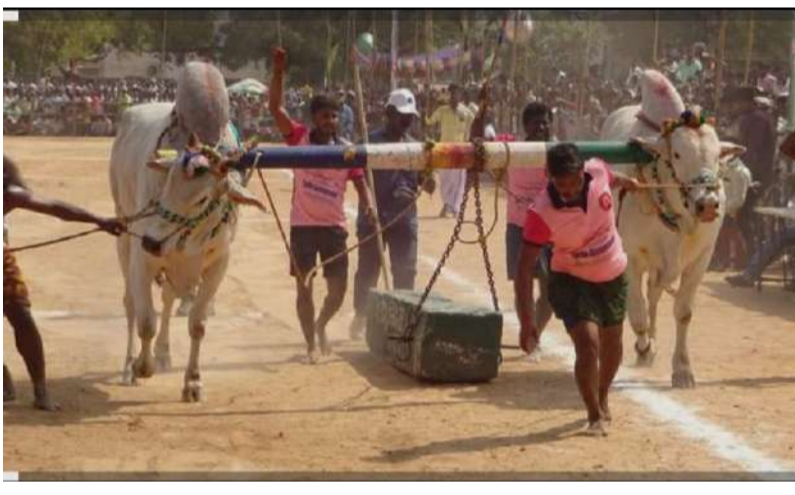
గూడూరు పల్లె వెలుగు ఏప్రిల్ 10