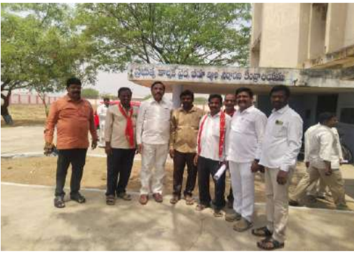
ఈఎన్ఐ లబ్ధిదారులకు మెరుగైన వైద్యం అందించాలని సిఐబీయూ డిమాండ్