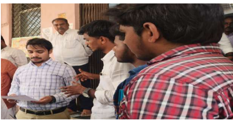
ప్రత్యేక నిధులు కేటాయించి స్టేడియం పనులు పూర్తి చేయాలి.