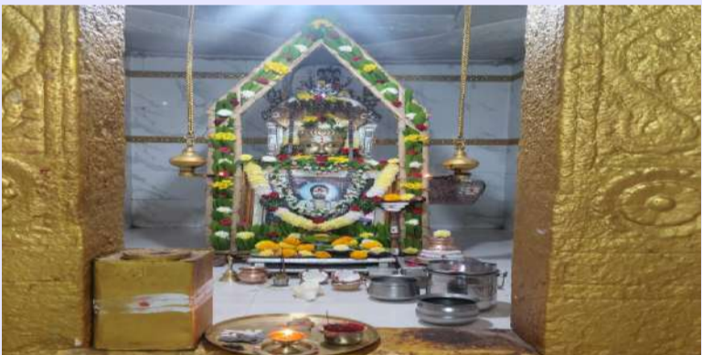
గూడూరు పల్లెవెలుగు ఏప్రిల్ 10

గూడూరులో వెలసిన శ్రీశ్రీశ్రీ తిమ్మగురుడు స్వామి తిరునాల ఉత్సవాలు నేటి నుండి 16వ తేదీ వరకు అంగరంగ వైభవంగా నిర్వహించేందుకు దేవదాయ శాఖాధికారులు, గ్రామ స్థులు అన్ని ఏర్పాట్లు చేసినట్లు ఆలయ కమిటీ సిబ్బంది తెలిపారు జిల్లాలో జరిగే అతి పెద్ద జాతరలలో ఒకటైన తిమ్మగురుడు స్వామి తిరునాల ఉత్సవాల్లో భాగంగా ఈనెల 11న ప్రభోత్సవం, 12న ప్రారంభ రథోత్సవం, 13న సంపూర్ణ రథోత్సవం, 14న గరుడోత్సవం, పల్లకిసేవ, 15న పారువేట, 16న వసంతోత్సవ కార్యక్రమాలు జరుగుతున్నట్లు ఆలయ కమిటీ పెద్దలు తెలిపారు శ్రీశ్రీశ్రీ తిమ్మగురుడు స్వామివారి తిరునాల ఉత్సవాలను తిలకించేందుకు జిల్లా నలుమూలల నుంచే గాక, కర్ణాటక, తెలంగాణ ప్రాంతాల నుంచి భారీ ఎత్తున ప్రజలు తరలివస్తారు. ఆరు రోజుల పాటు సాగే జాతరలో ముఖ్యంగా వ్యవసాయానికి సంబంధించి ఎద్దులు, వ్యవసాయ సామాగ్రిని కొనుగోలు చేసేందుకు భారీగా రైతులు తరలివస్తారు.