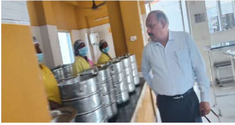
పల్లె వెలుగు నంద్యాల జిల్లా బ్యూరో.