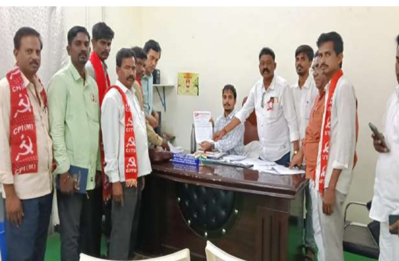
పట్టణ జనాభా కనుగుణంగా అదనంగా మరో సమ్మర్ స్టారేజ్ ట్యాంక్ నిర్మించాలి. ఆదోని సిఐఐం పార్టీ నాయకులు డిమాండ్.