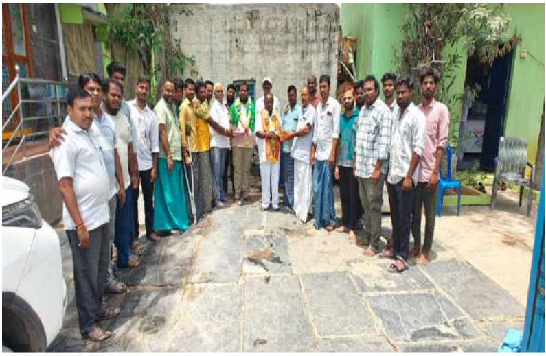
హనుమాన్ శోభాయాత్రలో టిడిపి మండల ప్రధాన కార్యదర్శి ఈబీజీ