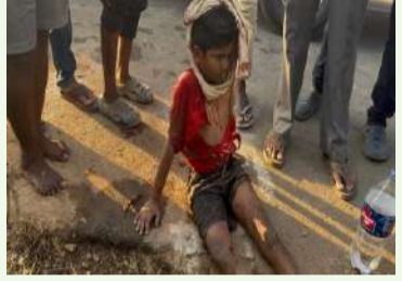
మహానంది, పల్లె వెలుగు