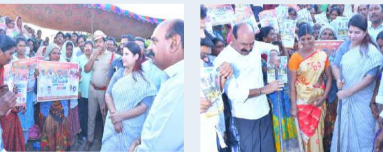
నంద్యాల, ఏప్రిల్ 06 పల్లె వెలుగు: