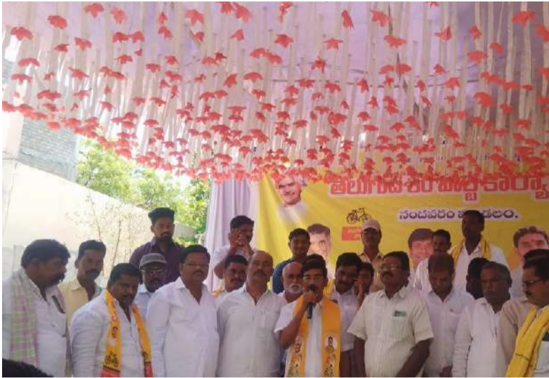
తెలుగుదేశం పార్టీ మండల టీడీపీ నాయకులు