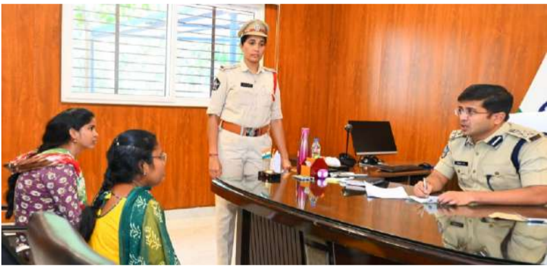
కర్నూలు జిల్లా ఎస్పీ విక్రాంత్ పాటిల్ ఐపియన్.