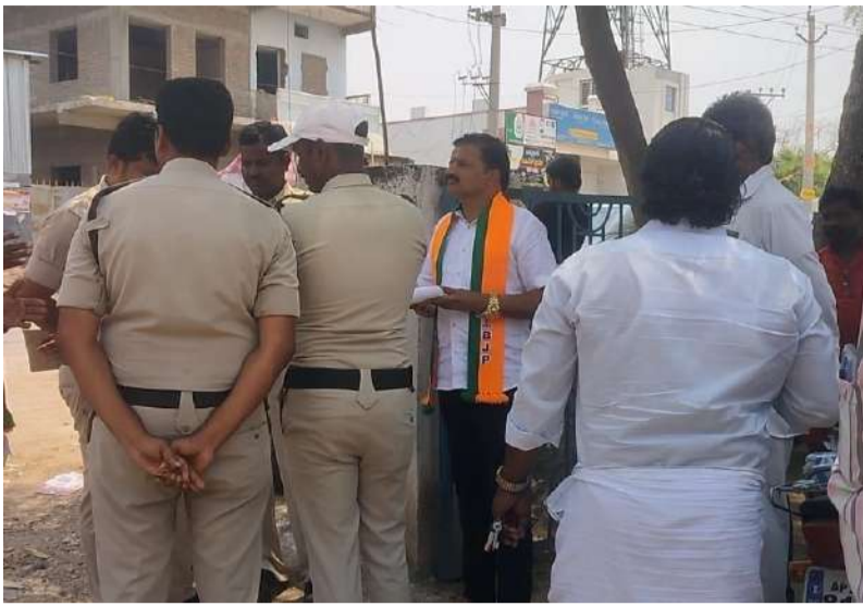
ఖాసీల ముందే పచ్చ నేతల 'రాడి' గర్జన.. మిత్రపక్షంపైనే తన్నులాట! బిలభార మదంతో రెచ్చిపోతున్న తమ్ముళ్లు.. నిమ్మకు నీరెత్తినట్లు వ్యవహరిస్తున్న పోలీసులు!