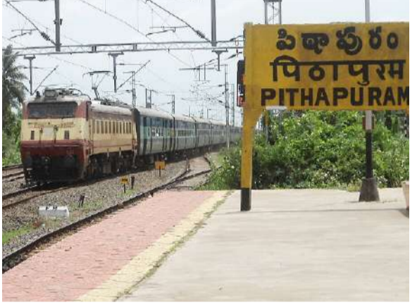
అమృత్ భారత్ స్టేషన్ స్కీమ్ కింద ఎంపిక చేసిన రైల్వేస్టేషన్లను అత్యధునిక మౌలిక సదుపాయాలతో కేంద్ర ప్రభుత్వం అభివృద్ధి చేస్తోంది.

పితాపురం: కాకినాడ జిల్లా ప్రజలకు గుడ్ న్యూస్. ఆంధ్రప్రదేశ్ ఉపముఖ్యమంత్రి పవన్ కల్యాణ్ కృషి ఫలితంగా పితాపురం రైల్వేస్టేషన్ కి మహారథ పట్టింది. దీనివల్ల సీఎం ప్రయాణాలకు మేరకు 'అమృత్ భారత్ స్టేషన్ స్కీమ్' పరిధిలోకి పితాపురం రైల్వేస్టేషన్ చేరింది. ఈ రైల్వేస్టేషన్ పునరుద్ధరణకు కేంద్రం రూ.37.25 కోట్లు కేటాయించింది. త్వరలోనే అభివృద్ధి పనులు చక్కచా ప్రారంభం కానున్నాయి. దీంతో పితాపురం రైల్వేస్టేషన్ రూపురేఖలు మారనున్నాయి. దీనిపై పితాపురం నియోజకవర్గ ప్రజలు, జిల్లా వాసులు సంతోషం వ్యక్తం చేస్తున్నారు. ఎప్పటి నుంచో స్టేషన్ మరమ్మత్తు పనులు పెండింగ్ లో ఉన్నాయని.. తమ అభిమాన నటుడు, ఉప ముఖ్యమంత్రి పవన్ కల్యాణ్ చొరవతో నేడు సమస్యలు తొలగిపోతున్నాయని హర్షం వ్యక్తం చేస్తున్నారు. కాగా,