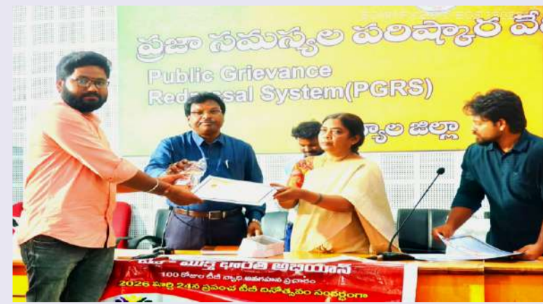
బండి ఆత్మకూరు పల్లె వెలుగు ఏప్రిల్ 6: