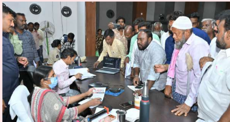
పల్లె వెలుగు కర్నూలు బ్యూరో

అర్జీదారులకు ఇచ్చే ఎండార్స్ మెంట్లు స్పష్టంగా ఉండాలి. గడువు ముగిసే వరకు వేచి చూడొద్దు.. తక్షణమే స్పందించండి. వనిలో నిర్లక్ష్యం వహిస్తే కఠిన చర్యలు తప్పవు. వివేకం పరిష్కార వేదికలో అధికారులకు కలెక్టర్ ఆదేశం.