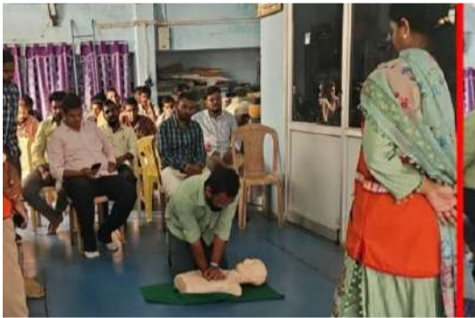
నంద్యాల ప్రతినిధి, ఏప్రిల్ 06 (పల్లె వెలుగు):

నంద్యాల పట్టణ శివారులోని ఎస్పీఐ ఆగ్రో ఇండస్ట్రీల్ నందు ఇండియన్ రెడ్ క్రాస్ సొసైటీ ఆధ్వర్యంలో