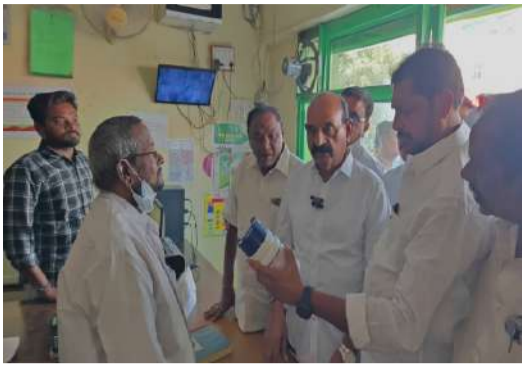
మార్కెట్ యార్డ్ షాపులను వెంటనే ప్రభుత్వానికి అప్పగించాలి. టెక్నోప్రాంతంలో మంత్రి ఫరూక్ ఆకస్మిక తనిఖీ.