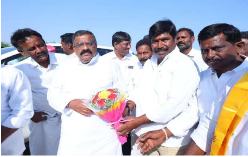
వెంకటాపురం చెరువును పరిశీలించిన డోన్ శాసనసభ్యులు