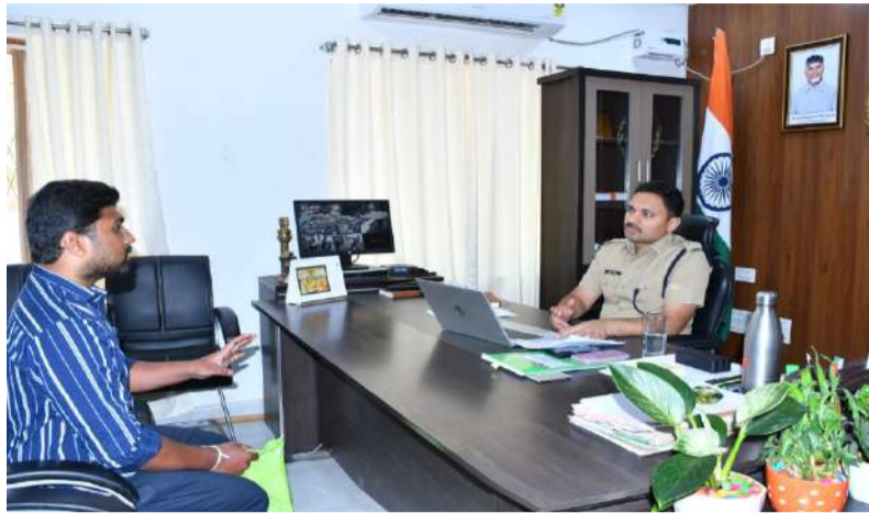
విచారణ జరిపి ఫిర్యాదుదారులకు చట్ట పరిధిలో న్యాయం చేస్తాం.

ఫిర్యాదులు పునరావృతం కాకుండా చూడాలని అధికారులకు ఆదేశాలు జారీ.