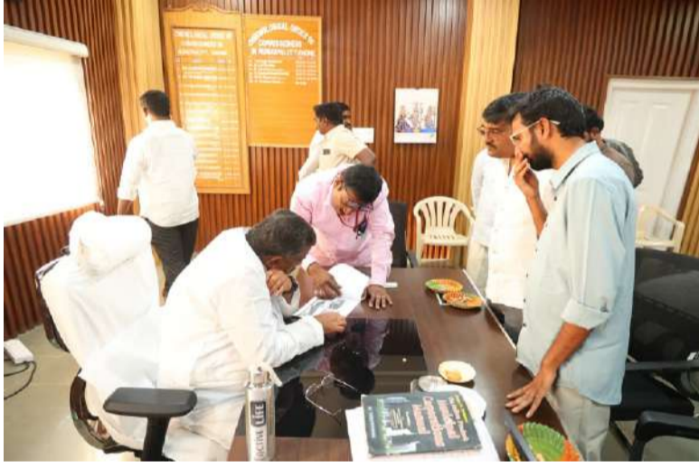
అధికారులు, ఇంజనీరింగ్ విభాగంతోలి