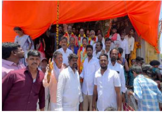
వీర బ్రహ్మయ్య స్వామి ఆలయానికి విరాళం