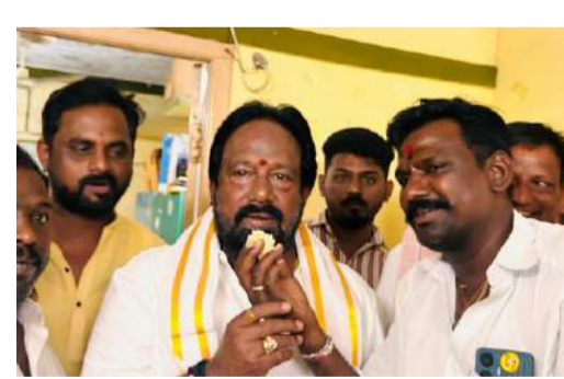
తెలుగుదేశం పార్టీ కార్యాలయం.