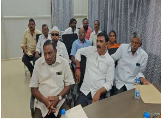
నంద్యాల మార్కెట్ యార్డ్ జనరల్ బాడీ సమావేశంలో మంత్రి ఎన్.ఎం.డి. ఫరూక్.