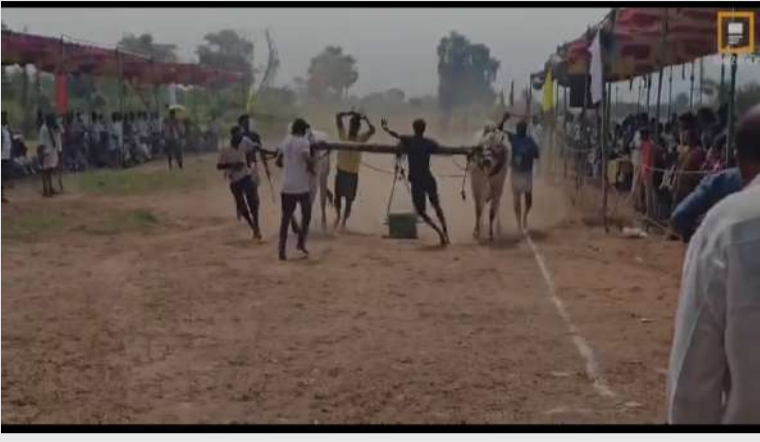
రుద్రవరం. పల్లె వెలుగు :

మండలంలోని చిన్నకంబలూరు గ్రామంలో ఆదివారం వృషభములకు బండలాగుడు పోటీలు హోరాహోరిగా నిర్వహించారు. ఈస్టర్ పండుగ సందర్భంగా నిర్వహించిన బండలాగుడు పోటీలలో ఆరు జతల వృషభములు పాల్గొన్నాయి. ఈ పోటీలలో గెలుపొందిన వృషభములకు నిర్వాహకులు నగదు బహుమతులు అందజేశారు. అలాగే సోమవారం రాష్ట్రస్థాయి బండలాగుడు పోటీలు నిర్వహిస్తున్నట్లు నిర్వాహకులు తెలిపారు.