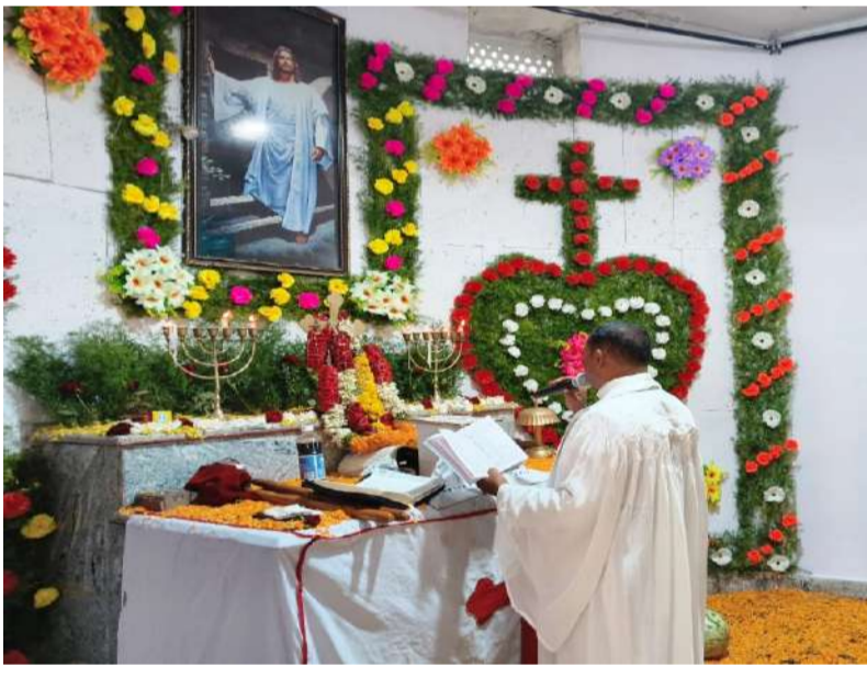
బండి ఆత్మకూరు పల్లె వెలుగు ఏప్రిల్ 5:

క్రైస్తవ సోదరులకు అతి పవిత్రమైన రోజు ఈస్టర్. చెడు మరియు మరణం పై సాధించిన విజయం. ఆశా జీవనం పునరుద్ధరణను సూచిస్తుంది. ఏనుక్రీస్తు శిలవ వేయబడిన మూడవ రోజున మరణాన్ని జయించి పునరుత్థానమైన సంఘటనను స్మరించుకుంటూ క్రైస్తవులు జరుపుకునే అతి ముఖ్యమైన పండుగ. సాధారణంగా 40 రోజుల ఉపవాసం కాలం తర్వాత మార్చి 22 నుండి ఏప్రిల్ 25 మధ్య వచ్చే ఆదివారం నాడు ఈస్టర్ పండుగను జరుపుకుంటారు.