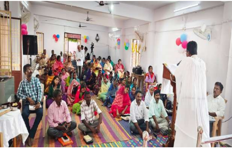
కలసపాడు, ఏప్రిల్ 5 (పల్లె వెలుగు)