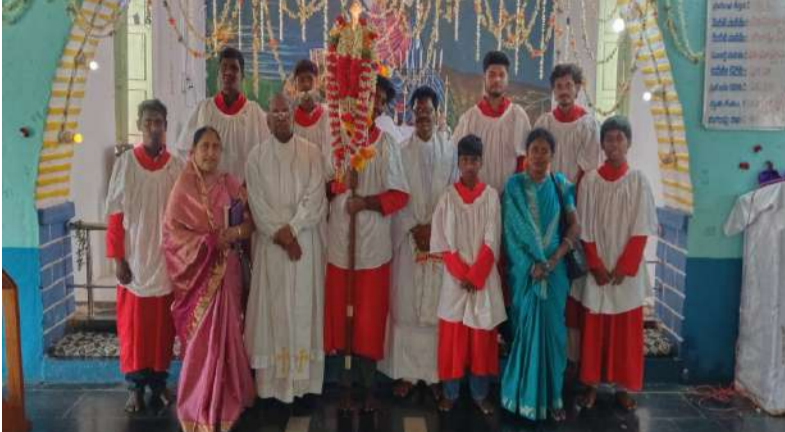
వృషభ రాజములకు బండలాగుడు పోటీలను నిర్వహించారు. క్రైస్తవ సోదరులు వసంతోత్సవాన్ని నిర్వహించు కున్నారు. అనంతరం నిర్వహించిన పలు సాంస్కృతిక కార్యక్రమాలు ఆకట్టుకున్నాయి.