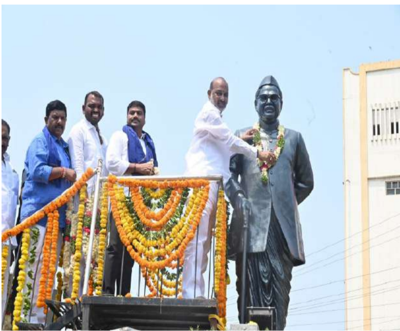
పిలువలు నేటి సమాజానికి ఎంతో అవసరమని ఆయన అభిప్రాయపడ్డారు. ముఖ్యంగా ప్రస్తుత తరం యువత ఆయన జీవిత చరిత్రను చదివి, ఆయన

భారత మాజీ ఉపప్రధాని, సామాజిక విప్లవకారుడు బాబూ జగ్జీవన్ రామ్ జయంతి వేడుకలు కరీంనగర్ జిల్లాలో అత్యంత ఘనంగా నిర్వహించబడ్డాయి. ఈ సందర్భంగా కేంద్ర మంత్రి బండి సంజయ్ కుమార్ నగరంలోని మంచీర్యాల చౌరస్తాకు చేరుకుని, అక్కడ ఉన్న జగ్జీవన్ రామ్ విగ్రహానికి పూలమాల వేసి ఘనంగా నివాళులర్పించారు. భారత రాజకీయ చరిత్రలో అణగారిన వర్గాల గొంతుగా, సామాజిక న్యాయం కోసం తన జీవితాంతం అలుపెరగని పోరాటం చేసిన మహనీయుడి సేవలను ఈ సందర్భంగా ఆయన కొనియాడారు. దేశాభివృద్ధిలో జగ్జీవన్ రామ్ పోషించిన పాత్ర చిరస్మరణీయమని ఆయన గుర్తుచేశారు. కేంద్ర ప్రభుత్వంలో సుమారు 29 ఏళ్ల పాటు సుదీర్ఘకాలం మంత్రిగా పనిచేసిన జగ్జీవన్ రామ్, దేశ సేవయే పరమ ధర్మంగా భావించి పనిచేశారని కేంద్ర మంత్రి బండి సంజయ్ కొనియాడారు. ఆయన హయాంలో తీసుకువచ్చిన అనేక సంస్కరణలు నేటికీ దేశాభివృద్ధికి పునాదులుగా ఉన్నాయని పేర్కొన్నారు. జగ్జీవన్ రామ్ గారు చూపిన మార్గం, ఆయన అనుసరించిన