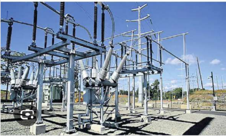
రుద్రవరం. పల్లె వెలుగు :