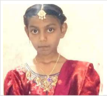
బండి ఆత్మకూరు పల్లె వెలుగు ఏప్రిల్ 5: