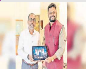
మహ్మదాబాద్, ఏప్రిల్ 5 పల్లెవెలుగు :