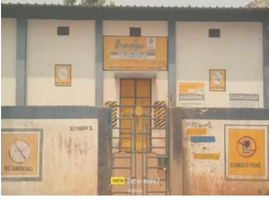
బుక్ చేసినా రోజుల తరబడి అందని గ్యాస్..