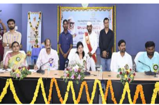
ఎస్సీ, ఎస్టీ, అన్ని వర్గాల అభివృద్ధి కోసం ప్రభుత్వం ప్రత్యేక శ్రద్ధ.