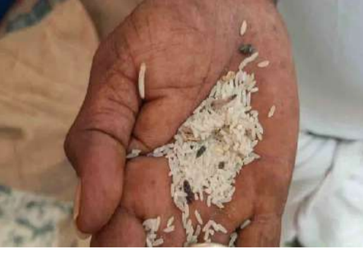
మహ్మదాబాద్, ఏప్రిల్ 5 పల్లెవెలుగు :

రేషన్ బియ్యంలో పురుగులు సన్న బియ్యం పంపిణీ చేస్తున్నామని గొప్పలు చెప్పుకునే ప్రభుత్వాలు ప్రజలకు పురుగుల పట్టి న రేషన్ బియ్యం ఇచ్చి ప్రజా ఆగ్రహానికి గురువుతున్నారు. మండలంలోని చౌదర్ పల్లి రేషన్ షాపునకు శుక్రవారం 220 క్వీంటాళ్ల రేషన్ బియ్యం వచ్చాయి. శనివారం లబ్ధిదారులకు బియ్యం ఇవ్వడానికి సంచలు తీయగా అందులో పురుగులు, నూకలే కనిపిస్తున్నాయని లబ్ధిదారులు ఆగ్రహం వ్యక్తం చేశారు. మూడునెలల బియ్యం ఒకేసారి ఇస్తున్నారు.. తినలేక ఆకలితో చావాలంటూ లబ్ధిదారుల ఆగ్రహం సన్న బియ్యం పంపిణీ చేస్తున్నామని గొప్పలు చెప్పుకునే ప్రభుత్వాలు ప్రజలకు పురుగుల పట్టి న రేషన్ బియ్యం ఇచ్చి ప్రజా ఆగ్రహానికి గురువుతున్నారు. మండలంలోని చౌదర్ పల్లి రేషన్ షాపునకు శు క్రవారం 220 క్వీంటాళ్ల రేషన్ బియ్యం వచ్చాయి. శనివారం లబ్ధిదారులకు బియ్యం ఇవ్వడానికి సంచలు తీయగా అందులో పురుగులు, నూకలే కనిపిస్తున్నాయని లబ్ధిదారులు ఆగ్రహం వ్యక్తం చేశారు. మూడునెలల బియ్యం ఒకేసారి