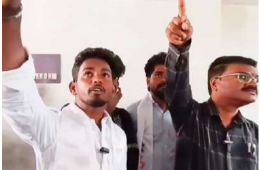
ప్రభుత్వ నిబంధనలను పాటించని పైవేట్ పాఠశాలలు.