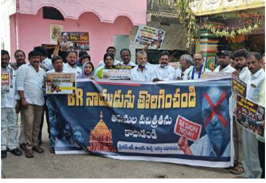
పల్లె వెలుగు నంద్యాల జిల్లా బ్యూరో.