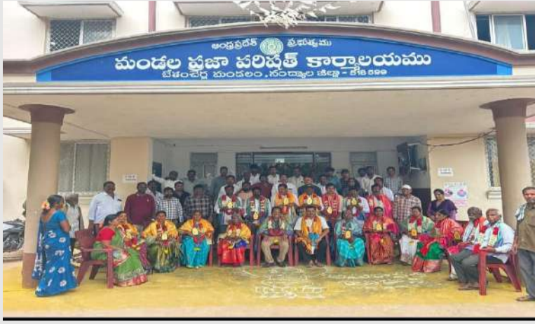
పల్లె వెలుగు బేతంచెర్ల ప్రతినధి (ఏప్రిల్ 4):-

బేతంచెర్ల మండలంలోని అందరి సర్పంచుల పదవీకాలం 02/04/2026 వ తేదీన ముగిసినది కావున, వారి యొక్క పదవీ కాలాన్ని సర్పంచులందరు దిగ్విజయంగా పూర్తిచేసినందుకు, గ్రామాల అభివృద్ధికి ఎంతో కృషి చేసినందుకు గాను, సర్పంచులందరికీ శనివారం నాడు మండల ప్రజా పరిషత్తు కార్యాలయము బేతంచెర్ల నందు సర్పంచుల అందరికీ సన్మానం చేయడం జరిగింది. ఇందులో భాగంగా అధ్యక్షులు, మండల ప్రజా పరిషత్తు, బేతంచెర్ల వారు మరియు మండల ప్రజా పరిషత్తు అభివృద్ధి అధికారి, మరియు డిప్యూటీ ఎంపీడీవో, ఊశీ,పంచాయతీ అభివృద్ధి అధికారులు అందరూ కూడా పాల్గొని కార్యక్రమమును విజయవంతం చేయడం జరిగినది.