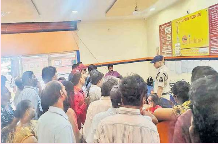
మేడ్చల్-మల్యాజిరి ఏప్రిల్ 04 (పల్లె వెలుగు) :