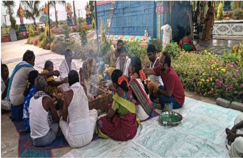
రుద్రవరం. పల్లె వెలుగు :

రుద్రవరం మండల పరిధిలోని నల్లమల అటవీ ప్రాంతంలో వెలసిన శ్రీ దార్శి చెంఱు అక్షీనరసింహస్వామి మరియు నాగప్రతిష్ఠ ప్రథమ వార్షికోత్సవ వేడుకలు శనివారం అత్యంత వైభవంగా, కన్నుల పండువగా జరిగాయి. పరాభవ నామ సంవత్సర చైత్ర బహుళ విదియ నాడు స్వామి నక్షత్రయుక్త శుభ ముహూర్తాన ఆలయ సేవకులు, గ్రామ పెద్దల ఆధ్వర్యంలో ఉదయం నుండి గణపతి పూజ, పుణ్యహవనములతో కార్యక్రమాలు ప్రారంభమయ్యాయి. స్వామివార్లకు పంచామృతాభిషేకములు, కలశ స్థాపన నిర్వహించిన అనంతరం లోక కళ్యాణార్థం గణపతి, సుదర్శన, మహాలక్ష్మి చోమాలతో పాటు నవగ్రహ