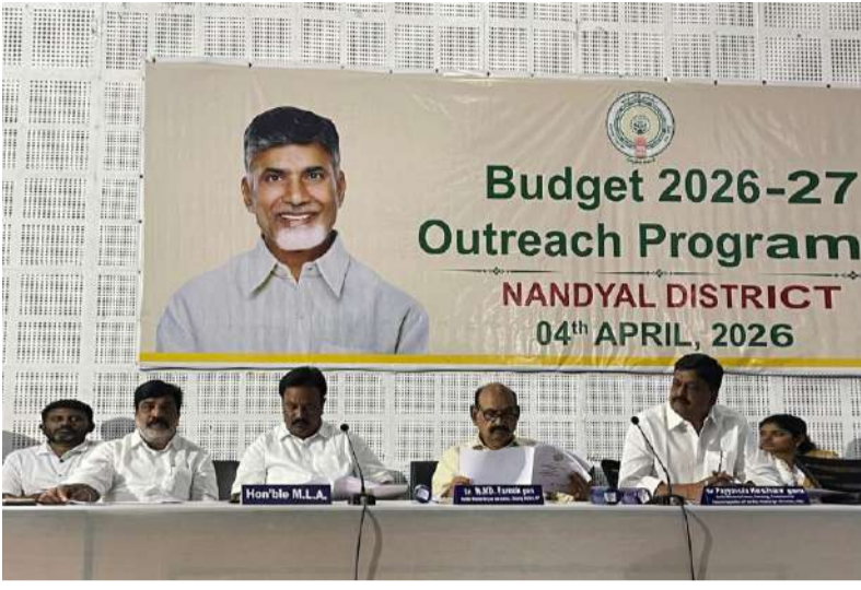
పల్లె వెలుగు - డోన్