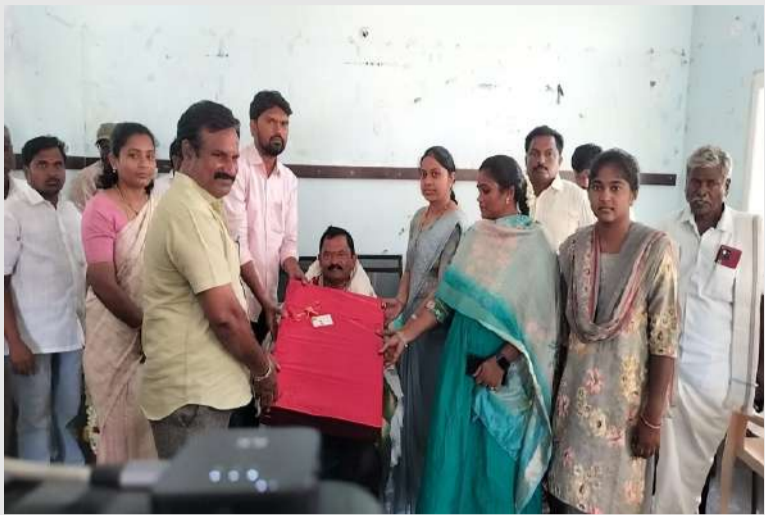
పోరుమామిళ్ల ఏప్రిల్ 4 (పల్లె వెలుగు)