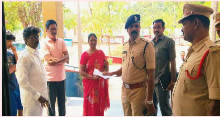
సూర్యాపేట క్రైమ్ ఏరియా 04 పల్లె వెలుగు:

ప్రజా పాలన ప్రగతి ప్రణాళిక కార్యక్రమంలో భాగంగా ఎస్పి నరసింహ శుక్రవారం సూర్యాపేట పట్టణ పోలీస్ స్టేషన్ ను తనిఖీ చేశారు, పోలీస్ స్టేషన్ పరిసరాలు పోలీస్ స్టేషన్లో నిర్వహిస్తున్న రికార్డ్ లు ఫిర్యాదుల నిర్వహణను పరిశీలించారు. పోలీస్ స్టేషన్ నందు నిర్వహిస్తున్న కమాండెంట్ కంట్రోల్స్ సెంటర్ ను పరిశీలించారు. అనంతరం పోలీస్ స్టేషన్ కు వచ్చిన ఫిర్యాదుదారులతో మాట్లాడి ఫిర్యాదులపై త్వరితగతిన చర్యలు తీసుకోవాలని పోలీస్ అధికారులను ఆదేశించారు. ఈ సందర్భంగా ఎస్పి మాట్లాడుతూ ప్రజా పాలన ప్రగతి ప్రణాళిక కార్యక్రమంలో భాగంగా కేసుల్లో దర్యాప్తు వేగవంతం చేయాలని, రికార్డు త్వరితగతిన పూర్తి చేయాలని ఆదేశించారు. పోలీస్ స్టేషన్ కు వచ్చే ఫిర్యాదుదారుల పట్ల మర్యాదగా ప్రవర్తిస్తూ వారికి భరోసా కల్పించాలని సూచించారు. ప్రజా సమస్యలపై సమాచారం అందిన వెంటనే వేగంగా స్పందిస్తూ బాధితుల వద్ద నుండి కేసులు నమోదు చేయాలని ఆదేశించారు. సామాజిక కార్యక్రమాల ద్వారా ఎప్పటికప్పుడు ప్రజలకు అందుబాటులో ఉండాలని సైబర్ మోసాలు రోడ్డు ప్రమాదాలు మహిళల భద్రతపై విస్తృత అవగాహన కల్పించాలని సూచించారు. సిబ్బంది అందరూ జట్టుగా పనిచేసే మంచి ఫలితాలు సాధించాలని కోరారు. పట్టణంలో ట్రాఫిక్ సమస్యలను పరిష్కరించడానికి ఆపరేషన్ రోడ్ సమర్థవంతంగా అమలు చేయాలని సూచించారు. అరెస్ట్ అరెస్ట్ రోడ్డు భద్రతలో భాగంగా విస్తృతంగా అవగాహన కార్యక్రమాలు నిర్వహించి ప్రజలను అవగాహన కల్పించాలి అన్నారు. సిబ్బంది అందరూ ఒక జట్టుగా పని చేసే మంచి ఫలితాలు సాధించాలని సూచించారు. ఎస్పి వెంట పట్టణ ఇన్స్ పెక్టర్ వెంకటయ్య, ఎస్ఐ లు ఏడుకొండలు, ఐలయ్య, మహేందర్ నాథ్, శివతేజ, సిబ్బంది ఉన్నారు.