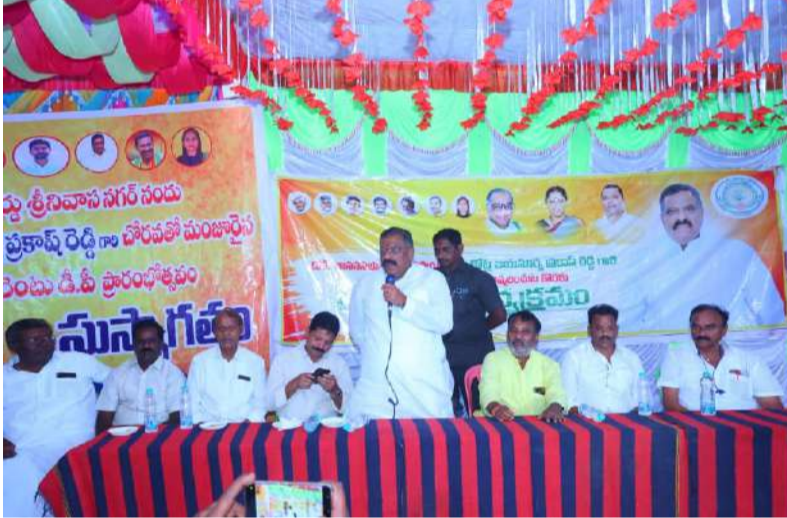
పల్లె వెలుగు - డోన్