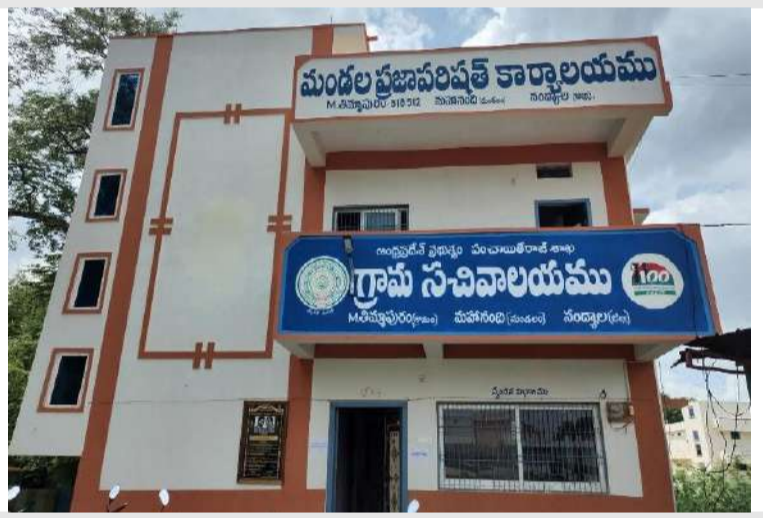
మహానంది, పల్లె వెలుగు