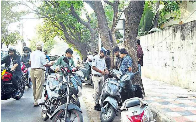
ఆదాయ వనరుగా ట్రాఫిక్ ఉల్లంఘనలు