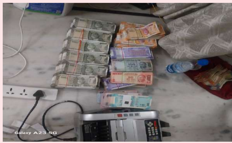
వరంగల్, ఏప్రిల్ 04 (పల్లె వెలుగు):

వరంగల్ జిల్లా హనుమకొండలోని సబ్-రిజిస్ట్రార్ కార్యాలయంలో అవినీతి నిరోధక శాఖ ఆకస్మిక తనిఖీలు నిర్వహించింది. ఈ దాడుల్లో పలు అక్రమాలు వెలుగులోకి రావడంతో అధికార వర్గాల్లో కలకలం రేగింది. ఈ తనిఖీల్లో కార్యాలయం లోపల 20 మంది అసభ్యకార ఏజెంట్లు, డాక్యుమెంట్ రైటర్లు ఉన్నట్లు గుర్తించారు. అదేవిధంగా లెక్కల్లో చూపని రూ.47,450 నగదును స్వాధీనం చేసుకున్నారు. రిజిస్ట్రేషన్ కాని 70 పత్రాలు కూడా అధికారులు స్వాధీనం చేసుకున్నారు. అధికారులు, డాక్యుమెంట్ రైటర్ల మధ్య భారీ లావాదేవీలు జరిగినట్లు వాట్సాప్ చాట్ల ద్వారా బయటపడింది. గత ఏడాదిలో రూ.42.03 లక్షల వరకు ఫోన్ పే ద్వారా లావాదేవీలు జరిగినట్లు గుర్తించారు. అలాగే రిజిస్ట్రార్ చేసిన 204 పత్రాలు ఇంకా సంబంధిత వారికి అందించకుండా కార్యాలయంలోనే నిల్వ ఉన్నట్లు అధికారులు గుర్తించారు. ఈ అంశంపై కూడా దర్యాప్తు కొనసాగుతోంది. ఇక అధికారుల ఇళ్లలో నిర్వహించిన తనిఖీల్లో రూ.24.61 లక్షల నగదు, 819.5 గ్రాముల బంగారం, 2.6 కిలోల వెండి ఆభరణాలు స్వాధీనం చేసుకున్నారు. అదనంగా రూ.30.1 లక్షల ఫిక్స్డ్ డిపాజిట్లు ఉన్నట్లు గుర్తించారు. ఈ ఘటనపై పూర్తి స్థాయి నివేదికను ప్రభుత్వం కు సమర్పించనున్నట్లు అధికారులు తెలిపారు. మరిన్ని అక్రమాలు బయటపడే అవకాశముందని, దర్యాప్తు కొనసాగుతోందని వెల్లడించారు.