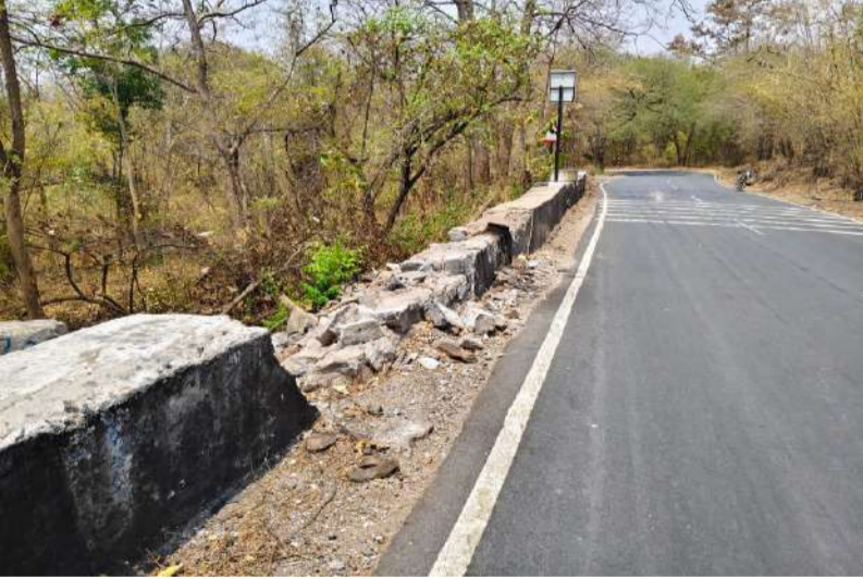
ఆందోళన చెందుతున్న ప్రయాణికులు