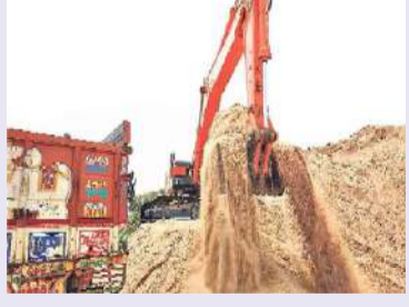
ఊట్కూర్, మార్చి 30 : పల్లె వెలుగు

ఇందిరమ్మ ఇండ్ల నిర్మాణం పేరుతో కొందరు వ్యాపారులు అడ్డదారిలో ఇసుక దోపిడీకి పాల్పడుతున్నారు. తెలంగాణ, కర్ణాటక సరిహద్దు శివారులో ప్రవహిస్తున్న పెద్దవాగు నుంచి రాత్రి పగలూ తేడా లేకుండా దర్జాగా ఇసుకను తరలిస్తూ సొమ్ము చేసుకుంటున్నారు. తెలంగాణ, కర్ణాటక సరిహద్దు శివారులో ప్రవహిస్తున్న పెద్దవాగు నుంచి రాత్రి పగలూ తేడా లేకుండా దర్జాగా ఇసుకను తరలిస్తూ సొమ్ము చేసుకుంటున్నారు. కొందరు వ్యాపారులు ట్రాక్టర్ యజమానులతో కుమ్మై సరిహద్దు పొలాల్లో ఇసుకను డంప్ చేయించి వారి వద్ద కొనుగోలు చేసిన ఇసుకను టిప్పర్ల ద్వారా నారాయణపేట జిల్లాకేంద్రంతో పాటు మక్కల్ నియోజకవర్గంలోని పరిసర గ్రామాలకు తరలించి రెట్టింపు ధరలకు అమ్ముకుంటున్నారు. ఊట్కూర్, అమీపూర్, తిప్రసాపల్లి, సంస్థాపూర్, నాగిరెడ్డిపల్లి, కొల్లూరు శివారు గ్రామాల పెద్దవాగు నుంచి అక్రమ ఇసుక వ్యాపారం మూడు పువ్వులు, ఆరు కాయలుగా కొనసాగుతోంది. గ్రామాల్లోని వ్యాపారుల వద్ద ట్రాక్టర్ ఇసుక ధర రూ. 2000 నుంచి రూ. 2500 కొనుగోలు చేసి ఇసుకను టిప్పర్లతో పట్టణాలకు తరలిస్తున్నారు. మరో పక్క ప్రభుత్వం ఆన్లైన్ ద్వారా ప్రజలకు ఇసుక రవాణా సౌకర్యం కల్పిస్తున్నప్పటికీ ఇసుక మాఫియా అడ్డదారిలో తరలించిన ఇసుకను టిప్పర్ ధర రూ. 20వేల నుంచి రూ. 22వేలు తక్కువ ధరకు విక్రయించడంతో నిర్మాణదారులు కొనుగోలు చేసేందుకు ఆసక్తి చూపేరుతున్నారు.