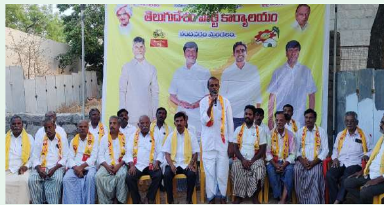
నందవరం పల్లె వెలుగు ఏప్రిల్ 3