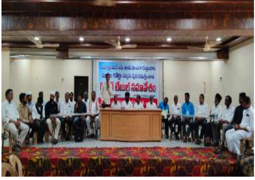
మతం మారితే కుల వివక్ష పోతుందా సుప్రీంకోర్టు తీర్పును పునఃసమీక్షించాలి పార్లమెంట్లో చట్టసవరణ చేయాలి