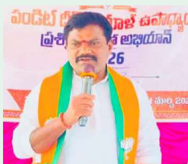
పల్లె వెలుగు నంద్యాల రూరల్.