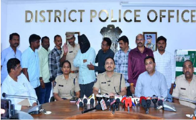
15 లక్షల విలువచేసిన బంగారు వెండి నాణాలతో పాటు నగదు స్వాధీనం.