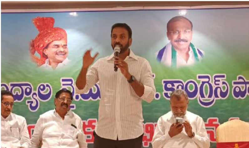
దిశా నిర్దేశం చేసిన మాజీ ఎమ్మెల్యే శిల్పా రవి చంద్ర కిషోర్ రెడ్డి.