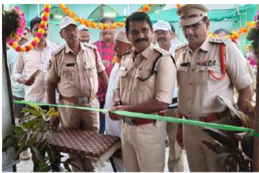
ఒకవైపు ట్రాఫిక్ క్రమబద్ధీకరణ.. మరోవైపు అనాధలకు అండ.. దాహార్లని తీరుస్తూ.. పక్షులను కాపాడుతూ