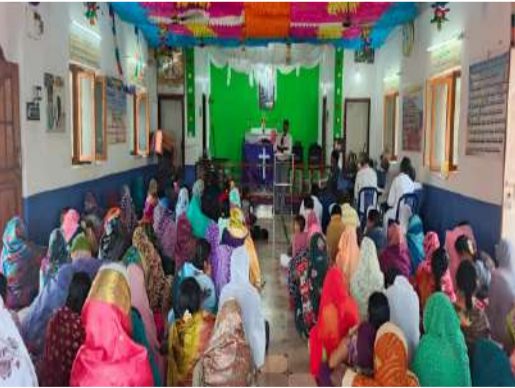
బండి ఆత్మకూరు పల్లె వెలుగు ఏప్రిల్ 3 :