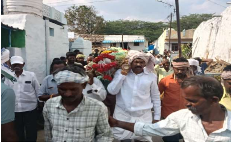
హోళగుండ పల్లె వెలుగు ఏప్రిల్ 03