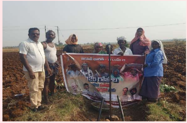
సి.బెళగల్ పల్లెవెలుగు ఏప్రిల్ 1