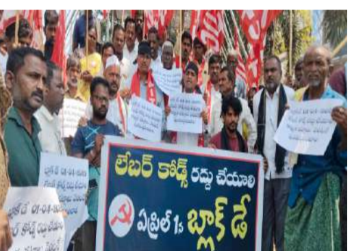
మోడీ ప్రవేశపెట్టిన లేబర్ కోడ్స్ రద్దు చేయాలి.