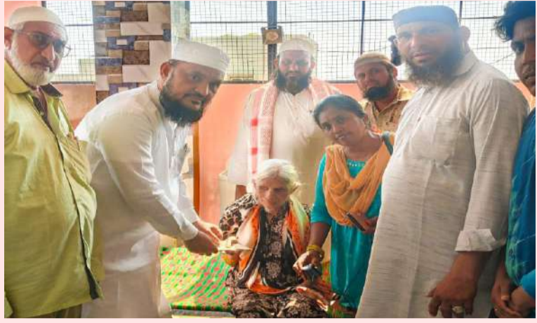
పల్లె వెలుగు నంద్యాల జిల్లా బ్యూరో.