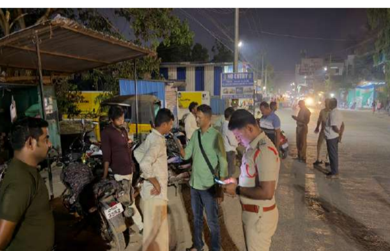
నేర నియంతరణ, ప్రజల భద్రతకు భరోసా.