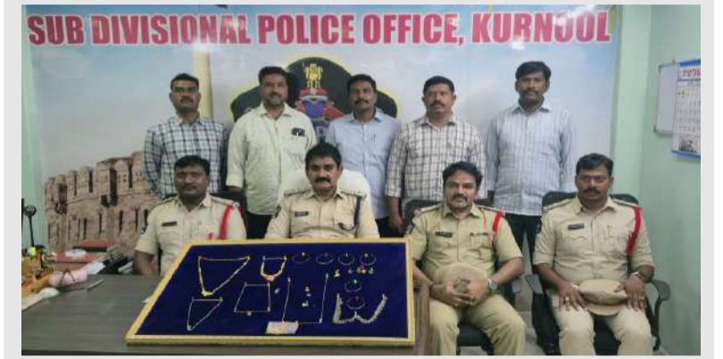
పల్లె వెలుగు కర్నూలు బ్యూరో

రూ. 12 లక్షల విలువైన బంగారు, వెండి ఆభరణాలు లికపర్ నిందితులు మైసూర్.. గతంలోనూ పలు దొంగతనాల్లో భాగస్వామ్యం: డిఎస్పీ బాబు ప్రసాద్