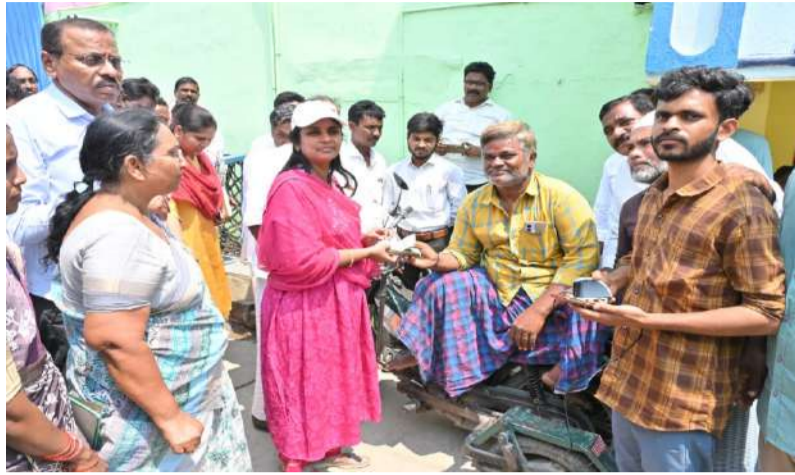
జిల్లాలో 2,35,692 మందికి రూ.104.18 కోట్ల పంపిణీ

కైరవాడి గ్రామంలో లబ్ధిదారులకు స్వయంగా పెన్షన్ అందజేసిన కలెక్టర్ డా. ఏ. సిరి పల్లె వెలుగు కర్నూలు బ్యూరో