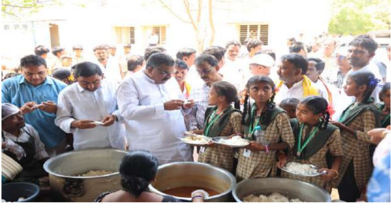
మధ్యాహ్న భోజనంపై అసహనం.. నాణ్యత లేకుంటే ఏజెన్సీ రద్దు చేస్తానని హెచ్చరిక