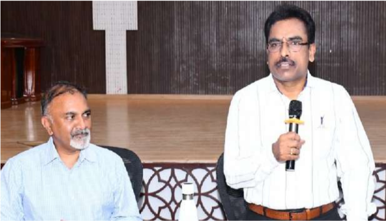
అన్న క్యాంట్ న్ల చాలిబుల్ ట్రస్ట్ సీకాపి పోతుల వంశీధర్