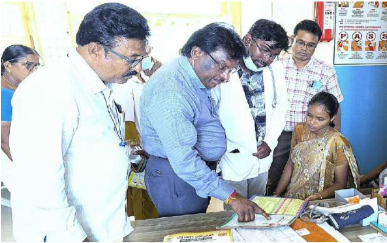
గిరిజన మహిళకు ప్రోత్సాహకం