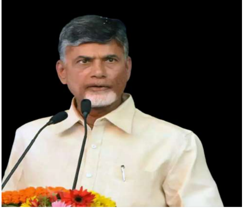
పలికిన అన్ని ప్రాధికార ఆంధ్రప్రదేశ్ ప్రజల తరపున కృతజ్ఞతలు తెలియజేస్తూ సీఎం చంద్రబాబు ట్వీట్ చేశారు.

అమరావతి, ఏప్రిల్ 1: అమరావతి చట్టబద్ధత బిల్లుకు సహకరించిన కేంద్ర ప్రభుత్వం, ప్రధాని నరేంద్ర మోదీ, హోం మంత్రి అమిత్ షాకు సీఎం చంద్రబాబు హృదయపూర్వక ధన్యవాదాలు తెలిపారు. రాజధానిని విశ్వనగరంగా తీర్చిదిద్ది ప్రపంచ పటంలో నిలుపుతామని అన్నారు. లోక్ సభలో అమరావతి చట్టబద్ధత బిల్లు ఆమోదం పొందడంపై ముఖ్యమంత్రి చంద్రబాబు నాయుడు స్పందించారు. అమరావతి భవిష్యత్తుపై ఉన్న సందిగ్ధతకు తెరపడిందన్నారు. లోక్ సభలో బిల్లు ఆమోదం పొందడం ఆంధ్రులకు దక్కిన గౌరవంగా పేర్కొన్నారు. స్వర్ణాంధ్ర నిర్మాణంలో ఇది ఒక కీలక మైలురాయిని సోషల్ మీడియా ఎక్స్ ప్లోట్ సీఎం షా చేశారు. చంద్రబాబు ట్వీట్... ప్రజా రాజధాని అమరావతి ఆంధ్రుల ఆత్మగౌరవానికి ప్రతీక అని సీఎం అన్నారు. ఈరోజు లోక్ సభలో అమరావతికి చట్టబద్ధత కల్పించే బిల్లు ఆమోదం పొందడం ఆంధ్రులకు దక్కిన గౌరవంగా భావిస్తున్నట్లు తెలిపారు. గత పాలనలో ఎదురైన చీకట్లు తొలగిపోయి, అమరావతి భవిష్యత్తుపై ఉన్న సందిగ్ధతకు శాశ్వతంగా తెరపడిందని సీఎం పేర్కొన్నారు. రైతుల త్యాగానికి, ప్రజల ఆకాంక్షలకు దక్కిన గౌరవం ఇదన్నారు. స్వర్ణాంధ్ర నిర్మాణంలో ఇది ఓ కీలక మైలురాయిన్నారు. అమరావతి ఇక అజేయం.. అజరామేరం అని అన్నారు సీఎం. రాజధానిని విశ్వనగరంగా తీర్చిదిద్ది ప్రపంచ పటంలో నిలుపుతామని స్పష్టం చేశారు. సహకరించిన కేంద్ర ప్రభుత్వానికి, ప్రధాని నరేంద్ర మోదీకి, హోం మంత్రి అమిత్ షాకు హృదయపూర్వక ధన్యవాదాలు తెలియజేశారు. లోక్ సభలో బిల్లుకు మద్దతు