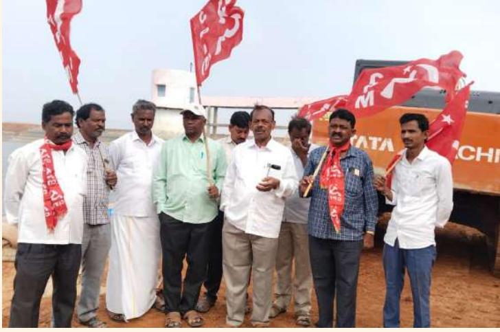
ఆదోని పల్లె వెలుగు డిసెంబర్ 5