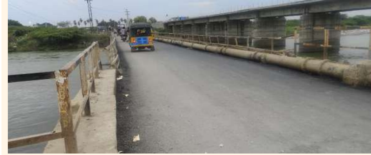
పల్లె వెలుగు సంస్థల రూరల్.