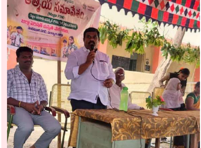
పల్లె వెలుగు సంస్థల జిల్లా బ్యూరో