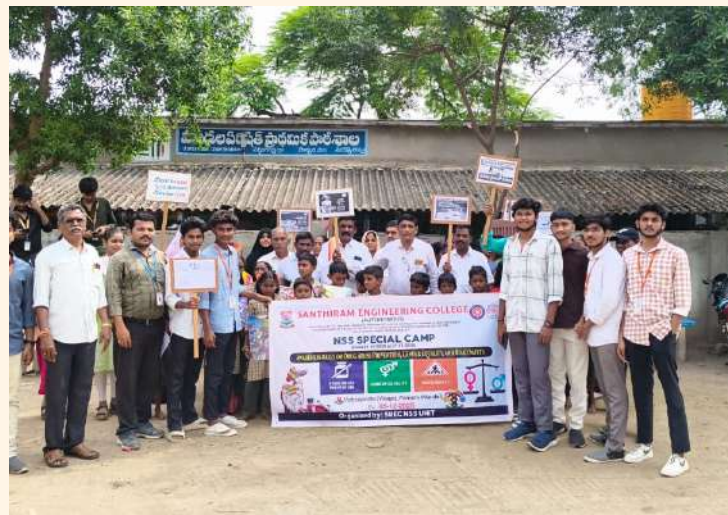
నంద్యాల, డిసెంబర్ 05. (పల్లె వెలుగు):