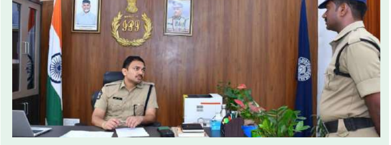
పల్లె వెలుగు సంస్థల క్రెమ్