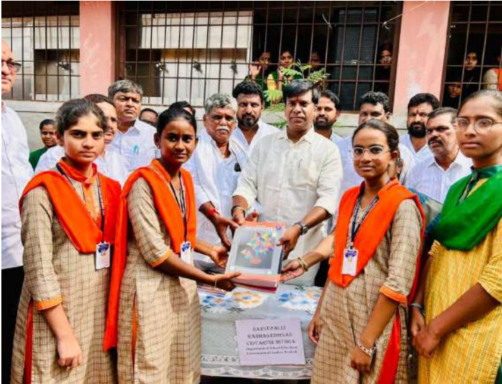
పేరెంట్స్ టీచర్స్ మీటింగ్ 3.0 కార్యక్రమంలో ఎమ్మెల్యే బీవీ జయ నాగేశ్వర్ రెడ్డి,,,,,,