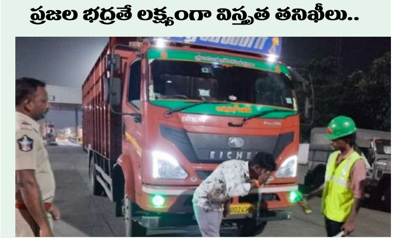
పల్లె వెలుగు సంస్థల క్రెమ్.