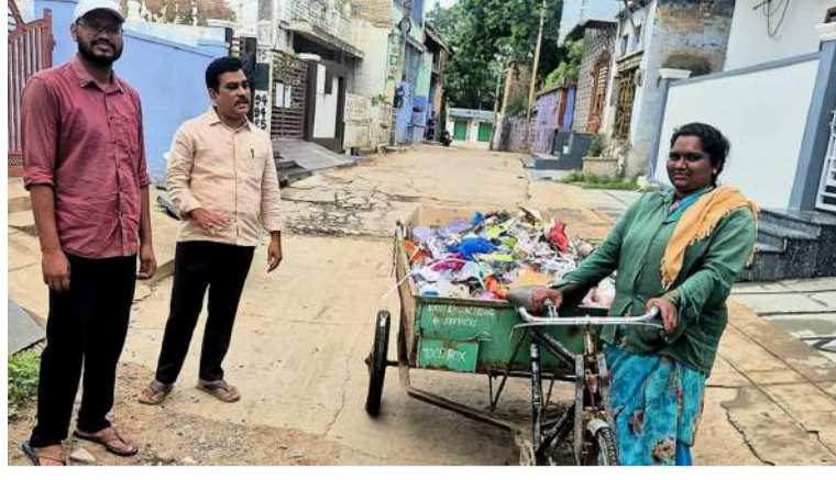
నీటి సరఫరా పథకానికి ప్రత్యక్షమై పొడి చెత్తను తీసుకొని వెళుతూ ఉండటంతో గ్రామ ప్రజలు ఆనందం వుక్తం చేస్తున్నారు. ఇలాంటి పరిస్థితిని ఇదేవిధంగా కొనసాగించాలని ఆయా గ్రామాల ప్రజలు కోరుకుంటున్నారు.

బహిరంగ రహస్యం. ఇంటర్ ఆక్టివ్ వాయిస్ రిస్పాండ్ సిస్టం ( బి వి ఆర్ యస్ ) పరిధిలో ఉన్న బండి ఆత్మకూరు, రామాపురం, సింగపరం, పెద్దదేవలూపురం, గాలి చెన్నయ్యపాలెం, కాకునూరు,ఎర్రగుంట, పెద్దదేవలూపురం, లింగాపురం, కడమల కాలువ, బి కోడూరు, భోజనం, గ్రామాలలోని పంచాయతీ కార్యదర్శులు పొడి చెత్తను ఎత్తివేసి వేసే కార్యక్రమంలో నిమగ్నం అయిపోయారు. గ్రామీణ రక్షిత సంబంధించి లీకేజీలను మరమ్మత్తు కార్యదర్శులు తల మునకలవుతూ ఉన్నారు. గత మూడు రోజులుగా గ్రామాలలో హరిత